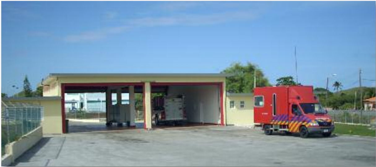
Gebouw Brandweer en Ambulance

Afrondend dient te worden opgemerkt dat Barber het merendeel van genoemde voorzieningen en faciliteiten met andere zusterzones in de omgeving deelt.