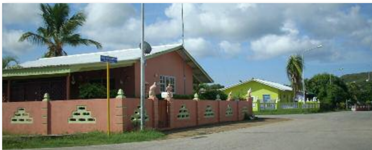
Goed onderhouden volkswoningen

Een uitzondering vormen een deel van de Kaminda Prospero Rojer, waar langs lege flessen en kartonnen dozen te zien zijn alsook een pleintje bij de volkswoningen dat helemaal is volgegroeid. Een positief punt hierbij is dat momenteel een aantal overheidsarbeiders schoonmaakwerkzaamheden verrichten in de Zone.