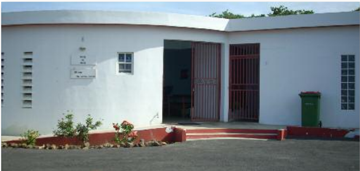
Medisch en Prik Centrum Barber

Al bij al vereist het geven van een betrouwbare mening over het onderwerp ‘Gezondheid’, echter de beschikking over cijfers afkomstig van officiële Instituten op het betrokken gebied. Dit maakt het verrichten van nader onderzoek hierbij noodzakelijk.