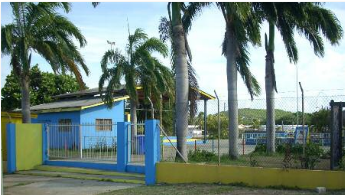
Plaza Himno i Bandera