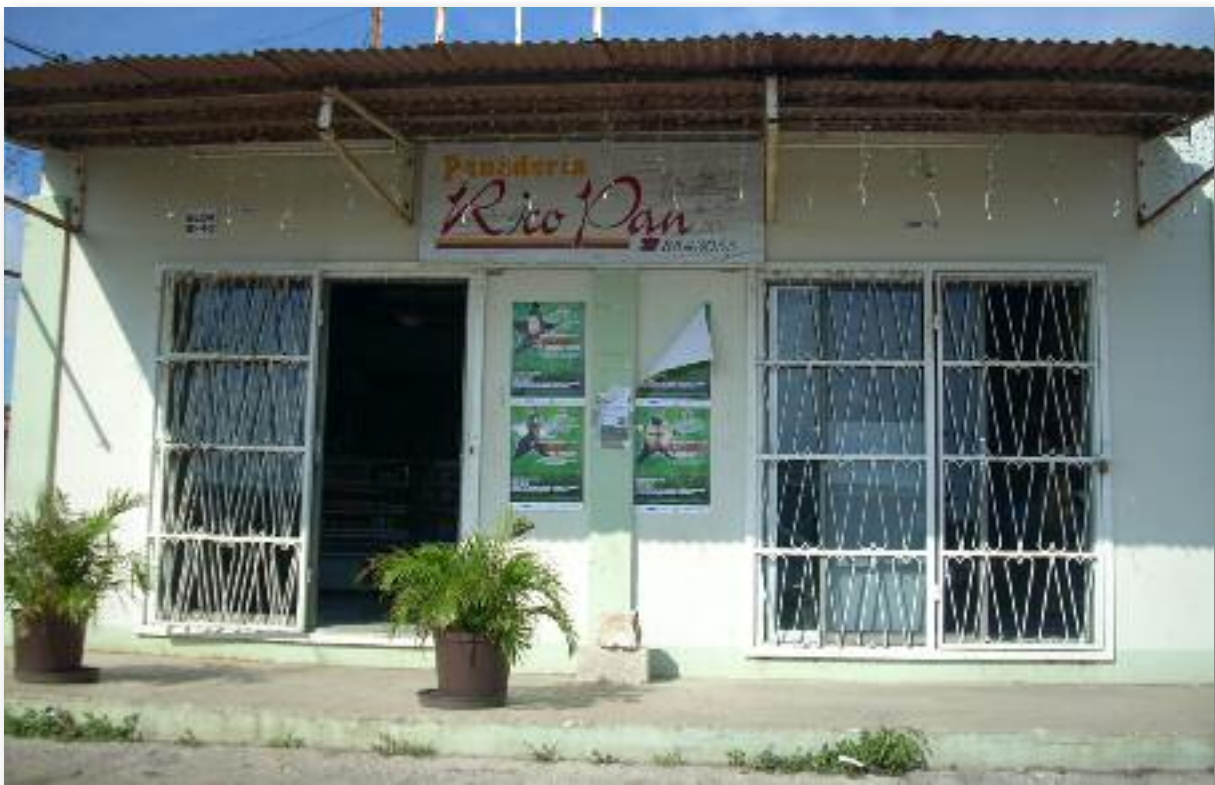
Colombiaanse bakkerij Rico Pan