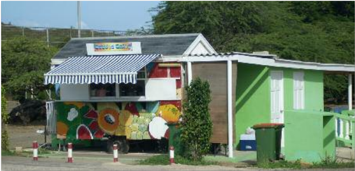
Batido-kraampje in centrum Barber