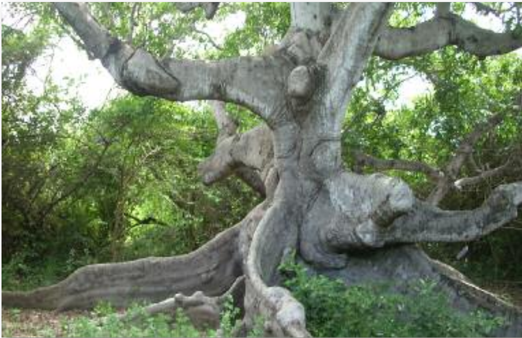
800 jaar oude kapokboom

Een bijzonderheid is dat in het hofje van de pastorie, een ruim 800 jaar oude kapokboom staat. Het is ruim 70 meter hoog en heeft een dikke flesvormige stam. Volgens kenners is dit de oudste boom van Curaçao.