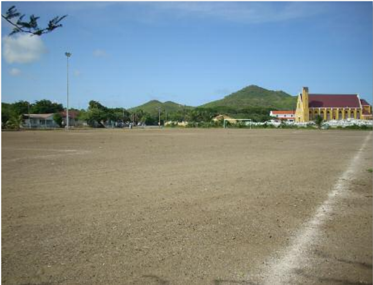
Voetbalveld Centro Barber met kerk op de achtergrond

Verder spelen jongeren, volwassenen en ouderen, in het bijzonder gedurende de weekeinden, traditioneel domino en kaarten bij een snack, onder een boom of bij vrienden thuis. Sportvormen als zwemmen, duiken en vissen komen minder voor dan in plaatsen als Westpunt en Lagun die aan zee liggen.