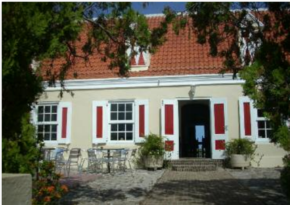
Porch Landhuis Ascension

Het ontstaan van verreweg de meeste dorpen, wijken en zones op Curaçao hebben ongeveer dezelfde voorgeschiedenis, met hier en daar kleine verschillen vanwege o.a. hun ligging. Dit geldt in het bijzonder voor de Zones van Bándabou, die in wezen een gezamenlijke streekgeschiedenis hebben. Hun ontstaan is namelijk onafscheidbaar verstrengd met de geschiedenis van het plantagebedrijf, dat omstreeks 1660 opgang kwam. Dit vanwege de groeiende betekenis van het eiland als centrum van de slavenhandel, dat de verbouw van voedselproducten noodzakelijk maakte. Naast de zogeheten Compagnie-tuinen (kleine landbouwgronden) in het Stadsdistrict, werden ook elders plantages aangelegd. De eerste Compagnieplantages in Bándabou, dateren uit het derde trimester van de 17de eeuw”. Plantage Barbara (ook wel Cabrietenberg genaamd), is echter van latere datum; namelijk in het eerste decennium van de 18de eeuw.