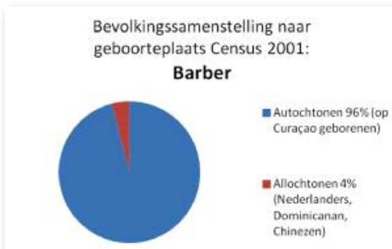
Bevolkingssamenstelling naar geboorteplaats