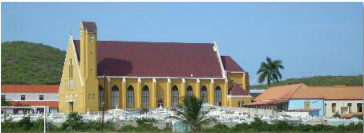
De historische kerk van Barber

In omschreven kader is de betekenis van Barber voor Bándabou groot te noemen. Parochie Barber werd namelijk reeds in 1832 opgericht als 2de Parochie op het eiland na Parochie Sta. Anna (1752) in Willemstad. Barber is ook de tweede plaats op Curaçao waar sinds 1827 elke zondag kerkdiensten plaats vonden. Van 1732 tot 1827 werden diensten vrijwel uitsluitend in de St. Anna kerk gehouden.