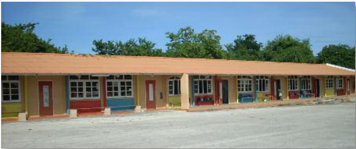
Vleugel Basisschool Kolegio San Hose

De schoolparticipatie onder kinderen van 6 t/m 14 jaar is de laatste jaren erg hoog op Curaçao. Dit geldt ook voor de zone Barber. Een en ander wordt bevestigd door informanten in het veld. Deze ontwikkeling heeft in hoge mate te maken met de geldende leerplichtwet en uiteraard ook met de verdere evolutie van de democratisering van het Onderwijs. Ook de schoolparticipatie bij 15-19 jarigen valt erg positief uit in Barber. In 2001 was dit 81,4% tegenover een gemiddelde van 81,5% voor geheel Curaçao.