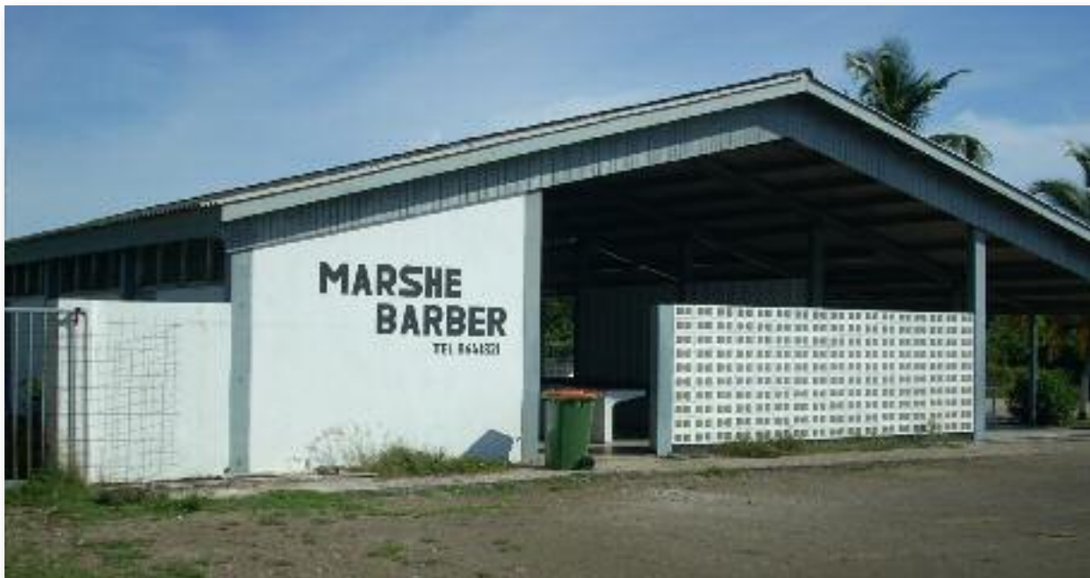
Moderne Markt en Slachthuis

Ongeveer begin jaren '60 bereikten de elektriciteitsvoorziening en de waterleiding ook Barber en omgeving. Dit betekende uiteraard een grote stap in het ontwikkelingsproces van deze Zone. Met de definitieve intrede van de familieauto in de jaren 60 van de vorige eeuw en daarna ook het publieke transport, geraakte de Zone definitief uit haar isolatie. In 1964 opende Benzinstation Barber haar deuren, terwijl Barber in 1968 een moderne markt (later ook slachthuis) kreeg.