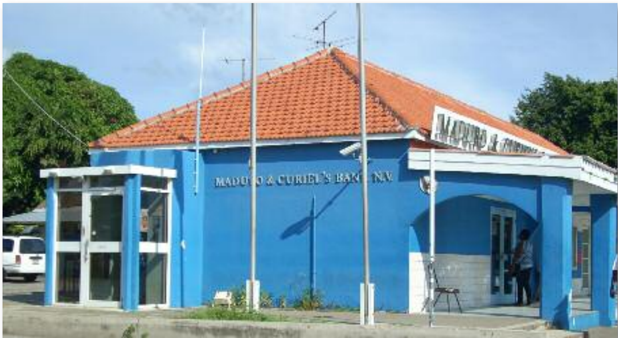
De Maduro & Curiel's Bank in Barber

Barber heeft alle karakteristieken van een hoofddorp of hoofdplaats. Er is een Bank en twee geldautomaten, twee medische centra en een prikcentrum, een apotheek, een politiepost en ambulance/brandweer kazerne, marktgebouw/slachthuis, pompstation alsook verschillende snacks, toko's, minimarkets, winkels, bar/restaurants, bakkerij, bati-dokraampje, barbershop, kapsalon en tire service. Alles echter op kleine schaal. Grote inkopen worden meestal in de stad gedaan.