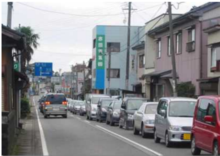
●渋滞状況(田上町羽生田から新潟市方向を望む)