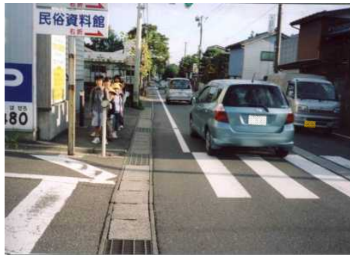
●歩道未整備区間(田上町田上から新潟市方向を望む)