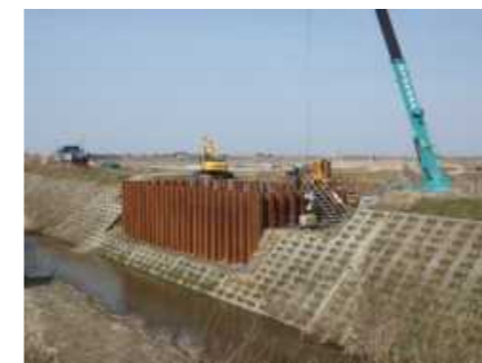
●才歩川大橋整備状況(橋台施工)