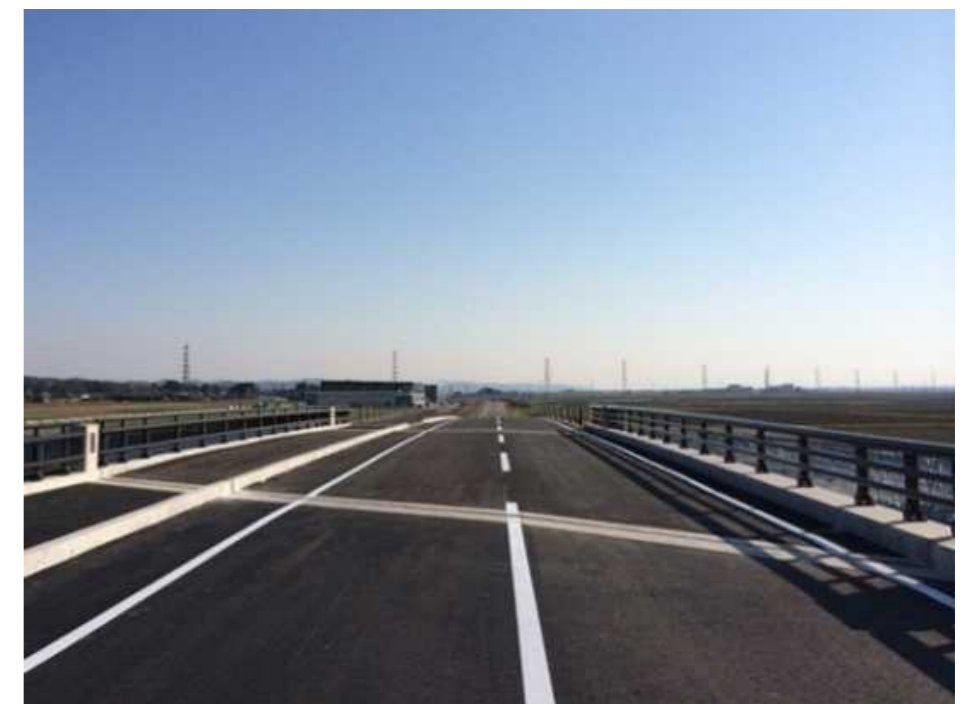
●才歩川大橋完成状況(加茂市を望む)