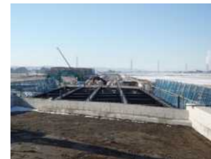
●才歩川大橋整備状況(桁架設後)