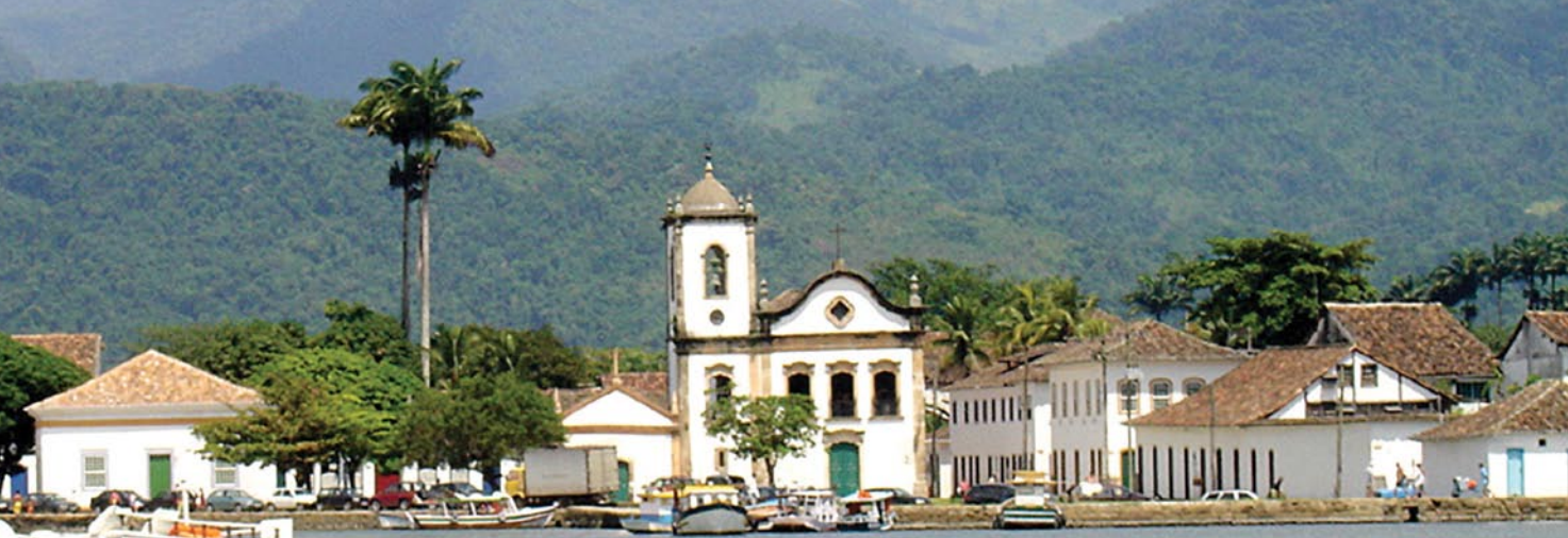
Vista do porto