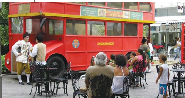
Praça da Inglaterra

Com localização privilegiada na Barra da Tijuca/RJ, o Barra World inova por ser um shopping temático, que reproduz os monumentos mais famosos de vários países do mundo. Ali estão representados a Torre Eiffel da França, a Torre de Pisa da Itália, os moinhos da Holanda, a Esfinge do Egito, um típico Pagode japonês, e a Ponte da Torre da capital inglesa.