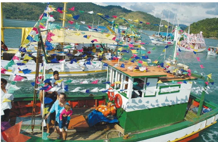
Cortejo dos padroeiros

de barcos que percorrem as praias e o porto da região. Considerado o protetor dos navegantes, São Pedro é homenageado pelos pescadores, que