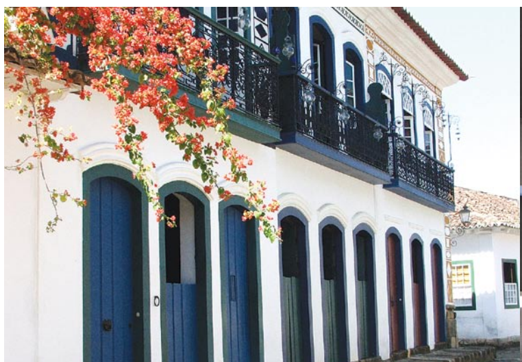
Casario do centro histórico

Paraty foi fundada no ano de 1597. O pequeno povoado surgiu em volta da Igreja de Nossa Senhora dos Remédios, padroeira do lugar. A sua localização estratégica foi de grande importância para o comércio de cana-de-açúcar e mais tarde para escoamento de ouro. No dia 28 de fevereiro de 1667, a Carta Régia