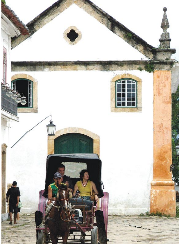
Igreja Nossa Senhora do Rosário e S. Benedito

Através de passeios pelo Centro Histórico de Paraty o visitante é levado ao passado, desfrutando o conhecimento inigualável da história, sem muito esforço. As ruas fechadas ao tráfego possuem somente o burburinho dos turistas, hoje a maior fonte de renda da região. Os velhos casarões bem preservados, as igrejas simples ou ricamente ornadas retratam uma época de opulência.