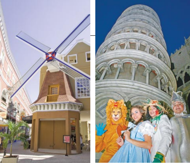
Praça da Holanda e Praça da Itália