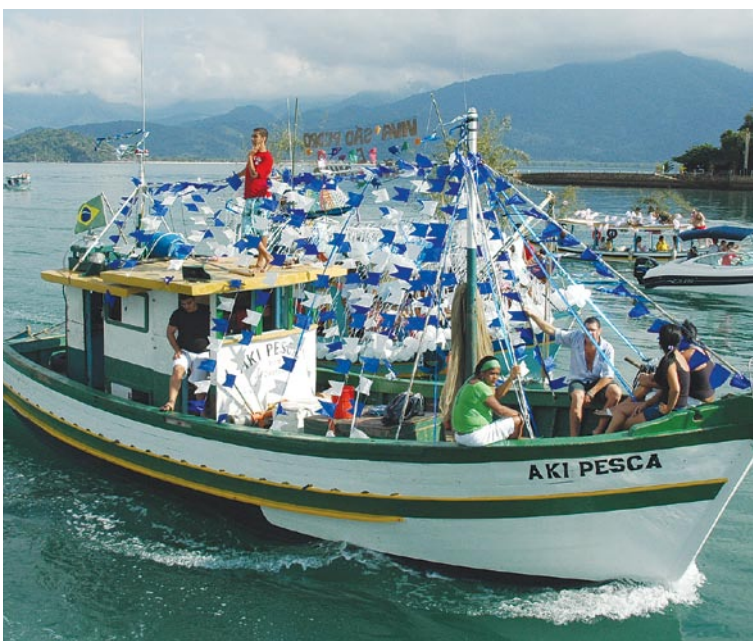
Procissão de São Pedro