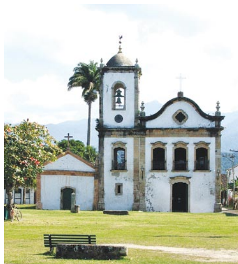
Igreja de Santa Rita