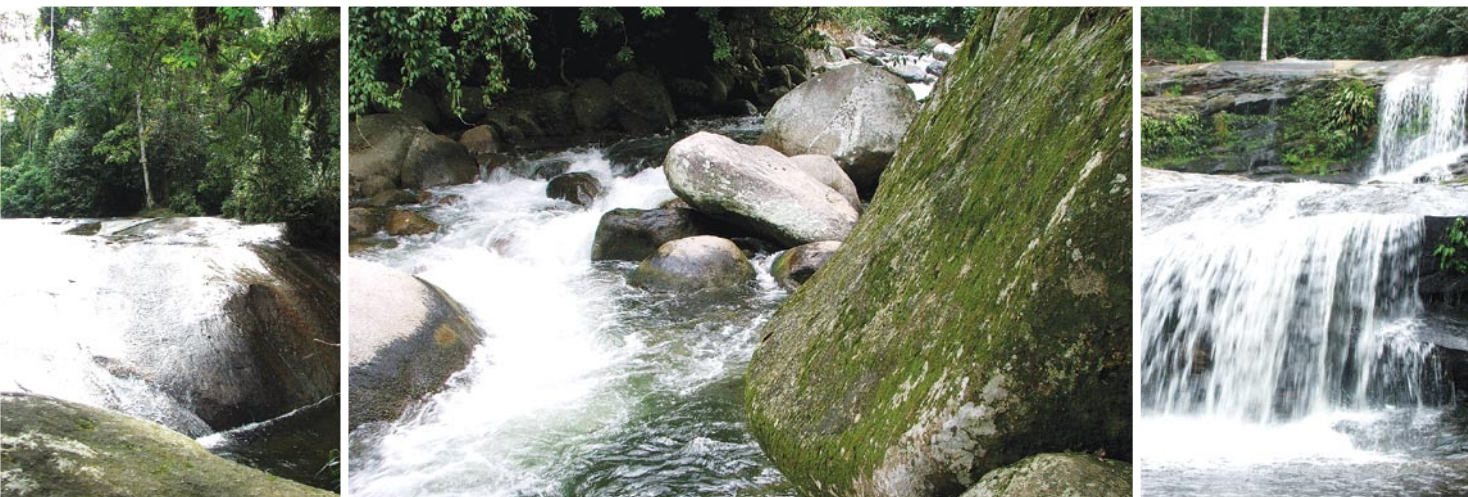
Cachoeiras do Tobogã, da Engracia e do Iriri no Taquari