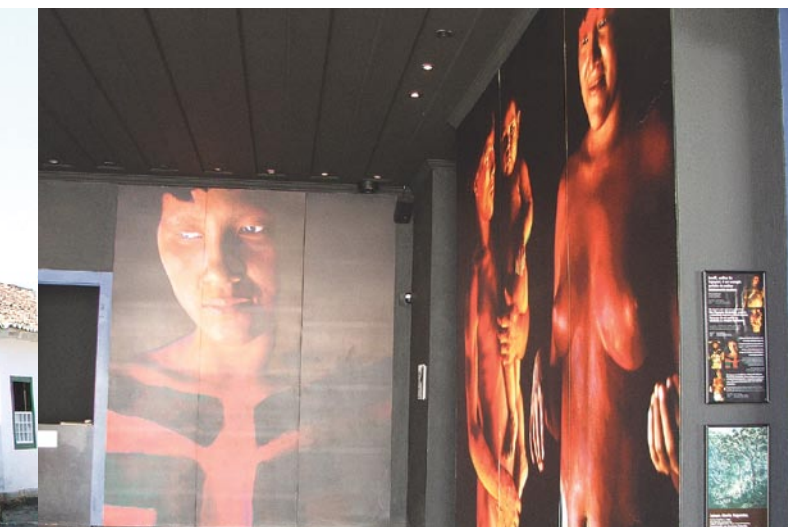
Casa de Cultura

Vale do Paraíba, a antiga trilha de burros pela Serra do Mar perderia sua função.