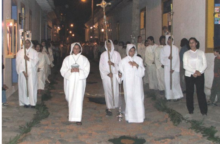
Procissão do Divino Espírito Santo

levam os instrumentos de pesca para serem bentos durante a festividade.