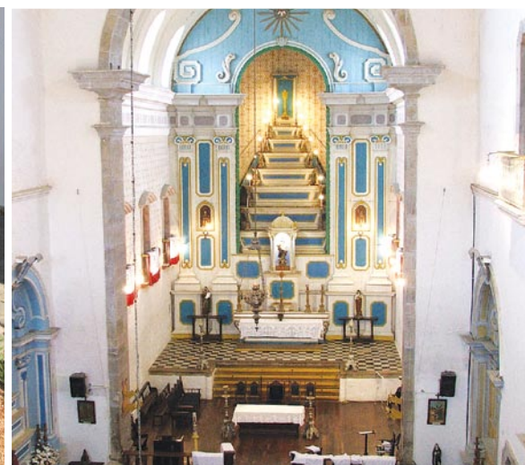
Igreja Nossa Senhora dos Remédios

geral, fazendo com que o comércio local passe a consumir os produtos típicos de Paraty (beiju, geléias, farinha de mandioca, tapioca, balaios, café-de-caldo-de-cana e tantos outros).