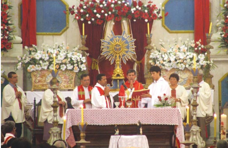
Missa na Semana Santa

de barcos que percorrem as praias e o porto da região. Considerado o protetor dos navegantes, São Pedro é homenageado pelos pescadores, que