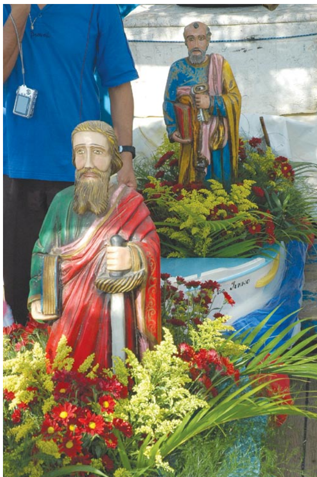
Imagens de São Paulo e São Pedro

Hoje, além da imagem de São Pedro num barco, os navegantes da região também levam a de São Paulo, homenageando os dois santos padroeiros. Como já é costume, escunas de turistas também acompanham a procissão.