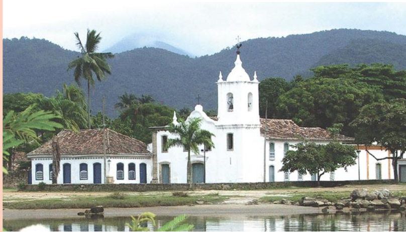
Igreja Nossa Senhora das Dores