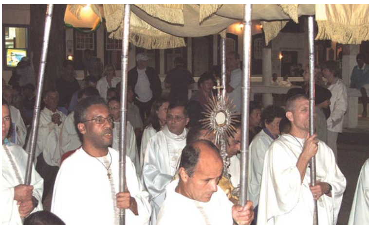
Festa do Divino

A festa de São Pedro é tradicional em Paraty, já que a procissão acontece com um grande cortejo