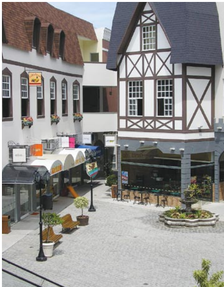
Praça da Alemanha