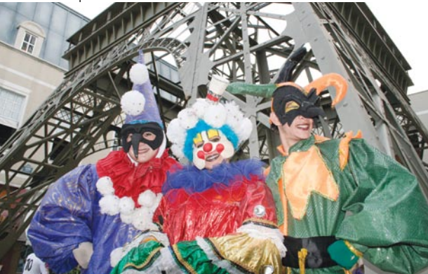
Praça da França