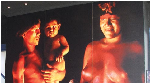
Índios da região

A riqueza da floresta nativa da região e a abundância de fibras vegetais, como taquara, bambu, palha do coco, taboa e cipós, fizeram com que o artesanato de cestos e outros produtos aumentasse nos últimos tempos.