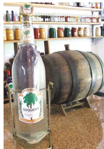
Alambique do Coqueiro