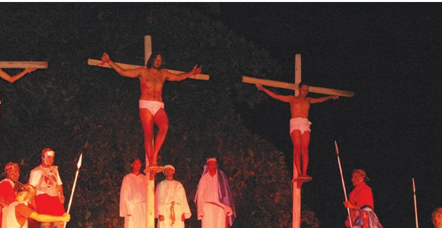
Teatro – Um Homem Chamado Jesus