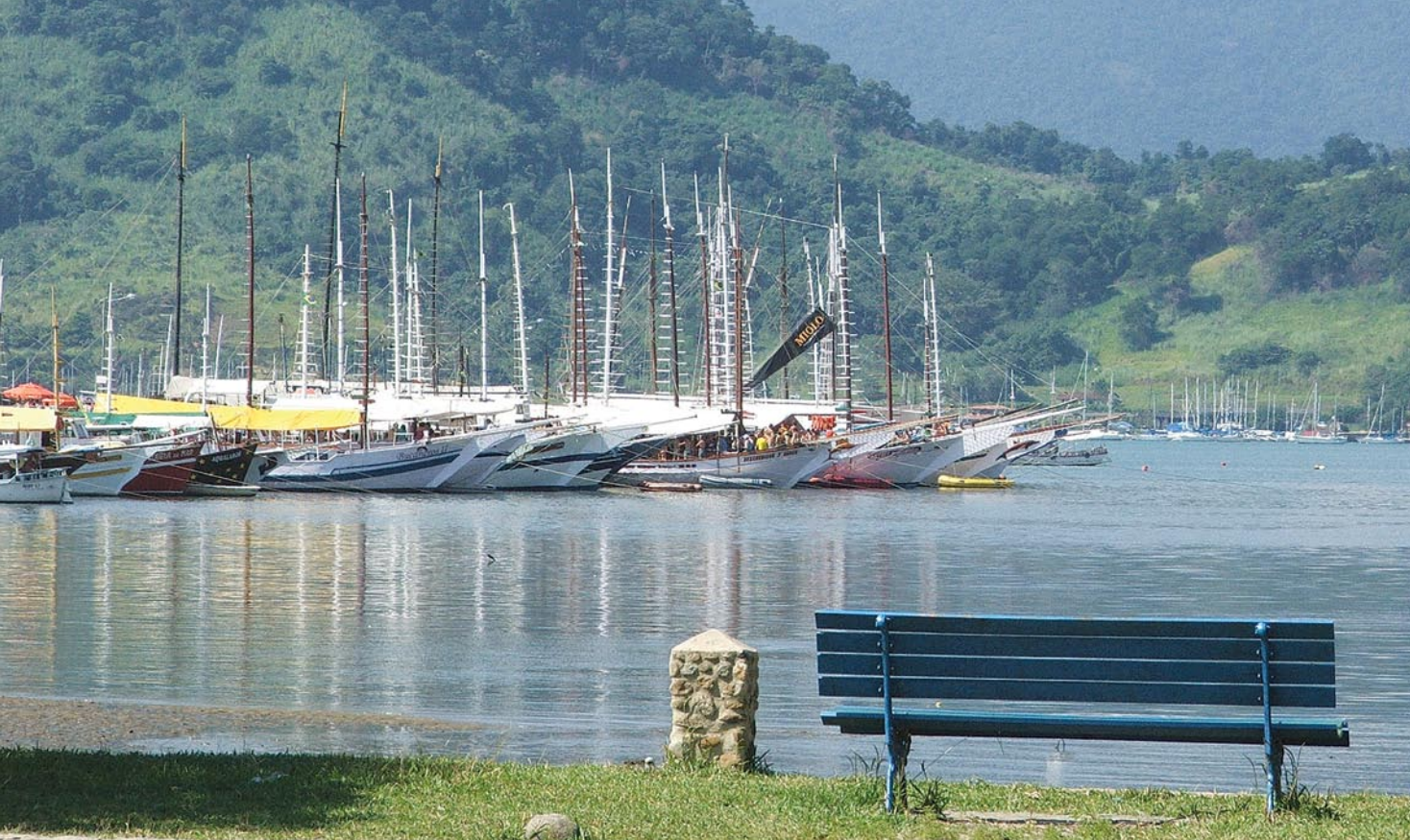
Embarcações no porto