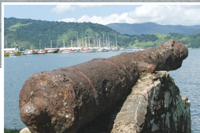
Canhão do porto

A Unesco consagrou Paraty como o conjunto arquitetônico do século 18 mais harmonioso de todo o país. A bela cidade histórica que se modernizou a partir de 1726, traçada pela engenharia