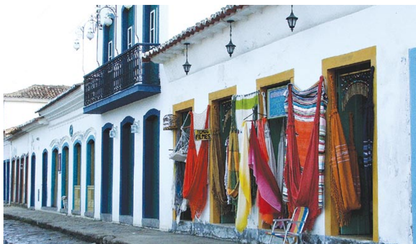
Loja de artesanato local