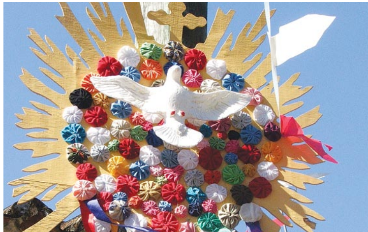
Festa do Divino

1722, quando a igreja de Santa Rita foi inaugurada. Tem início na última semana de julho e dura 10 dias. Os fiéis enfeitam o interior da igreja, onde acontecem missas diárias. As casinhas antigas recebem toalhas e flores nas janelas. Como acontece sempre, barraquinhas de comidas típicas dão o tom de quermesse ao evento.