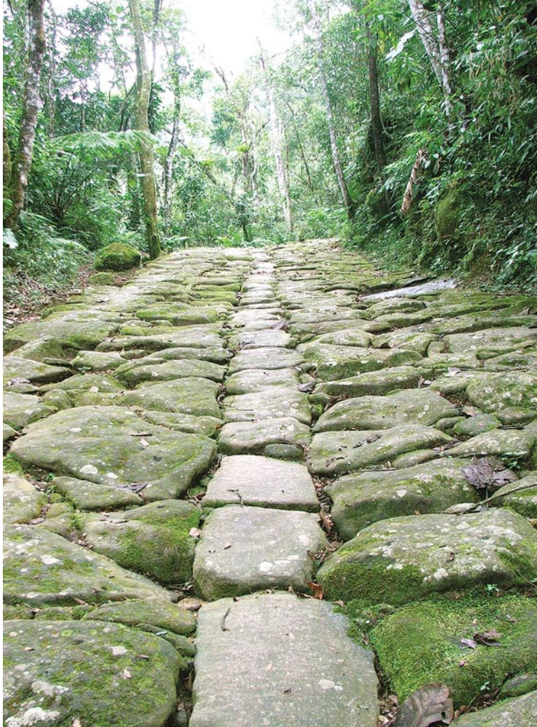
Caminho do Ouro

A Maçonaria dos senhores ricos teve uma forte influência na arquitetura local. É possível distinguir os símbolos maçônicos em muitos sobrados, nas ruas: monumentos e esquinas. Os mais característicos são os três cunhais (colunas) em cantaria (pedra lavrada), formando um triângulo, símbolo maçônico.