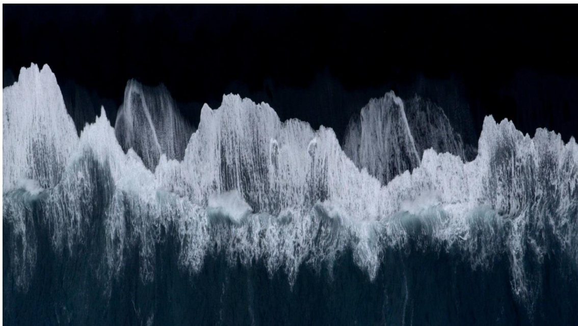
© CMN Paris – la mer

Suite à la campagne de restauration du réduit et de la tour sud-est du monument , le CMN élargit le parcours de visite et ouvre ainsi de nouveaux espaces au public, notamment l'écurie, l'ancienne laiterie et la terrasse couvrant l'écurie, offrant ainsi une vue imprenable sur la place d'armes.