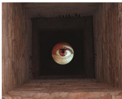
© Antoni Muntadas / CMN Paris

Caisson lumineux : métal, tirage photographique sur Duratrans, néons, circuits électriques