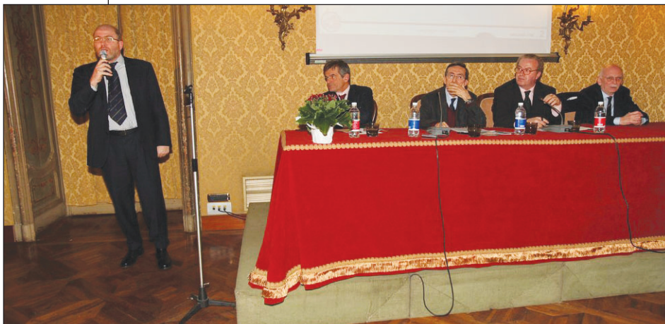
Chiamparino: "L'associazionismo è un importante tessuto sociale che tiene insieme relazioni, cultura, sport e tempo libero. Ma regge solo chi ha qualcosa da dire"