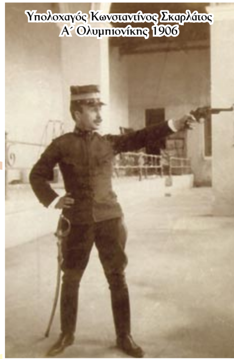
Υπολοχαγός Κωνσταντίνος Σκαρλάτος Α' Ολυμπιονίκης 1906

Όπως και στους Ολυμπιακούς Αγώνες του 1896, έτσι και στη Μεσολυμπιάδα του 1906, οι άνδρες των Ενόπλων Δυνάμεων, αξιωματικοί και οπλίτες, εντυπωσίασαν με τις μεγάλες στολές στο Στάδιο και με τη συμμετοχή και τις επιδόσεις τους στα αγωνίσματα. Ο Υπολοχαγός Πυροβολικού Κωνσταντίνος Σκαρλάτος κέρδισε την πρώτη θέση στο πιστόλιο μονομαχίας 25 μέτρων «δια παραγέλματος». Ήταν, επίσης, Ολυμπιονίκης με