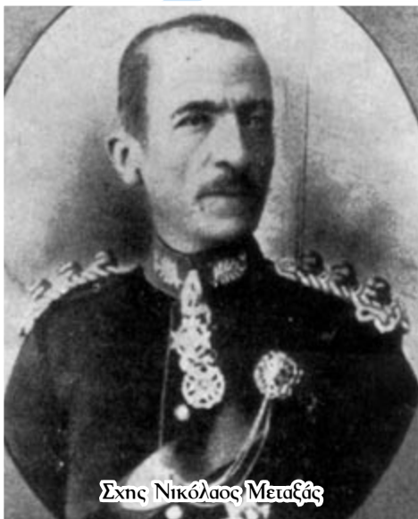
Σχης Νικόλαος Μεταξάς

Ο δύσκολος και κρίσιμος τομέας της ασφάλειας και τήρησης της τάξης κατά τη διάρκεια των Ολυμπιακών Αγώνων του 1896 ανατέθηκε τότε στις Ένοπλες Δυνάμεις (ΕΔ). Η γενική διεύθυνση του Σταδίου είχε ανατεθεί στον Συνταγματάρχη Νικόλαο Μεταξά, Διοικητή της Στρατιωτικής Σχολής Ευελπίδων (ΣΣΕ). Στον Συνταγματάρχη Δημήτριο Μπαϊρακτάρη (1833-1900), Διευθυντή της Στρατιωτικής Αστυνομίας Αθηνών, ανατέθηκε η επιτήρηση του Σταδίου, καθώς και η ασφάλεια και εξυπηρέτηση των ξένων επισκεπτών, η οποία υπήρξε άφογη και υποδειγματική. Το 7 ο Σύνταγμα Πεζικού από τη Χαλκίδα είχε μετασταθμεύσει στην Αθήνα για την ενίσχυση της Φρουράς κατά τους Αγώνες. Τριάντα αξιωματικοί είχαν ορισθεί ως «κοσμήτορες» επόπτες του Σταδίου κατά τη διάρκεια των Ολυμπιακών Αγώνων και πολλοί άλλοι συμμετείχαν στις «Αγωνόδικες Επιτροπές». Στρατιωτικοί γιατροί είχαν ορισθεί για τα υγειονομικά θέματα και παρείχαν υποστήριξη με ιατροφαρμακευτικά υλικά και χειρουργικές σκηνές καθόλη τη διάρκεια των Αγώνων. Η στρατιωτική Διλοχία Σκαπανέων και Πυροσβεστών του Μηχανικού είχε αναλάβει τα θέματα πυροπροστασίας και πυρόσβεσης.