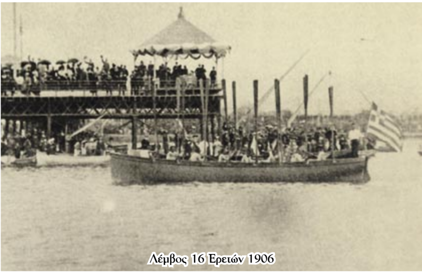
Λέμβος 16 Ερετών 1906

ναυτικούς αγώνες των λεμβοδρομιών, και όσοι τους παρακολουθούσαν ξέσπασαν σε ζητωκραυγές και χειροκροτήματα.