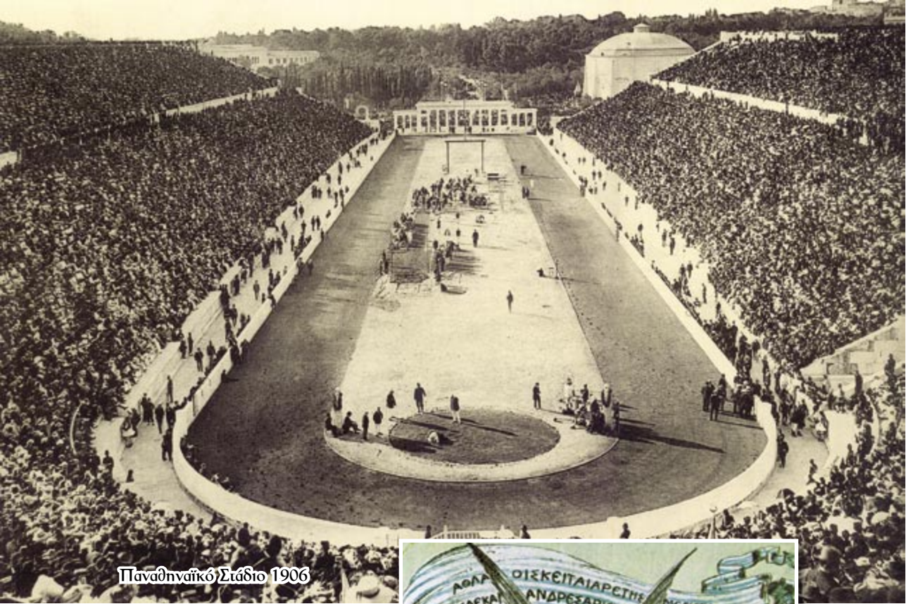
Παναθηναϊκό Στάδιο 1906

Είναι γνωστό ότι ο ρόλος των Ενόπλων Δυνάμεων (Στρατού και Ναυτικού, τότε) στην προετοιμασία και διεξαγωγή των πρώτων Ολυμπιακών Αγώνων του 1896 ήταν κυρίαρχος και καθοριστικός. Το πολύπλευρο έργο τους αποτυπώθηκε στον τύπο της εποχής και αναλύθηκε από τους Έλληνες και ξένους συγγραφείς με τα πλέον κολακευτικά λόγια. Η αθηναϊκή εφημερίδα «ΕΜΠΡΟΣ», έγραψε: «...η Ελλάς του ηρωισμού, η Ελλάς της ανδρείας, η Ελλάς της δόξης, η Ελλάς των Ολυπίων θεών και των Ολυμπιακών Αγώνων, η δαφνοστεφανομένη Ελλάς, η επί ωρισμένας του μακρού και ενδόξου βίου της περιόδους, αντί σκήπτρου, κλάδον ελαίας ανά χειρας φέρουσα και την ανθρωπότητα πάσαν αδιακρίτως εχθρών και φίλων, εις εορτάς ακμής, υγείας και σθένους συγκαλούσα, η Ελλάς ήρχιζε να αναζή και πάλιν».