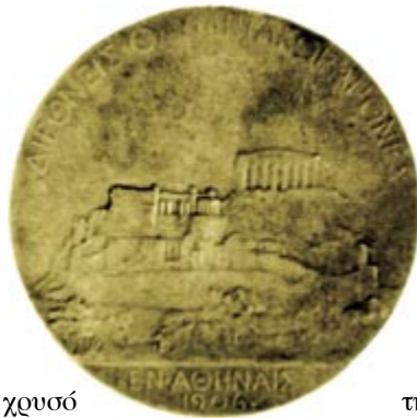
Μετάλλιο Κωνσταντίνου Σκαρλάτου

χρυσό μετάλλιο, στο ίδιο αγώνι- σμα και στους Ολυμπια- κούς Αγώνες του 1900, στο Παρίσι.