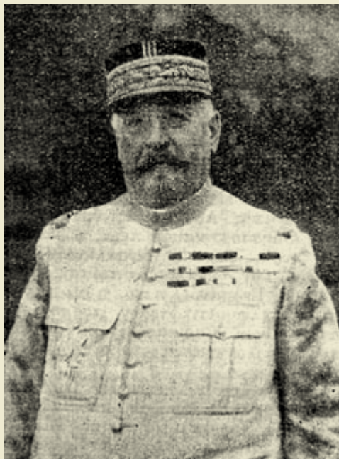
Ο Στρατηγός Berthelot.

του για τις θαυμάσιες στρατιωτικές αρετές που επέδειξαν στη Βεσσαραβία κάτω από τις διαταγές του. Αφού επί πολλούς μήνες έδειξαν την αξία τους και τη συναδελφικότητα τους μαχόμενα μαζί με τα γαλλικά στρατεύματα κάτω από τις διαταγές του Στρατηγού Ντ' Ανσέλημ, έδωσαν το ωραιότερο παράδειγμα καρτερικότητας και λαμπρής διαγωγής. Η διαγωγή τους προκάλεσε το θαυμασμό όλων των γαλλικών τμημάτων που βρίσκονταν σε επαφή με αυτά. Ο Στρατηγός Γκλιωντέλ χαιρετά τις ένδοξες σημαίες τους, απευθύνει προς άπαντες τους αξιωματικούς, υπαξιωματικούς και στρατιώτες τις θερμές τους ευχαριστίες. Εύχεται σε αυτούς από καρδιάς και εξ ονόματος όλων των Γάλλων συναδέλφων του, την επιτυχή εξακοπούθηση του λαμπρού τους έργου, μέχρι τη θριαμβευτική επάνοδό τους στις εστίες τους».