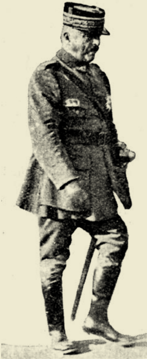
Ο Αρχιστρατηγός D' Esperey.

Ουκρανία με τα πλοία «Χερσών» και «Χί-ορς» που απέπλευσαν από τον όρμο του Σταυρού στις 9/22 Φεβρουαρίου και 20 Φεβρουαρίου/6 Μαρτίου αντίστοιχα. Το