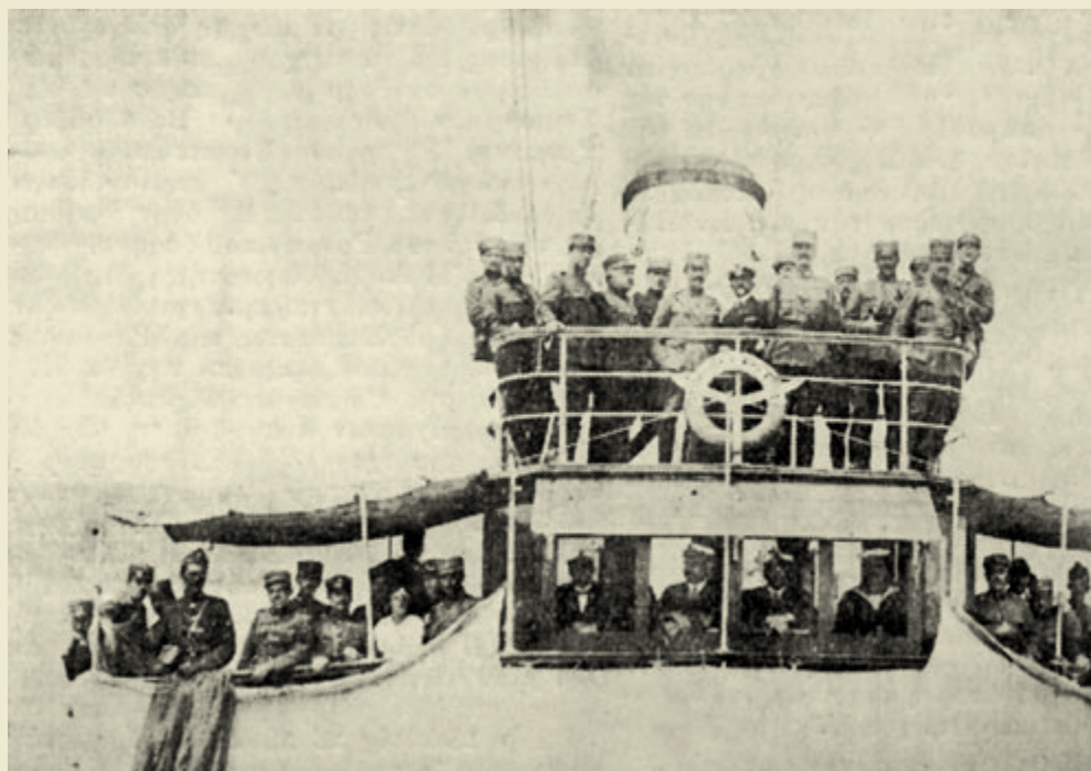
Το Επιτελείον του Α΄ Σ. Στρατού επί της «Αμφιτρίτης» εν πλώ προς Σμύρνην εκ Ρουμανίας.

στη Ρωσία κυρίως αποικιακό στρατό ο οποίος δεν είχε καμία διάθεση να πολεμήσει. Υπήρξαν δε περιπτώσεις γαλλικά στρατεύματα να στασιάζουν και να ενώνονται με τους Μπολσεβίκους.