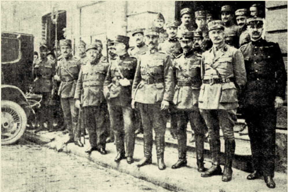
Ο Στρατ. Νίδερ μετά του επιτελείου του, έξωθι της εν Κων/πολεις Ελλ. Πρεσβείας μετά την άφιξη των εκ Ρουμανίας (31 Μαΐου 1919).

χίες, δύναμη 23.351 άνδρες. Η In Μερραρχία δεν έλαβε μέρος στις επιχειρήσεις, αλλιά παρέμεινε συγκεντρωμένη στην Καβάλλα).