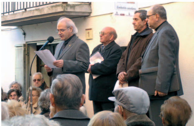
Placa commemorativa i autors dels parlaments.

►► Al monestir de Ripoll han començat les obres per a arranjar la teulada. Es farà un sistema de canalització nou per a evitar humitats i es canviaran les teules de les cobertes de les naus laterals. Es preveu que les obres durin fins a l'estiu de l'any vinent i són finançades per la Diputació de Girona, la Generalitat, l'Ajuntament, el Bisbat i la Parròquia. Aquesta ha endegat una campanya singular per comprar teules noves.