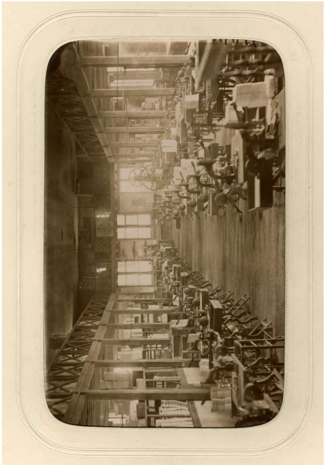
Papeterie Laroche- Joubert, usine de L'Escalier à La Couronne, vers 1880 Arch. dép Charente, Série Fi