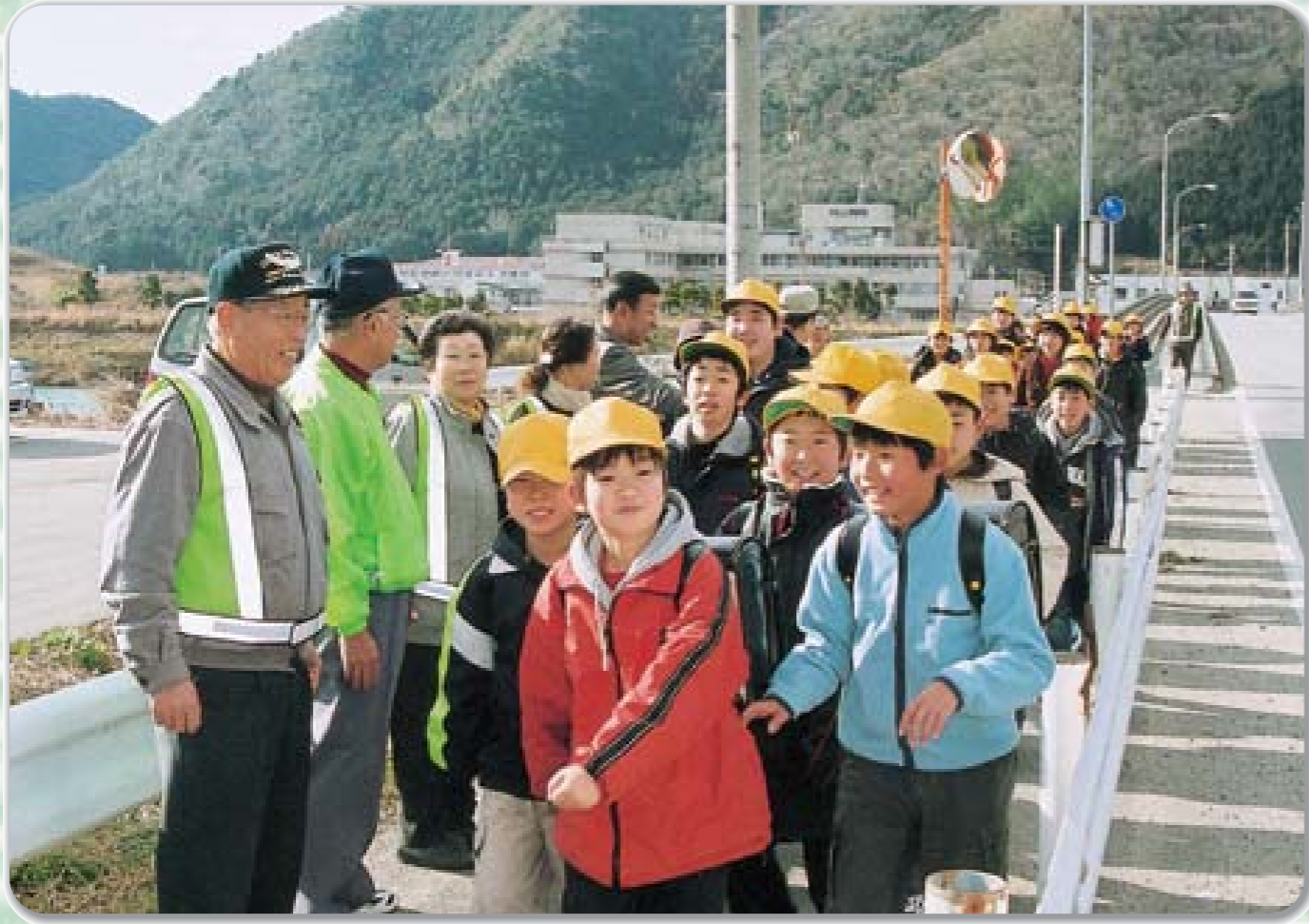
地域で子どもたちの安全を守ろう！ (2月21日 黒田地区での見回り活動)