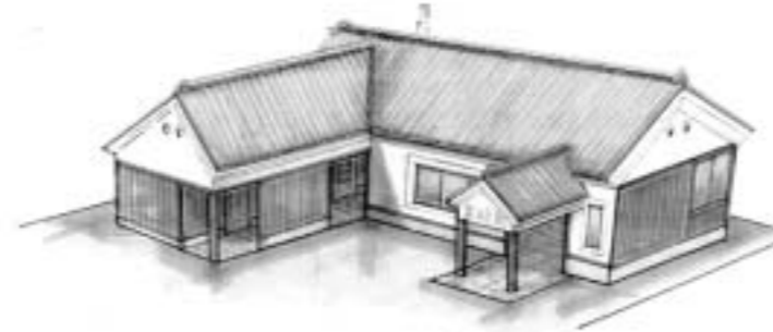
新しい駅舎のイメージ図(案)