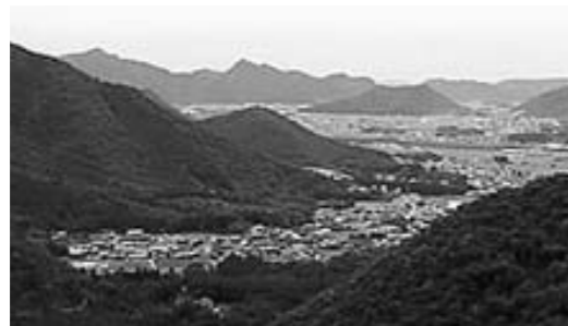
秋谷近辺から見た黒田庄市街地

白山に登ると山頂からは、直線距離で約40km先の瀬戸内海の風景の中に明石海峡大橋や六甲山脈などを望むことができ、その手前は西光寺山、笠形山などの山並みと加古川流域の町並みが見え、秋と冬には幻想的な雲海も見ることができます。