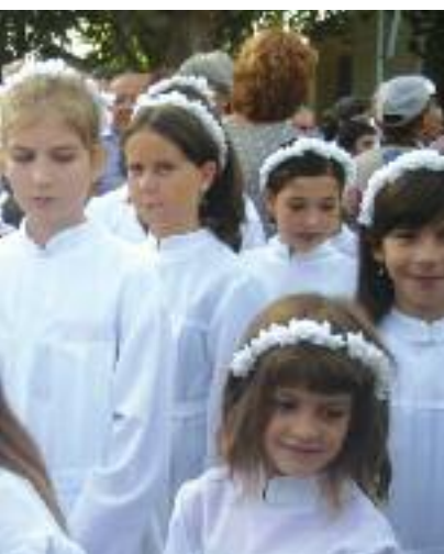
...esa solinitana durante la processione per...to la tradizione romana e la continuità...el Vino