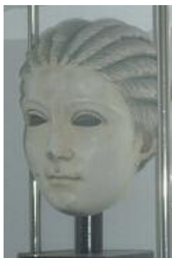
Testa marmorea di Plautilla, moglie dell'imperatore Caracalla, rinvenuta negli scavi di Salona