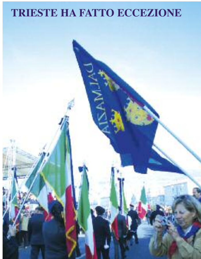
Nella significativa manifestazione organizzata a Trieste dalle Associazioni d'Arma in congedo, hanno sfilato il Labaro dei Volontari giuliano-dalmati della Grande Guerra e le bandiere d'Istria, Fiume e Dalmazia.

altre associazioni consorelle. Il 20 settembre scorso, in una data non significativa per il mondo degli esuli e che coincideva invece con le elezioni politiche slovene, l'UNI ha indetto una commemorazione dei Caduti in mare al largo di Trieste, in prossimità del confine marittimo con la Slovenia. Il fermo intervento del Prefetto Balsamo, del Sindaco Dipiazza e del Sottosegretario di Stato on. Menia ha fortunatamente fugato ogni dubbio sulla volontà degli esuli di non interferire con qualche atto dimostrativo, magari da parte di singoli, a favore di uno dei partiti sloveni in lizza. Cose che le associazioni degli esuli hanno sem-