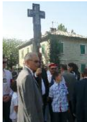
La croce dell'antica Diocesi salonitana che aveva giurisdizione anche su Zagabria, ha aperto la processione

Ha destato l'interesse anche della Televisione croata il fatto che Salona sia stata il centro dove ha avuto fine l'Impero con l'uccisione di Giulio Nepote, che è l'ultimo Imperatore romano d'Occidente. Con la sua morte ha cessato di esistere a Salona l'Impero romano d'Occidente che, per consuetudine, è considerato il momento in cui termina l'Evo antico ed inizia il Medioevo. A questo avvenimento non si era finora attribuito a Salona l'importanza che invece merita non solo sul piano storico.