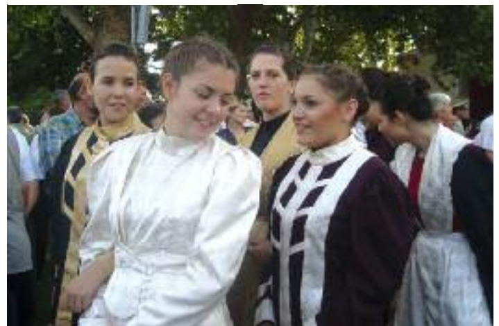
Ragazze di Salona con le vesti tipiche della tradizione medievale ancora radicata nell'antica capitale dell'impero