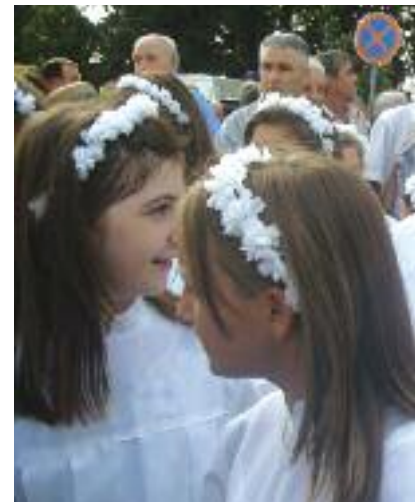
Le bambine con gli abiti dell'antica chiesa della Madonna piccola che hanno ricordato la mediterranea della Civiltà dell'Olio e del