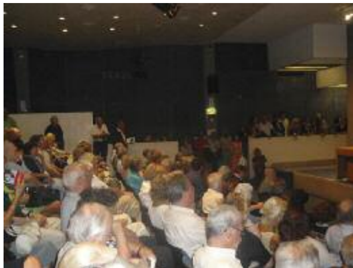
Pubblico delle grandi occasioni per Enzo Bettiza, al quale è stato conferito nel 2005 il Premio Tommaseo, il massimo riconoscimento attribuito dai Dalmati italiani nel Mondo a coloro che hanno dato lustro alla loro terra.

noscitore di lingue slave e tedesche, sottolinea l'importanza effettivamente rivoluzionaria che ebbe la Primavera di Praga e condiscende la presentazione del libro con gustosi aneddoti ed episodi che testimoniano il grande imbarazzo