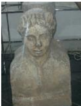
Busto di fattura romana risalente all'epoca d'oro di Salona