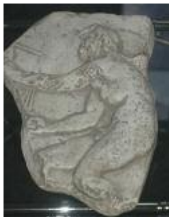
Satiro in stile greco che testimonia l'influenza della civiltà mediterranea in Dalmazia.