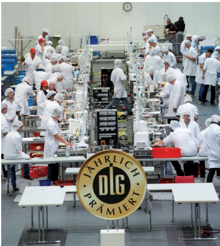
Die Zubereitung der TK-Produkte erfolgt bei den DLG-Tests in einer räumlich separaten Küche.

Ziel der sensorischen Produktanalyse durch produktspezifische Prüfschemata und geschulte Experten ist die objektive Beurteilung der fachlichen Fehlerfreiheit eines Lebensmittels gemäß der technologischen Möglichkeiten, der bestehenden Verkehrsauffassung und der guten Herstellerpraxis (sorgfältige Rohstoffauswahl, optimale Verarbeitung und Zubereitung).