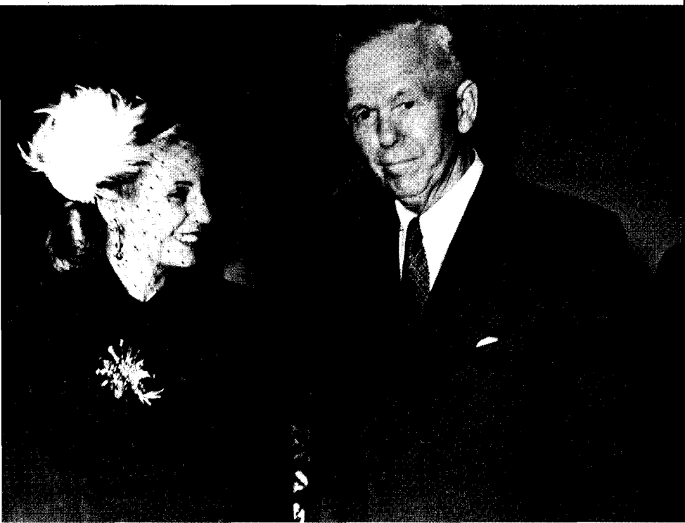
Eva Perón con George Marshall en Río de Janeiro, 1947.