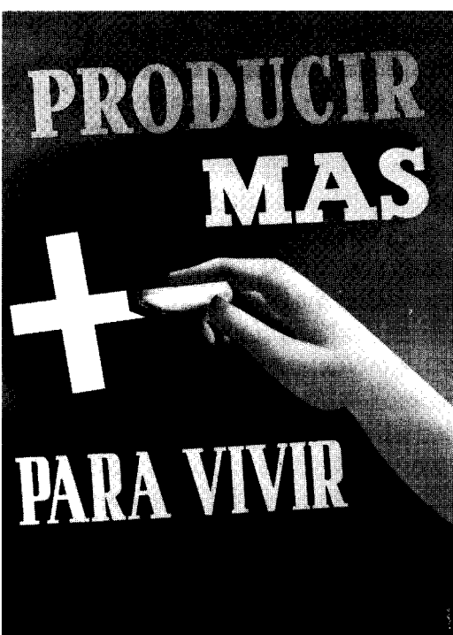
Propaganda oficial fomentando el incremento de la producción.

Ejercicio de una férrea disciplina fiscal y corte drástico con el régimen inflacionario que venía del pasado fue una original combinación que se repetiría varias veces a lo largo de la segunda mitad del siglo XX, casi siempre con un éxito transitorio. Durante 1952, todavía, el incremento de los precios fue de