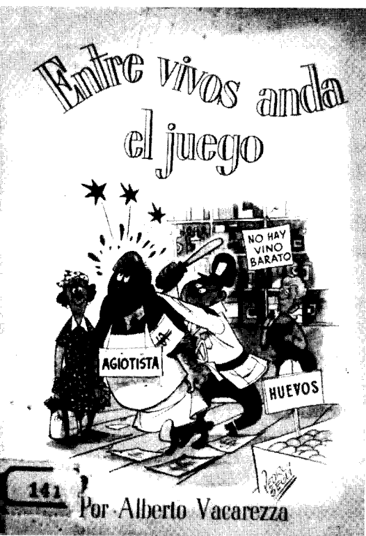
Pieza de Alberto Vacarezza sobre el agio.

El canto del cisne para una visión del mundo que apostaba a la guerra ocurrió durante el invierno boreal de 1950-1951. La invasión de Corea del Norte a Corea del Sur había sucedido en junio, pero la señal de alarma sonó cuando a fines de año las tropas norteamericanas, que habían intervenido para darle un final expeditivo al conflicto, fueron rechazadas más allá del paralelo 38 por el Ejército de Corea del Norte y por los voluntarios chinos. El general Mac Arthur reclamó la invasión a China; el Estado Mayor comunicó a los comandantes de las fuerzas estadounidenses esparci-