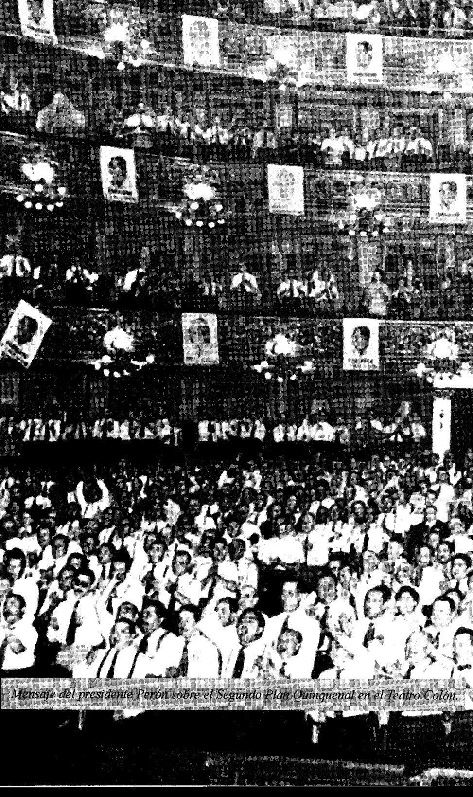
Mensaje del presidente Perón sobre el Segundo Plan Quinquenal en el Teatro Colón.