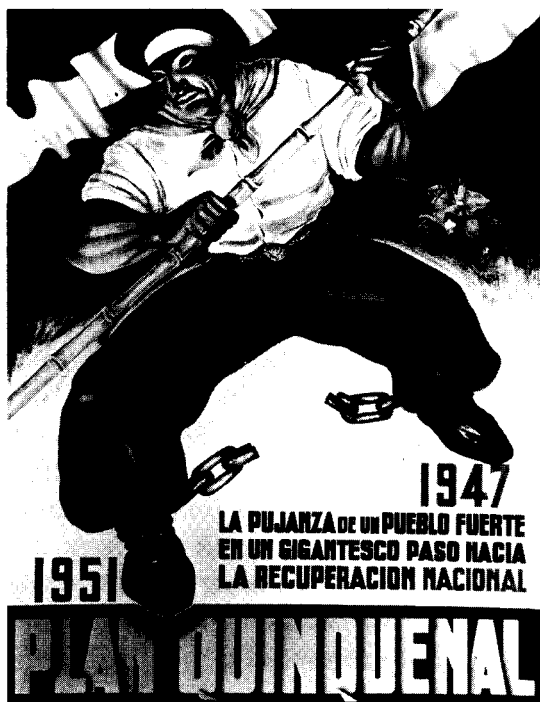
Propaganda oficial sobre el Primer Plan Quinquenal.

Nadie rechaza una invitación así, y Perón no lo hizo. El liderazgo fue del consumo popular, y el instrumento para impulsarlo fue el aumento de los salarios nominales, que a partir de 1944 ya se venía gestando, aunque todavía con poca fuerza, desde la Secretaría de Trabajo y Previsión. Sin embargo, algo falló inicialmente. Como lo diría el propio Perón más tarde para describir circunstancias muy diferentes, los salarios iban por la escalera y los precios por el ascensor. Que los precios que viajaban por el ascensor fueran en buena medida los de los productos primarios que la Argentina exportaba, era una bendición para el país. Pero, desafortunadamente, esos productos constituían a la vez los insumos para elaborar aquellos bienes que componían el núcleo de la canasta familiar, de modo que los intentos oficiales por aumentar el poder de compra de los trabajadores se esterilizaban. Hasta que Perón llegó a la presidencia en junio de 1946, los salarios todavía no habían aumentado en términos reales.