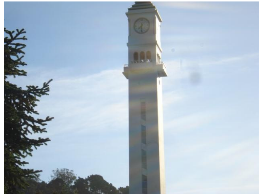
Campanil U. Concepción