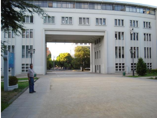
Arco Facultad Medicina U. Concepción