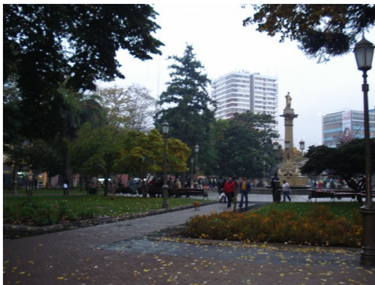
Plaza de Armas Concepción