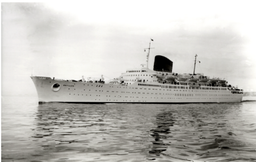
Antilles en Mer

1953 : Paquebot S.S. « ANTILLES » , Compagnie Générale Transatlantique Editée par la Monnaie de Paris (à vérifier). Diamètre 55 mm.