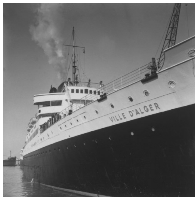
Ville d'Alger à quai

Raymond Delamarre avait sollicité de se voir confier la médaille du Paquebot « NORMANDIE », mais ayant bénéficié déjà d'une importante commande, celle du bas-relief doré de 6 m de haut pour la Salle à manger des 1ères classes (voir ci-après, en 1937 et 1966, les réductions de ce bas-relief), la Cie a préféré donner cette médaille à VERNON (qui d'ailleurs a réalisé à cette occasion l'une des plus belles et plus recherchées médailles de paquebot). A titre de consolation, la médaille du Paquebot « VILLE D'ALGER » lui a été confiée sans concours. Un agrandissement du médaillon de l'avvers, de 600 mm de diamètre, était exposé dans le salon du fumoir des 1ères classes.