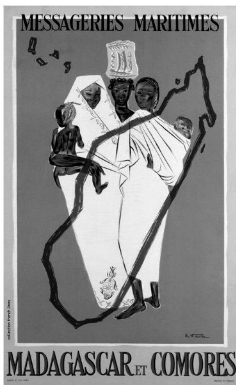
Messageries Maritimes, Madagascar et Comores par Elix Faure