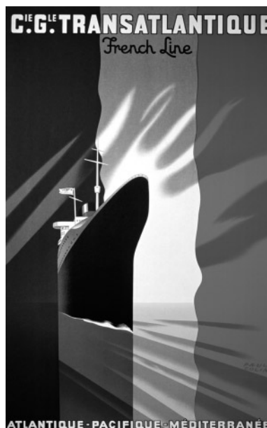
Normandie fond drapeau tricolore par Paul Colin