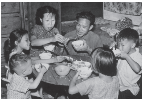
從前的家庭常有多名子女

即使願意生兒育女的夫婦，也寧願組織「小家庭」，一個家庭只有一名小孩的情況非常普遍，跟數十年前的小孩「有幾個兄弟姊妹」有很大的分別；有些夫婦則因為嚮往自由、工作繁忙、或經濟不景氣等原因，而決定不生育，令香港的出生率持續下降。