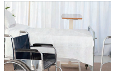
家居意外或會嚴重影響長者日後的生活質素

「跌倒」對長者來說並非小事，較嚴重的可能令長者的健康狀況和生活質素急劇轉壞。不少長者可能只因摔了一跤，從此便需要倚賴輪椅代步，無法自理日常生活，甚或要入住護理安老院舍，告別習慣多年的家居生活，究其原因，是現時大部份樓宇設計和室內設施，都未能配合長者的身體狀況需要。