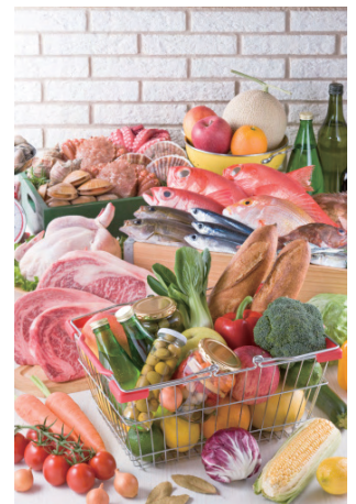
充足的食物，令香港人的壽命愈來愈長