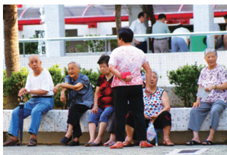
香港的長者數目將會愈來愈多

香港人口不斷老化已成趨勢，根據政府推算，65 歲及以上人口的比例將由 2010 年的 13%，顯著上升至 2039 年的 28%，屆時每 4 個人中就有一位是 65 歲以上的長者。由此可見，長者的數目將會愈來愈多，人口老化的問題亦為社會帶來了各方面的挑戰。