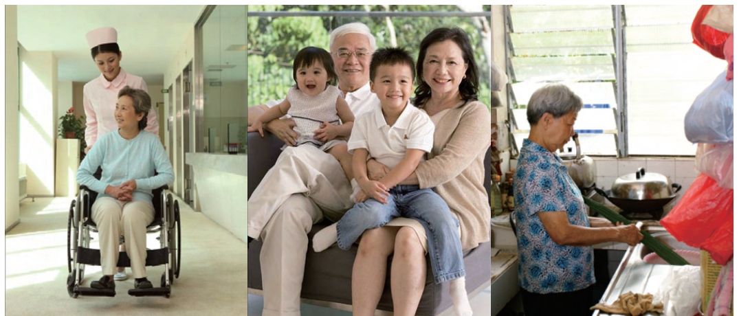
不同的長者對住屋有不同的需求

不同的長者，其經濟、家庭和健康狀況其實有很大的差異，所以他們面對的住屋問題也有分別。簡單來說，長者之中有和家人同住的、有獨居的；有身體健壯的、有病患纏身的；有衣食無憂的、也有靠綜緩過活的。基於各人的不同背景和經濟情況，故衍生出不同類型的長者房屋需要。