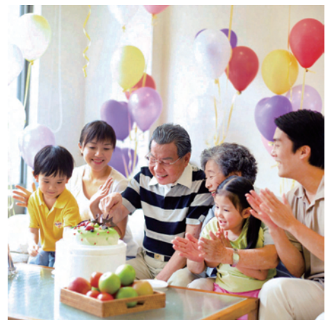
中國人傳統的家庭樂，能助長者保持心境開朗，有利身心健康