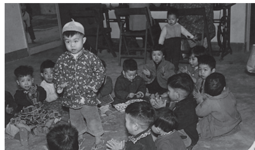
四、五十年代出生的嬰孩，已步入松柏之齡

四十年代中後期，大量難民從內地湧入香港，人口於數年內激增（可參考本教材套第一冊《居住的需要》內第一部份「香港房屋發展的歷程——四十年代中後期」）。他們在香港落地生根，生兒育女，帶來了「嬰兒潮」。踏入千禧年，這批二戰後出生的人開始陸續步入退休年齡，65歲以上人口將由目前約90萬急劇增加，至2039年將達250萬人。