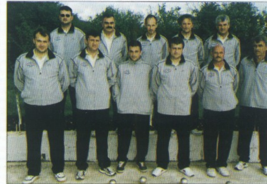
BK Imotska krajina Glavina Donja