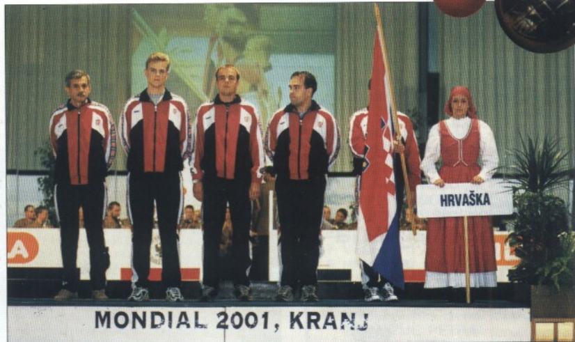
Na Svjetskom prvenstvu u Kranju 2001. Hrvatska je osvojila tri odličja