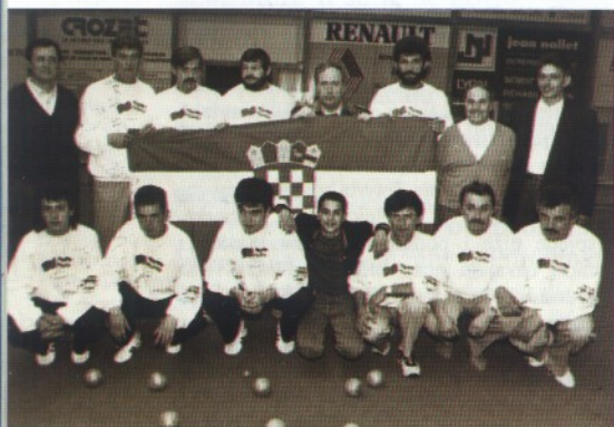
BK Nada - Kup prvaka, Lion 1992.