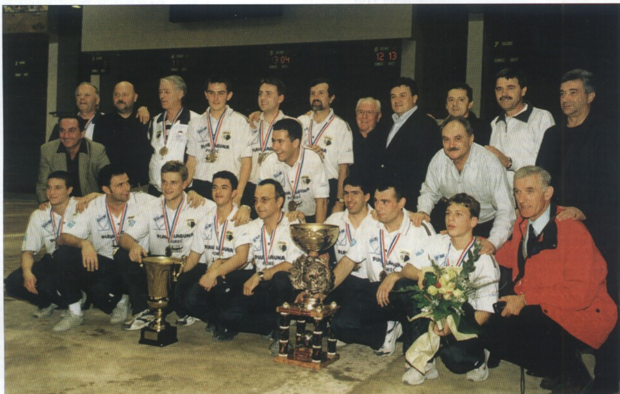
Zasluzni momčadski prvaci države za 2002. godinu, igrači i rukovodstvo BK »Istra Poreč« iz Poreča

SVJETSKO PRVENSTVO, seniori par – pojedinačno – krug – 3 izbijanja