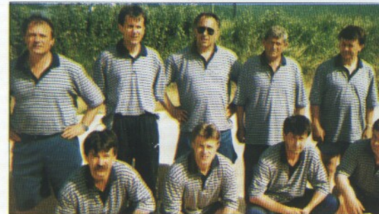
BK Trilj, Trilj

Tijekom naredne dvije godine u okviru mogućnosti i datih okolnosti Komiža postiže iznimne uspjehe kako u organizacijskom tako i u natjecateljskom smislu. Iako igrački oslabljen u odnosu na prethodne sezone klub 2001. i 2002. osvaja četvrta mjesta u prvenstvu i sudjeluje u završnici Kupa Hrvatske. Uspjehe niže i podmladak kluba. Kedeti i juniori osvajaju niz odličja na Prvenstvima Hrvatske. Organizacijske kvalitete klub