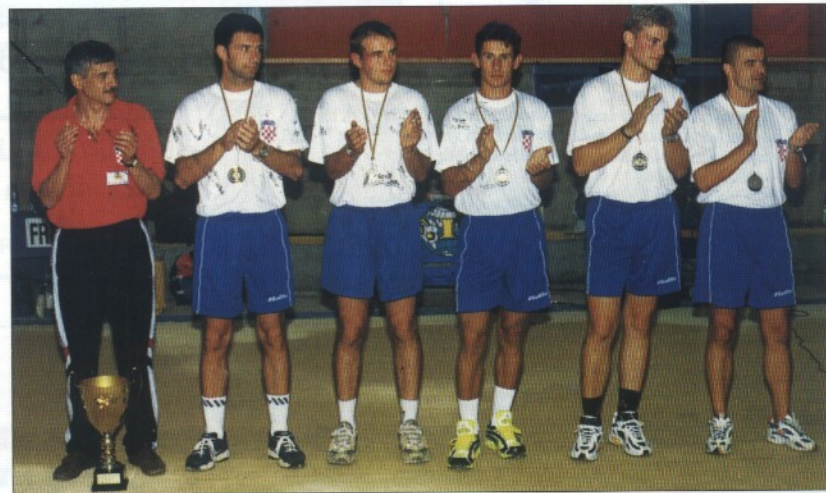
Četverboj nacija, Komiža 9. i 10. rujna 2000.

• Imaju li i bočari sukladno iskustvima iz drugih sportova bazu za pripreme reprezentacije. Koliko je na pripremama bočara važan element zajedništva, kolektivnosti?