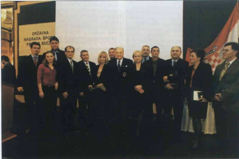
Ovogodišnji dobitnici nagrade »Franjo Bučar«