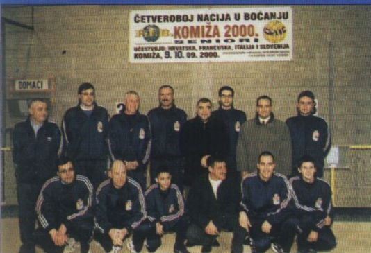
Igrači i vodstvo kluba s predsjednikom Republike Hrvatske Stjepanom Mesićem, počasnim članom BK Komiza

Nikako ne možemo zaobići činjenicu kako su upravo igrači ovog kluba - Mladineo i Kordić - vlasnici državnog rekorda za kade- te u štetnom izbijanju sa 37 as pogodaka te Mladineo juniorski rekorder Hrvatske u pre- ciznom izbijanju sa 31 pogotkom.