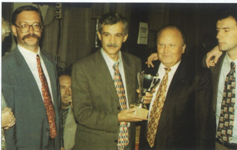
Svjetsko prvenstvo 1997. u Rijeci

• S ovakvim uvidom u boćanje i poznavanjem boćarske problematike zasigurno je najkompetentnija