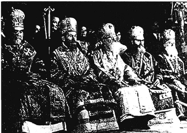
Сербский патриарх Герман в окружении македонских архиереев – архиепископа Досифея и митрополитов Климента, Мефодия и Наума

православной поместной церковью. Перед этим на Втором церковно-народном соборе в Охриде (1958) была возобновлена Святотриентовская Охридская архиепископия в качестве Македонской православной церкви. САС СПЦ признала самостоятельность Македонской православной церкви и согласилась с решениями Второго церковно-народного собора в Охриде 7 .