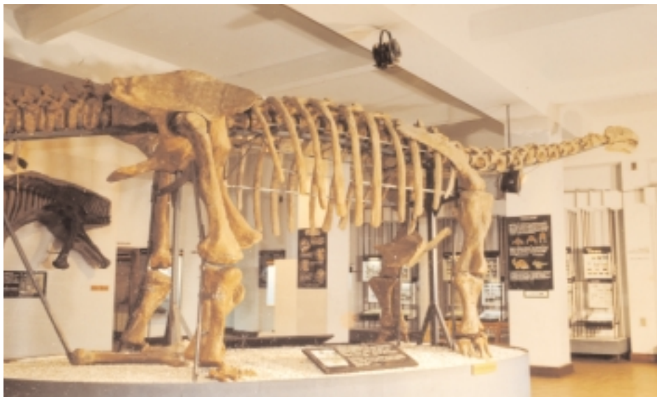
Ryc. 6. Sala w Muzeum Ewolucji Instytutu Paleobiologii PAN w Warszawie (Pałac Kultury i Nauki, wejście od ulicy Świętokrzyskiej). Na pierwszym planie widoczny szkielet wielkiego dinozaura roślinożernego – zauropoda, wydobyty podczas Polsko-Mongolskiej Wyprawy Paleontologicznej w Altan Uła w 1965.