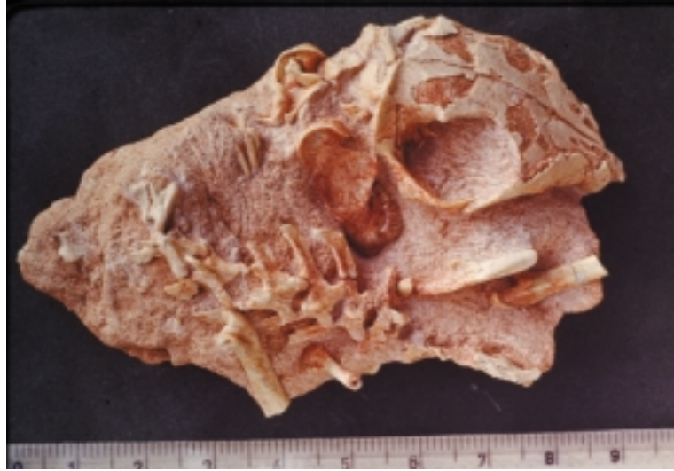
Ryc. 7. Szkielet ssaka mezozoicznego wieloguzkowca Nemegtbaatar z pustyni Gobi, tak jak został znaleziony, podczas Polsko-Mongolskiej Wyprawy na pustyni Gobi w 1971 roku. W prawym górnym rogu widoczna jest czaszka od strony grzbietowej, mierząca około 4,5 cm długości, w dolnej części zdjęcia część kręgosłupa i fragmenty kości długich.