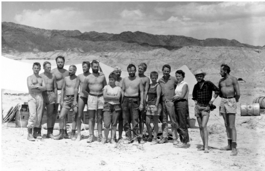
Ryc. 3. Polscy uczestnicy Polsko-Mongolskiej Wyprawy Paleontologicznej z 1965 roku w obozie w Altan Uła. Trzecia od prawej autorka artykułu.