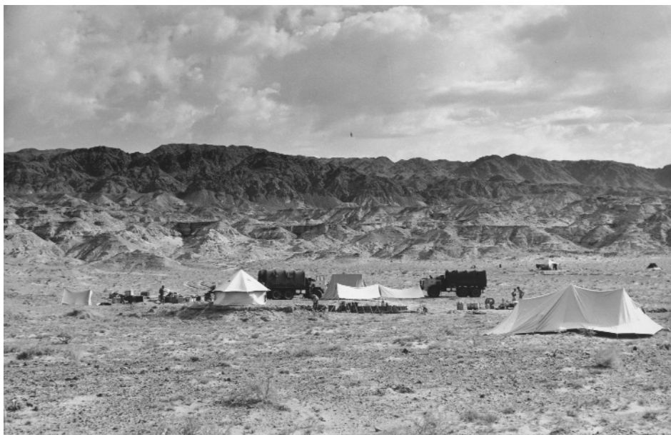
Ryc. 2. Obóz Polsko-Mongolskiej Wyprawy Paleontologicznej w 1965 roku, w Altan Uła, w Dolinie Nemegtańskiej na pustyni Gobi.