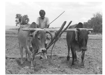
चित्र 8: खेस खल, मुक्कर रोआ इदआलनर, चित्र 9: गोहला उयलदस