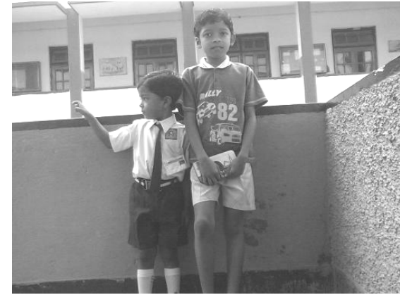
चित्र 3: लूरकुड़िया खदर

नू 14.1 दयदोय पांति, नातोर नू 11.6 दयदोय पांति, चापई नोवाबगंज नू 11.3 दयदोय पांति , नोआगांव नू 7.7 दयदोय पांति, राजसाही नू 5.6 दयदोय पांति, बोगरा नू 6.2 दयदोय पांति अरा पंचागर नू 5.2 दयदोय पांति आलार बच्चका रअँनर।