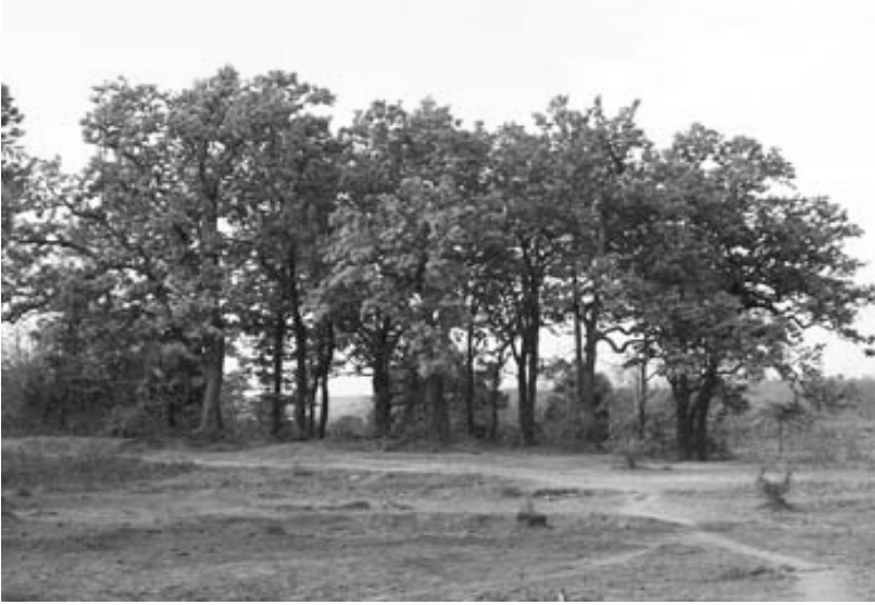
चित्र 5: सरना बखइर, कुँडुखर गही निमन अड्डा, एकदा चाला पच्चो गही एडपा तली।

उज्जना नू रासी मना खतरी मनी। कुँडुखर जादु-टोना गुट्ठी नू हूँ पईतआनर। ईर गही उर्मी परब, बेंजा-काजी गुट्ठी साहे बेसेम मनी। एकासे का, बसुन्धरा बैसाख चन्दो नू, भदरी भदो चन्दो नू, जेजुठी अगहन चन्दो नू, इटु फग्गु नू अरा सरहुल चैत चन्दो नू एकदा कुँडुखरिन खेती-बारी तरा जोड़्डी।