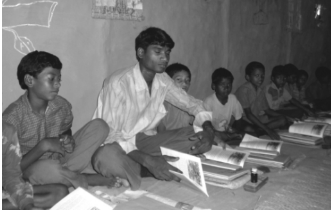
चित्र 4: खदर बचनाकोठरी नू रअँर

अन्नु हूँ, चान अक्टुबर 2002 नू, युनेस्को गही संघरा ती कुँडुख आदिबासिर गही जुक्की टुड़ना-बचना गही रेटन् पर्दआ खतरी टुड़ना-बचना रोजोट ओरे मंजा। इदि गही घोक् का, कुँडुखर मजही