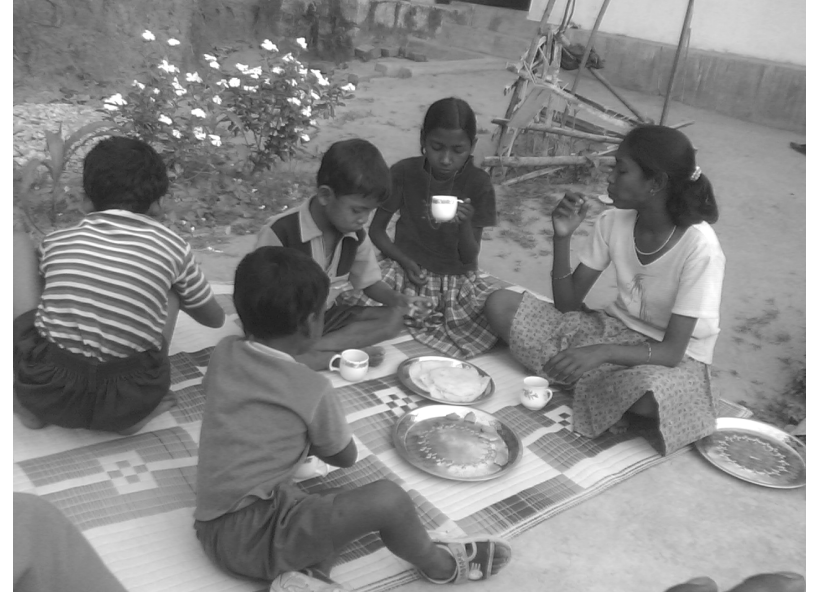
चित्र 1: कुँडुख खदर, लण्डी लोहाड़ी ओनर खुशमारआलनर।