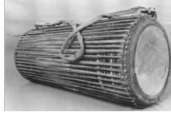
चित्र 6: खेल (इबड़ा एंडो बजा पकम चलन नू रओी)