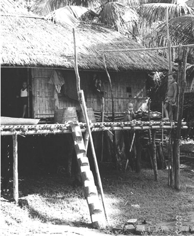
चित्र 2: बंगलादेश ता मरमा आदिबासिर गही एडपा

बंगला देश नू एनदोय नय(उन्तीस) गोटेग जुक्की रअु आदिबासिर रअँनर। आ मदका नू चकमा, मरमा, त्रिपुरा, संथाल, गारो, मनिपूरी, तांचागया, हाजोग, माघ, राखाईन, मरू/मरो, लुसे, उराँव, मुण्डा, मुरोंगम, खासिया, पांखो, बावम, बेदी, बागदी, खुमी, राजबांगसी, चाक, खायंग अरा पहाड़ियार गुट्ठी मन्नर। बंगलादेश नू जमा दोय सोडिम(दश हजार) अंडसा अंडसी मन्नर, इदातो बंगला देश ता जमा आलार गही ओन्द प्रतिशत आदिबासिर मन्नर। बंगला देश गही दोय नय दयदोय अखदोय(उन्तीस सौ अस्सी) ता मर्दुमसुमारी गही तेंगना लेखे आदिबासिर गही गिनती धरम जोक्खा नू हिन्दुर एनदोय नाख(24), बुद्धिस्ठिर नाखदोय नाख(44), खिस्तानर दोय मूँइ अरा नंना आलार दोय नय दयदोय पांति रअँनर। बग्गे आदिबासिर(778,425) परता अरा पद्दा खेप्पा नू उज्जनर बिज्जनर दरा गोटे बेलखाप नू बीड़िकर रअँनर। आदिबासी समाज ता आलार मजही अनइत किसिग गही उज्जना बिज्जना, भाखा अरा चिन्हा गुट्ठी एःरना नू बरअी। आर गही खोंडहा उज्जना, बेंजा-काजी, कुन्दुरना अरा खेअँना गही नेगजोग, अत्तना पुन्दुरना अरा ओन्ना मोंखना, उर्मीदिमअ बेलखाप ता नंना आलार ती तरकुटिम एथेरअी। आर किसिम किसिम गही भखा कच्छनखरनर, जोक आदिबासिर गही तंगआ भखा रअी अरा जोक्कर गही तंगआ भखा गही टूढ़ना चिन्हा हूँ रअी। बंगला देश ता बग्गे कछनखरअु भाखा परिवारन् मूँद खंद नू खट्टर एःरा गे ओंगदत्।