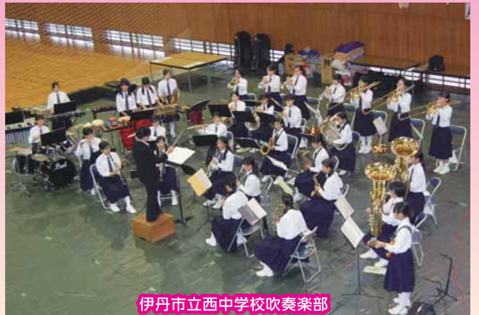
伊丹市立西中学校吹奏楽部