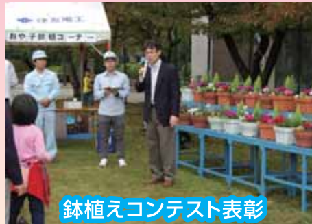
鉢植えコンテスト表彰