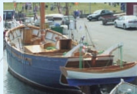
Hoppet av Brantevik