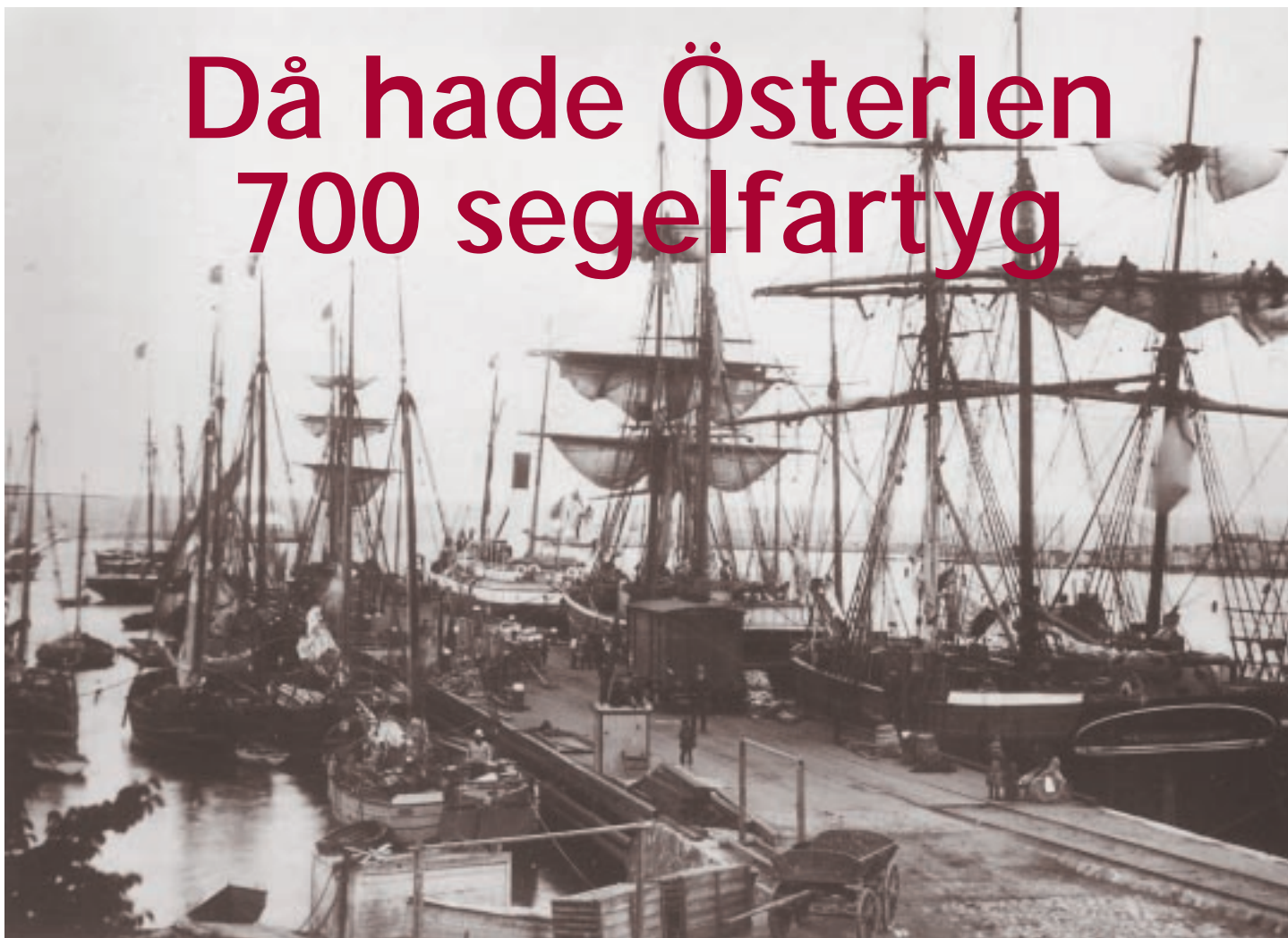
Storebro, den nuvarande Bornholmskajen i Simrishamn, var lastnings- och lossningskaj för de stora skutorna. Vid den andra sidan var det grundare, där landade fiskarna sina fångster.

Österlen har en enastående historia av framåtanda, spänning och blomstrande välstånd. Så sent som för hundra år sedan stod segelsjöfarten på sin höjdpunkt.