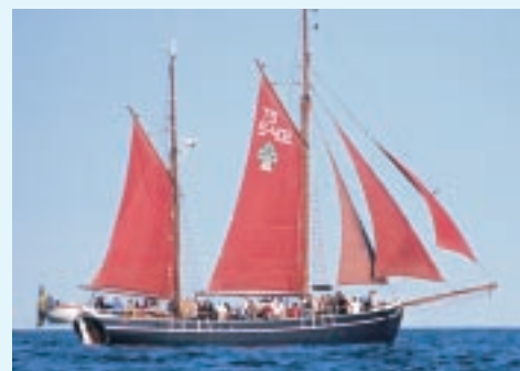
Sarpen – Simrishamn