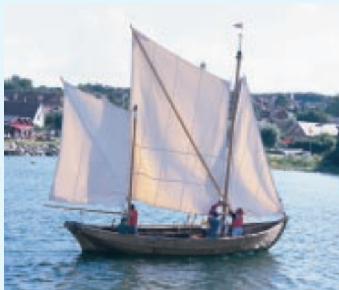
Vrakekan – Kivik