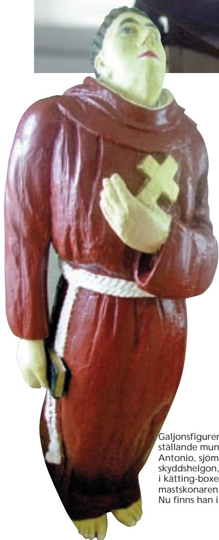
Galjonsfiguren föreställande munken San Antonio, sjömännens skyddshelgon, återfanns i kätting-boxen på tremastskonaren Elisabeth. Nu finns han i Skillinge.

Sjöfartsmuseerna i Brantevik och Skillinge, Österlens Museum och Konstmuseet Gösta Werner & Havet i Simrishamn är givna besöksmål för den marint intresserade.