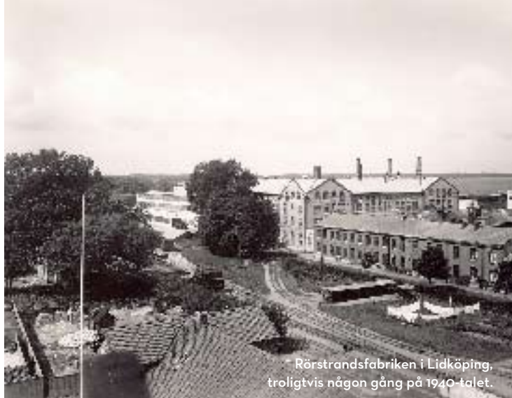
Rörstrandsfabriken i Lidköping, troligtvis någon gång på 1940-talet.