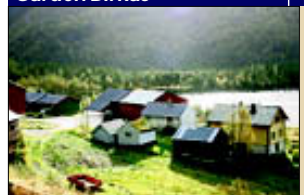
SLEKTSGARDEN: Det har budd folk på Birkås sidan 1600-talet. For få år sidan selde dei gettemjølkkvoten for å investere i eiga vasskraft.