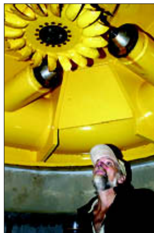
TØRT: Det har knapt rent vatn mot skovlone på denne turbinen.