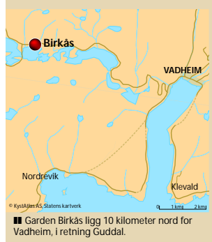
■ Garden Birkås ligg 10 kilometer nord for Vadheim, i retning Guddal.

beidet. Begge delar er til å leve med, for no ser han enden på marerittet. I april neste år installerer Småkraft ny turbin, generator og kontrollanlegg, og då skal det endeleg bli produsert kraft frå Sagelva.