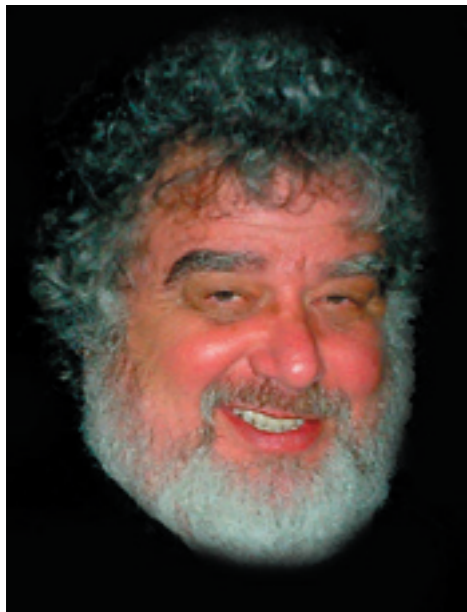
Chuck Blazer, Chairman Organising Committee for the FIFA Confederations Cup

At the start of the FIFA Confederations Cup France 2003, eight teams kicked off the tournament with pride in their hearts and the goal in their sights, knowing that only one team could leave holding aloft the crown of FIFA's intercontinental championship.