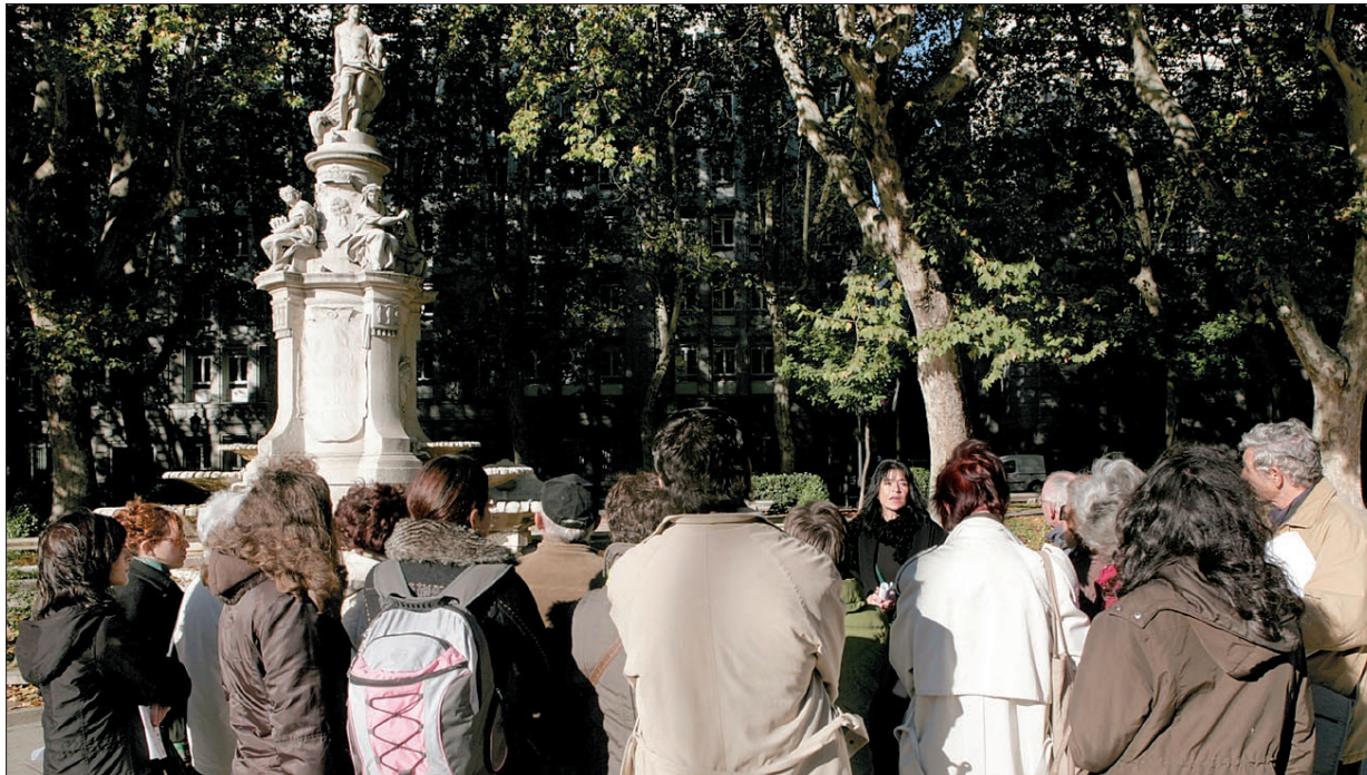
El grupo Acis de investigación en mitocrítica organizó visitas guiadas dentro de la Semana de la Ciencia para conocer la historia mitológica de los conjuntos escultóricos que se encuentran instalados en el paseo del Prado.

Este grupo de trabajo tiene en marcha un proyecto de