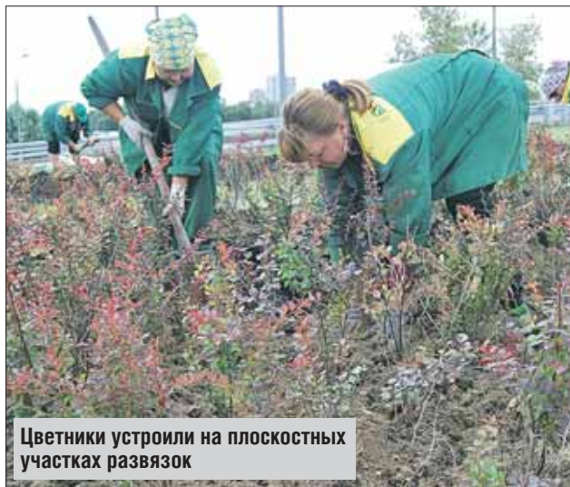
Цветники устроили на плоскостных участках развязок

Особенность нынешней концепции в том, что цветники устроены на плоскостных участках. Озеленители высадили барбарис и спирею, многолетние лилейники разных оттенков. По словам Олега Кусова, ранее, когда цветники разбивали на откосах, вода при поливе стекала вниз, верхние ряды цветов быстро