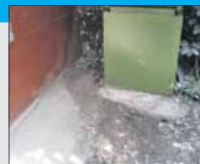
Мусор со двора в Старослободском переулке убрали в течение суток

Меры приняли в течение одного рабочего дня после размещения жалобы на портале. Управа района Сокольники сообщила, что под-