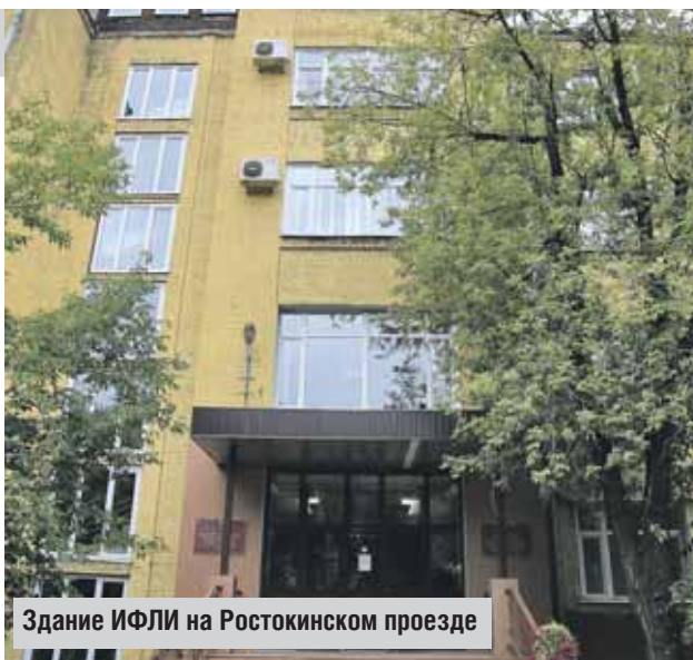
Здание ИФЛИ на Ростокинском проезде

На табличке с названием трамвайной остановки на Ростокинском проезде, у моста через железную дорогу, когда-то было одно слово: «Институт». Сейчас она гласит: «Институт иностранных языков», а 80 лет назад кондуктор объявлял: «ИФЛИ» — и с подножки прыгивали студенты, многим из которых было суждено оставить след в истории и в культуре нашей страны. Твардовский и Симонов, Матусовский и Наровчатов, Коган и Гудзенко, Левитанский и Самойлов — это поэты, учившиеся в Институте философии, литературы и истории.