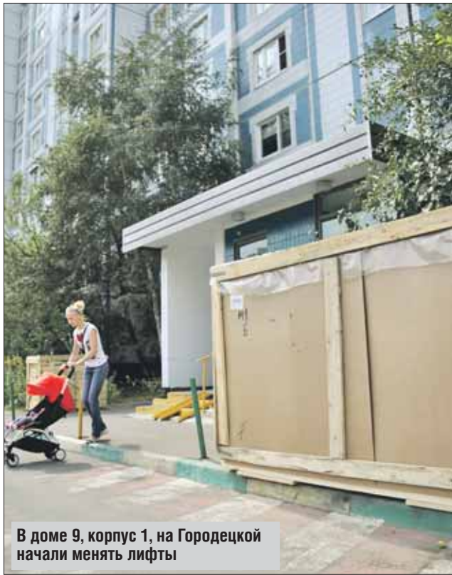
В доме 9, корпус 1, на Городецкой начали менять лифты

Ремонтники не только ставят новые кабины, но и меняют всю начинку: оборудование в шахте, тросы, электронику, системы управления движением и обеспечения безопасности. На лестничной клетке устанавливают новую лифтовую дверь, рядом новая — антивандальная — кнопка.