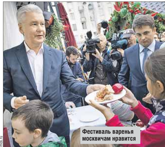
Фестиваль варенья москвичам нравится

— Фестиваль варенья пользуется большой популярностью у москвичей и гостей столицы. Площадки фестиваля посетили уже 3,5 миллиона человек, — отметил Сергей Собянин.