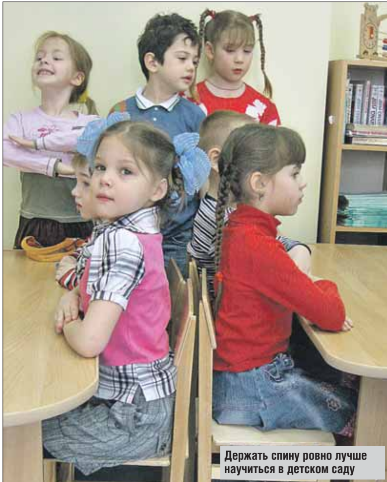
Держать спину ровно лучше научиться в детском саду

И взрослым и детям стоит равномерно распределять нагрузку на обе стороны тела. Большинство женщин, например, носят сумки всегда на одном плече, и нередко