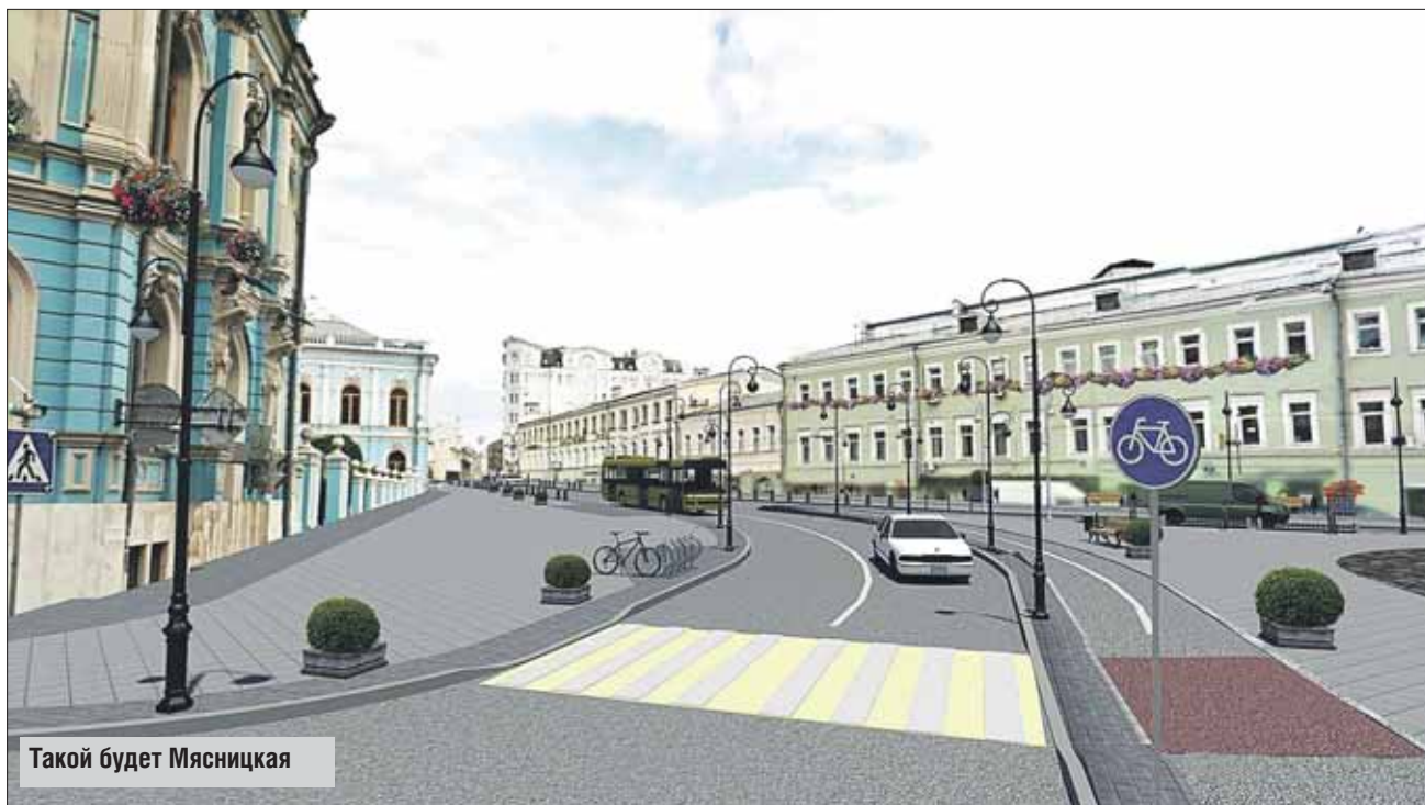
Такой будет Мясницкая

Как сообщают столичные власти, в центре города приведут в порядок