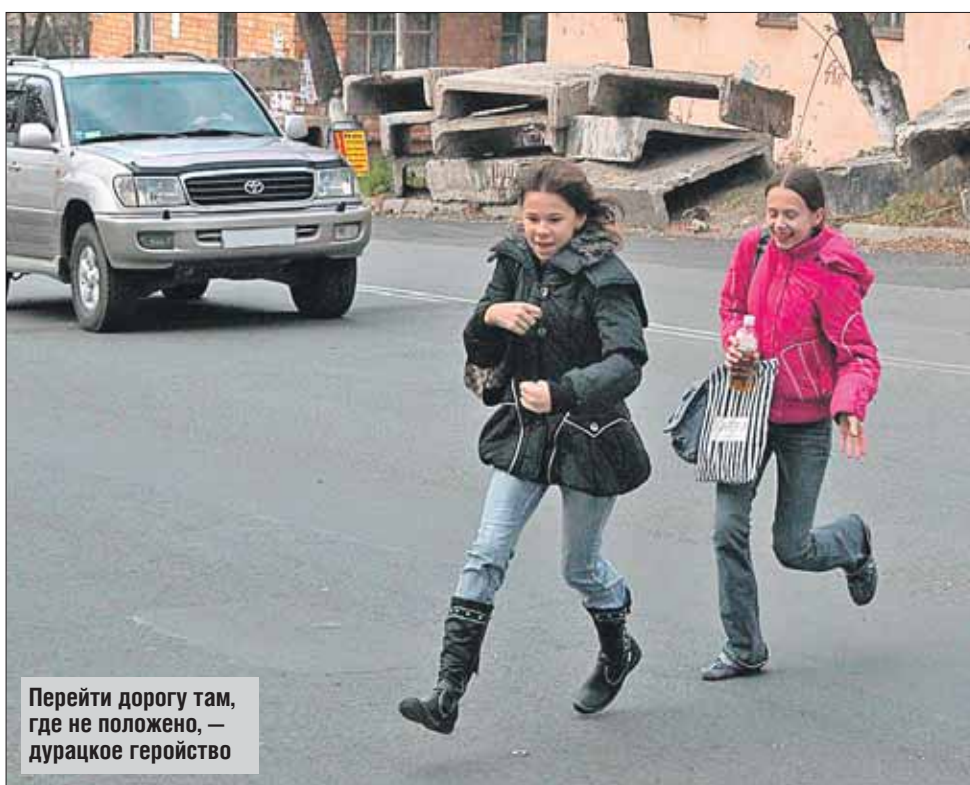
Перейти дорогу там, где не положено, — дурацкое геройство

В ГИБДД отмечают: в последнее время пешеходы, привыкнув, что их обязаны пропустить на «зебре», иногда почти не обращают внимания на приближающиеся маши-