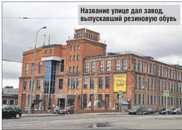
Название улице дал завод, выпускавший резиновую обувь

Свое название улица «юбилярша» получила от завода «Красный богатырь» (ул. Краснобогатырская, 2), основанного ещё в 1887 году и выпускавшего в основном резиновую обувь: галоши, сапоги, боты и т.д. Вначале это было Московское товарищество резиновой мануфактуры в селе Богородском, с 1910 года — акционерное общество «Богатырь», а