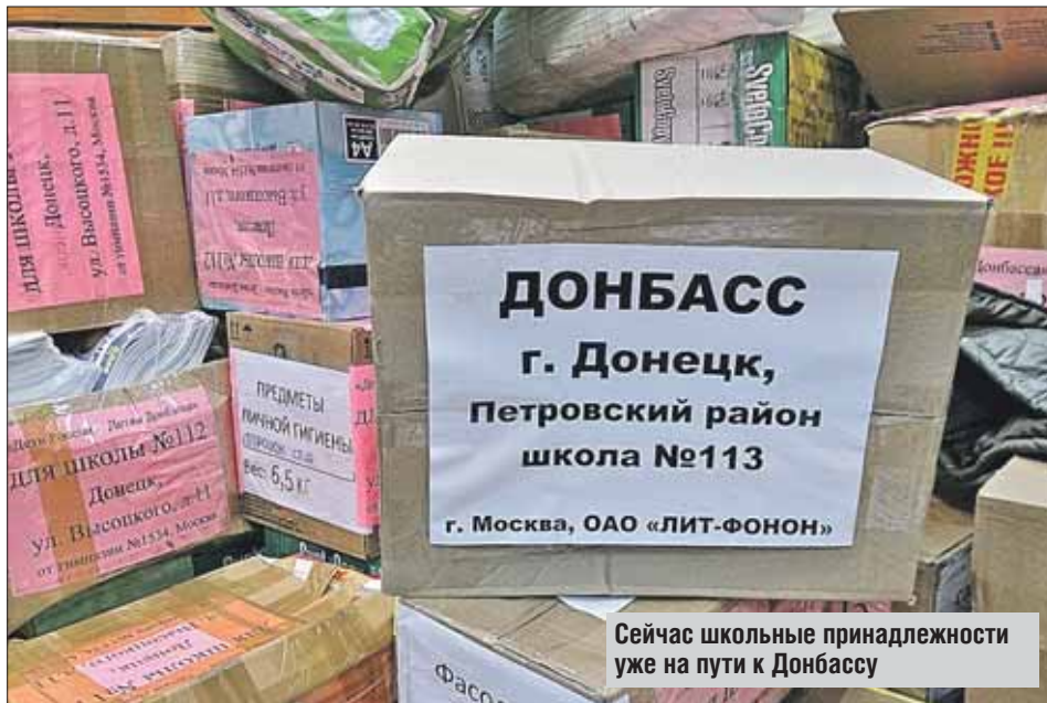
Сейчас школьные принадлежности уже на пути к Донбассу

— Летом начали с оказания адресной помощи одной конкретной школе №113 Петровского района Донецка. Когда сотрудников предприятия попросили принести какие-то школьные принадлежности для детишек, люди стали приносить новую школьную форму, спортивные костюмы, рюкза-