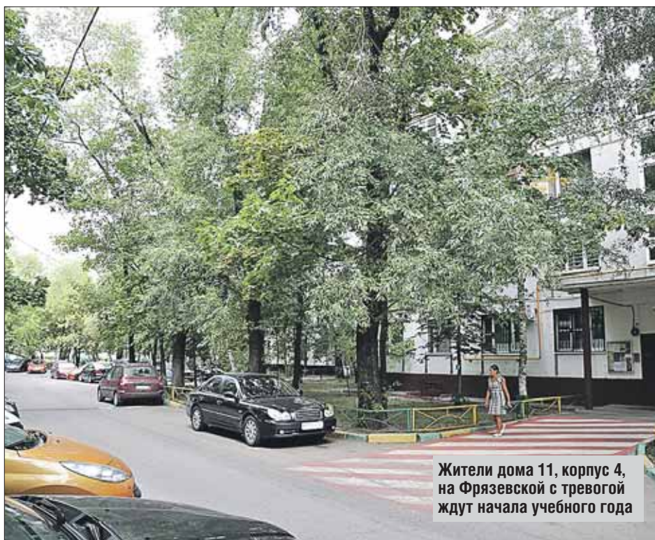
Жители дома 11, корпус 4, на Фрязевской с тревогой ждут начала учебного года

— Жителям в этой ситуации можно попробо-