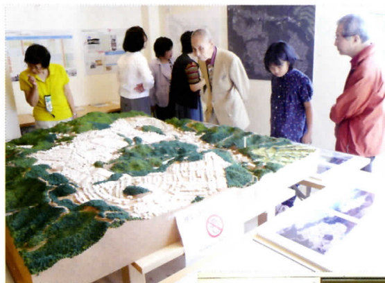
▲ ジオラマ展示の様子