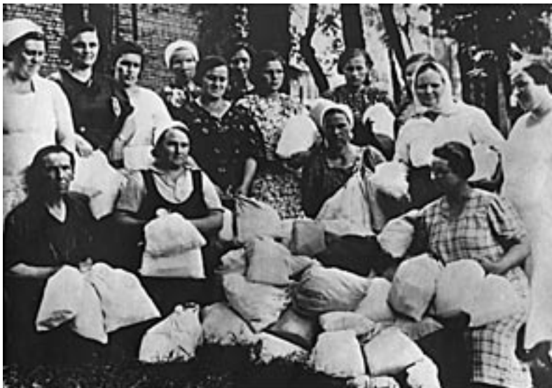
Робітниці Дніпровського металургійного заводу ім. Ф.Е. Дзержинського з подарунками для фронтівиків. Серпень, 1941 р. ММК. №01185.