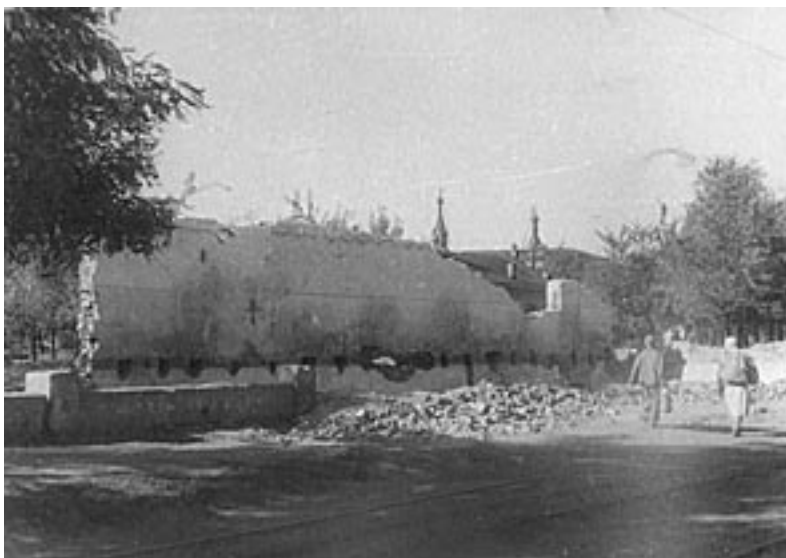
Зруйнований магазин «Дитячий світ». 1944 р. ДАДО. Ф.1278, оп.1, спр.338. Фотоальбом.