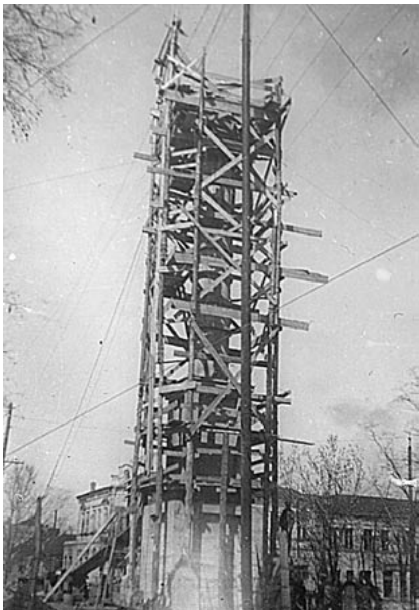
Відбудова пам'ятника «Прометей». 1944 р.