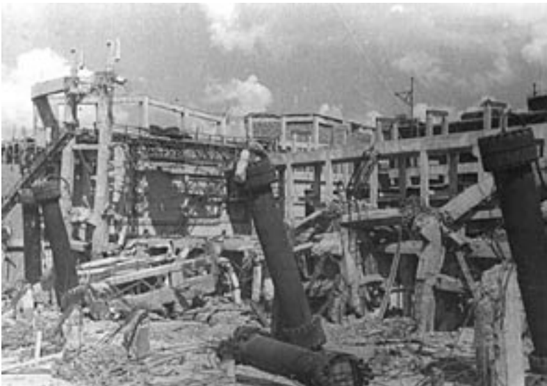
Руїни цеху №1 Дніпродзержинського азотно-тукового заводу. 1944 р. ДАДО. Ф.1278, оп.1, спр.338. Фотоальбом.