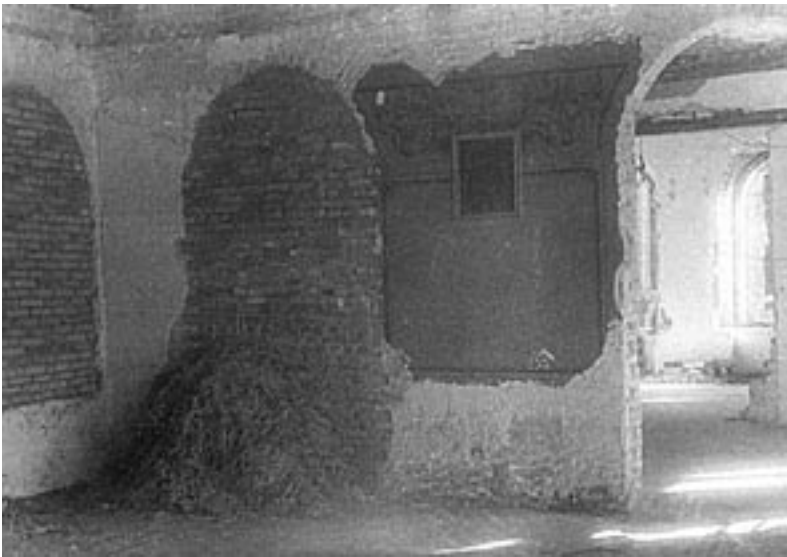
Палац піонерів, перетворений окупантами на стайню. 1944 р.