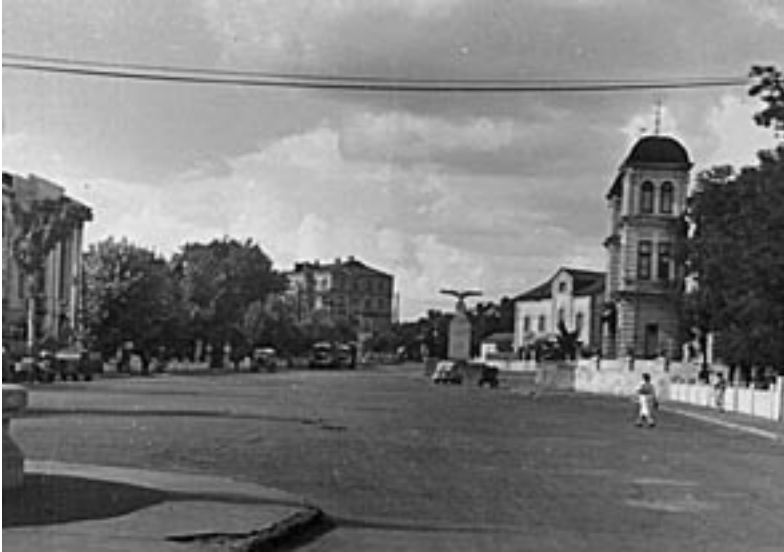
Площа Адольфа Гітлера у місті Кам'янському. 1942 р.