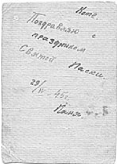
Те саме, зворот.