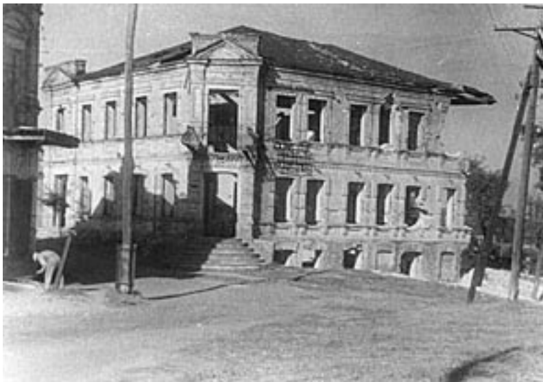
Міський головпоштамт. 1944 р. ДАДО. Ф.1278, оп.1, спр.338. Фотоальбом.