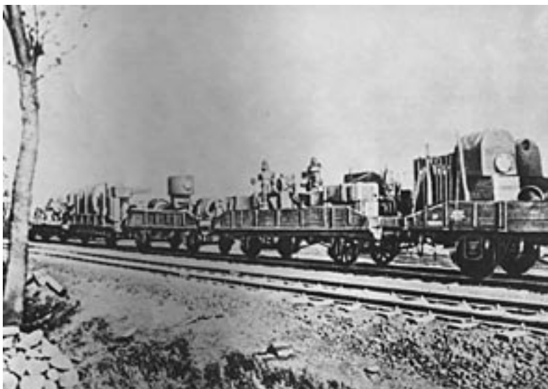
Евакуація устаткування з Дніпровського металургійного заводу ім.Ф.Е.Дзержинського. Серпень 1941 р. ММК. №02413.