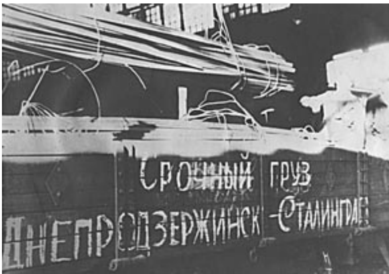
Терміновий вантаж - прокат Дніпровського металургійного заводу ім.Ф.Е.Дзержинського на відбудову Сталінграда. 1944 р. ММК. №00784 .