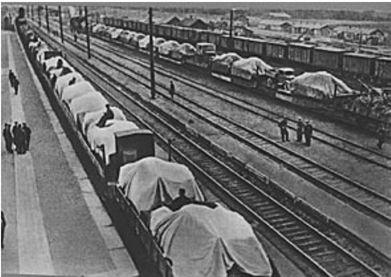
Все для фронту. 1941 р. ММК. №02412.