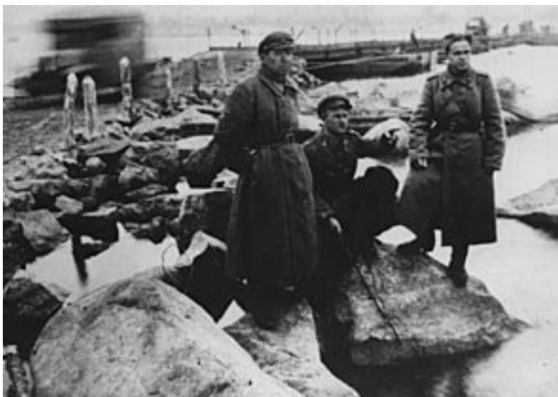
На Аульсько-Сошиновській переправі. Жовтень, 1943 р. ММК. №01179.