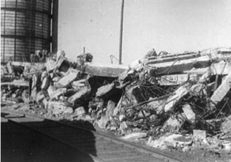
На території Дніпродзержинського коксохімічного заводу. 1944 р. ДАДО. Ф.1278, оп.1, спр.338. Фотоальбом.