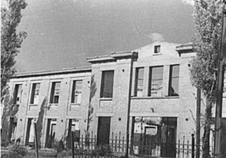
Міська лікарня. 1944 р.