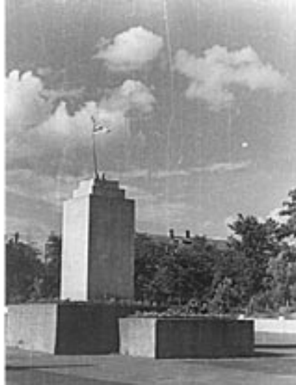
П'єдестал пам'ятника В.І.Леніну після визволення міста від окупантів. 1944 р. ДАДО. Ф.1278, оп.1, спр.338. Фотоальбом.