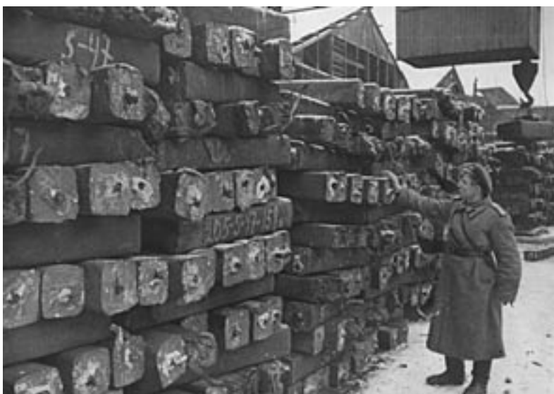
Представник Наркомату оборони приймає продукцію Дніпровського металургійного заводу ім.Ф.Е.Дзержинського. 1944 р. ММК.