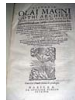
Pohjoisten kansojen historia vuodelta 1576 herättää kunnioitusta.

Toisinaan tällaisesta numeroidusta korupainoksesta saatetaan vielä kuitenkin tehdä myös ns. ”karvalakkipainos”, kuten on tehty Elias Lönnrotin Flora Fennicasta .