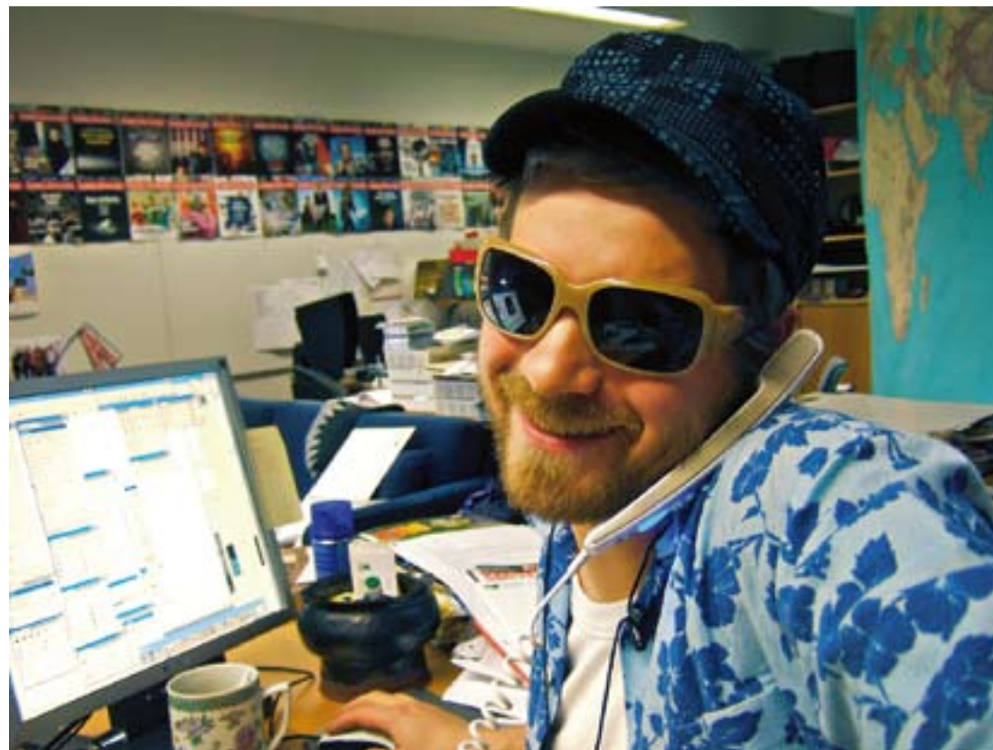
Kesägraafikko työnsä ääressä. (Lavastettu tilanne.)

Kerrotaan nyt vielä, ettei jää epäselväksi – eikä vain siksi että on olemassa mahdollisuus että joku asianosainen lukee tämän – että viihdyin / viihdyn / olen viihtynyt vähintäänkin mainiosti. Hyvässä porukassa laadukkaana lehden tekeminen tuntuu puolustusvoimien mainoslau- setta mukailleen työltä, jolla on tar- koitus. Ainakin armeijasta vapautel- lulle toimi paremman puuteessa. ■