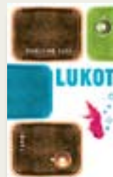
Pauliina Susi: Lukot . Tammi 2008.