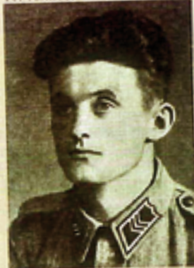
Erkki Oinonen jatkosodan puolivälissä.