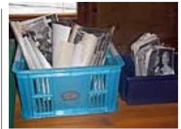
Kirjaidea voi kummuta vaikkapa Amanitan omasta kuva-arkistosta.

Kunnioittava hiljaisuus laskeutui kustannustoimittajien keskuuteen, kun arkistojen kätköistä löytyi lehteiltäväksemme Olaus Magusin Pohjoisten kansojen historia -teoksen latinankielinen laitos vuodelta 1576. Kävi ilmi, että Basellissa ja Roomassa painetuissa teoksissa on eri kuvat.