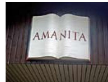
Amanita on erikoistunut historiallisiin teoksiin.