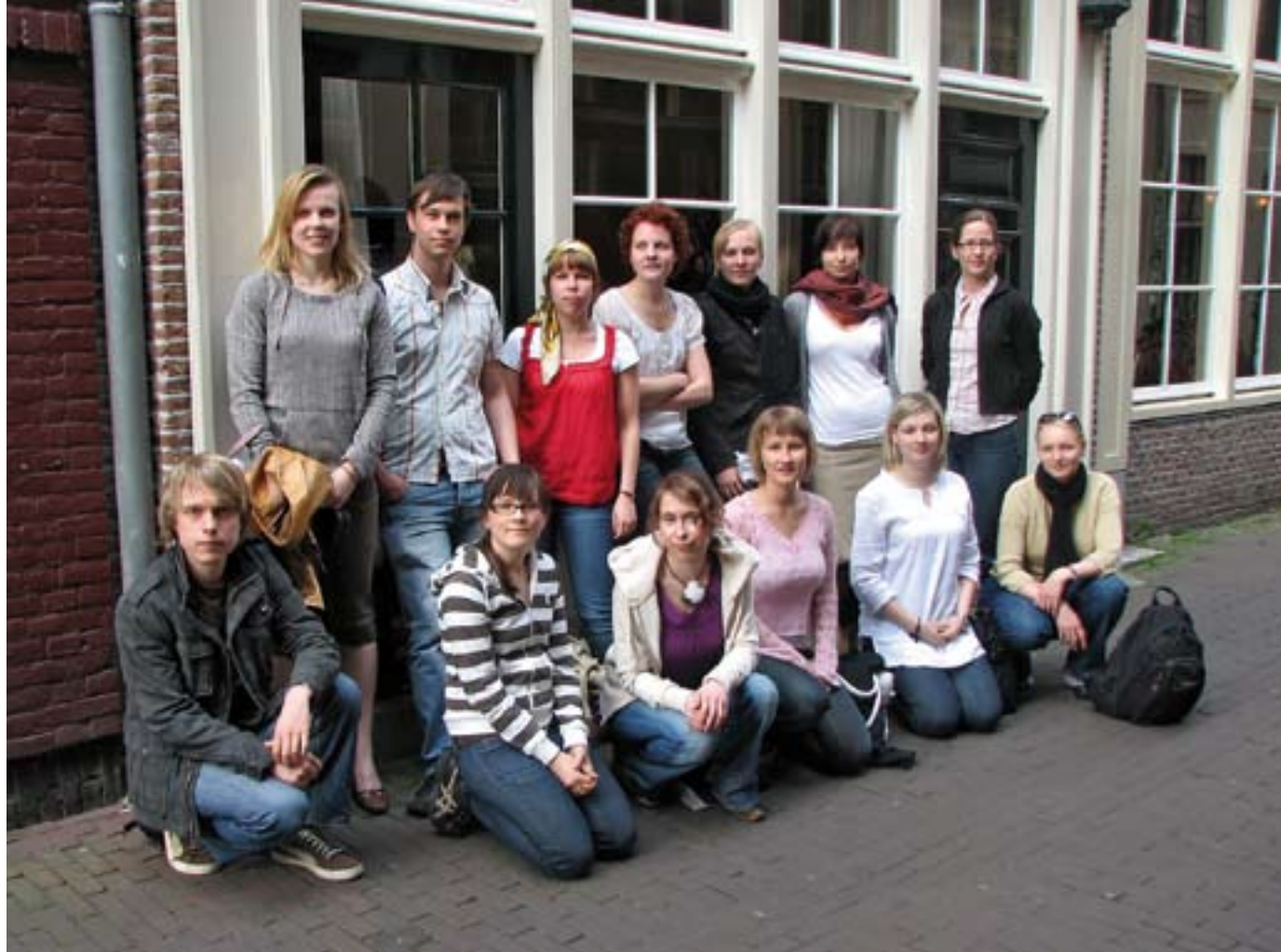
Aikakauslehtijournalismin sivuaineen uudet opiskelijat valitaan syyskuussa. Edellinen kurssi teki toukokuussa 2008 opintomatkan Amsterdamiin missä tutustuttiin Sanoma Uitgeversin ja ilse median toimintaan.

Ehkä aikakauslehtijournalismissa onkin kyse juuri siitä: tiettyjen asioiden esittämisestä oikeanlaisille yleisöille. Voisin kuvitella, että monet esityksistä olisivat olleet erilaisia jos kyseessä olisi ollut opiskelijajoukon sijasta esimerkiksi ryhmä potentiaalisia mainostajia. Nyt naisasian eturintamassa seisovat muutkin lehdet kuin Tulva . Laadukkaan journalismin jäljillä olivat myös muut kuin Raw .