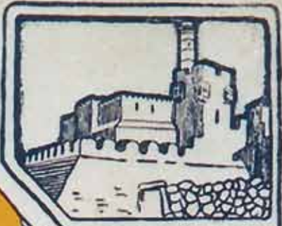
מגדל דוד TOWER OF DAVID