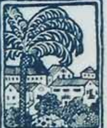
בש"ב BE'ER SHEVA