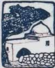
קבר רחל RACHEL'S TOMB