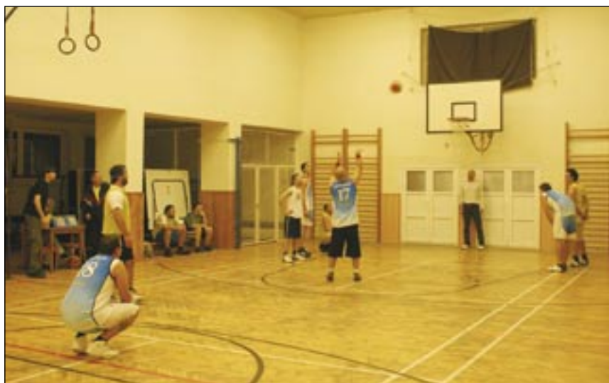
Basketbal v Řeznovicích (Foto k článku Ivančické tělocvičny na str. 51)