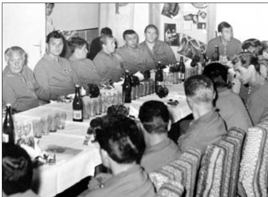
Ivančické závody zvaly olympioniky na exkurze spojené s malým pohoštěním.