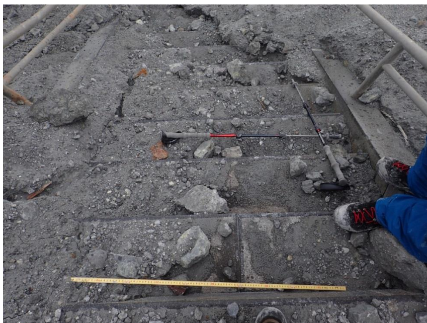
写真3 剣ヶ峰山頂奥社の参道石段に露出した噴石. 粘土質の火山灰に火山礫サイズ以上の噴石が多量に混じる。折れ尺の長さは1m. 細粒部が洗われ、粗粒部が目立つようになった。