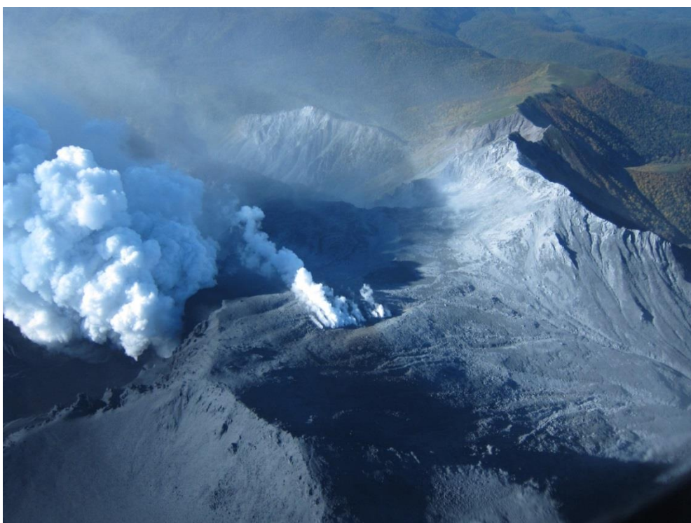
写真5 一番西側の火口列.