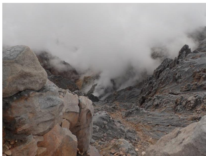
写真4 剣ヶ峰山頂からの地獄谷内の噴火口. 上: 2014年11月8日撮影 中: 2015年6月10日撮影 下: 2015年8月19日撮影 (上部の白色の部分のほとんどは雲)