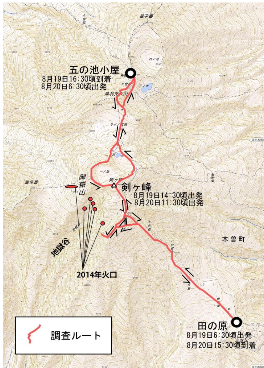
図1 調査ルート. 国土地理院電子国土基本図を使用.

頂上でも火山ガスの匂いはそれほど強くなく, 火口のもっとも近づいた一ノ池周辺でも, 携行したガス検知器による計測によれば, H_2S は最大で約7 ppm, SO_2 は検出限界以下 (1 ppm 以下) であった. これは, 前回6月の調査と同レベルの濃度である.