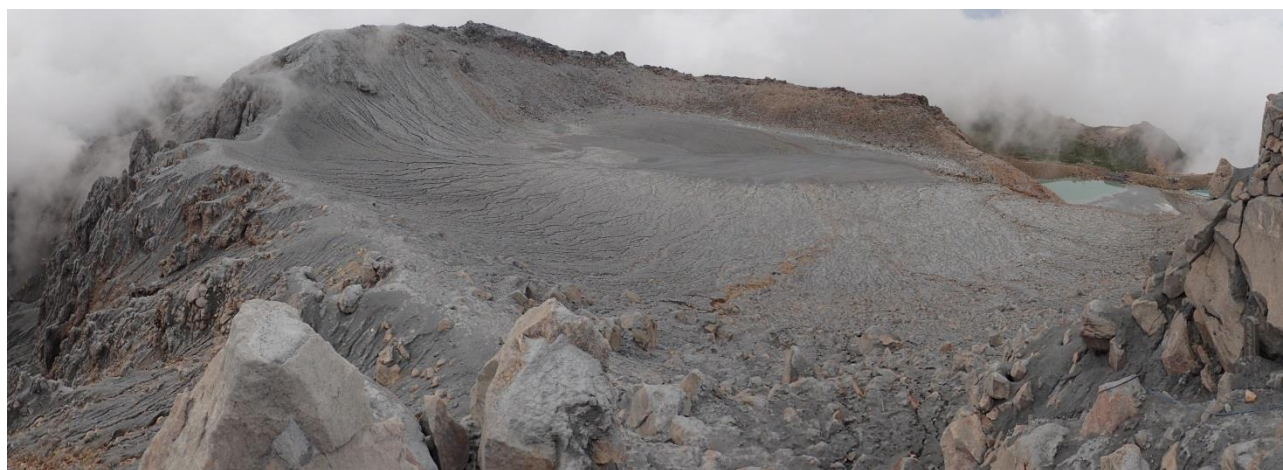
写真1 剣ヶ峰山頂から一ノ池を望む.