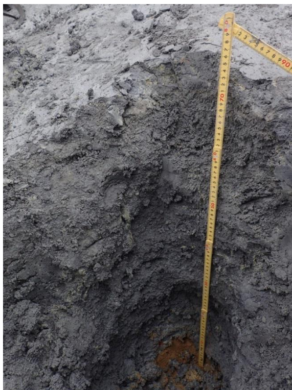
写真2 剣ヶ峰西側, 一ノ池南側の噴出物 (層厚 72 cm).