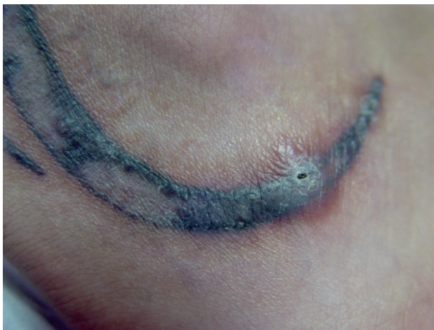
Figura 5. Absceso por P. aeruginosa . El estudio microbiológico demostró que el envase del pigmento estaba contaminado por este microorganismo.