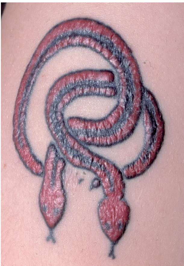
Figura 2. Reacción inflamatoria liquenoide por pigmento rojo.