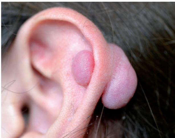
Figura 8. Queloides tras la aplicación de un piercing .

longarse hasta 9 meses (tabla 3). Tradicionalmente, los fabricantes de piercings empleaban el acero quirúrgico, que consiste en una aleación de carbono, cromo, níquel, molibdeno y hierro. Esta aleación, designada 316L y 316LVM en su versión al vacío, depende de la calidad del acabado para mantener su integridad una vez insertado en el cuerpo. Esto significa que, si el acabado del pendiente es deficiente, o si la pieza se daña, puede terminar liberando cromo, molibdeno o níquel. Por este motivo no se recomienda su uso durante el proceso de cicatrización 7 . El oro, para poder ser utilizado con esta finalidad decorativa, debe ser por lo menos de 14 quilates (58,3% de oro), y en perforaciones recién hechas de al menos 18 quilates (75% de oro). La utilización de materiales inertes como el titanio o el niobio puede ser una buena alternativa, aunque debemos recordar que, en ocasiones, también se encuentran trazas de níquel en estos artículos 17 . Por otra parte, conviene recordar que los metales no son la única fuente de sensibilización, y que al igual que sucede en cualquier intervención quirúrgica, el material utilizado en la realización de una perforación, como los antisépticos, los anestésicos o los guantes, pueden causar reacciones de hipersensibilidad retardada o inmediata.