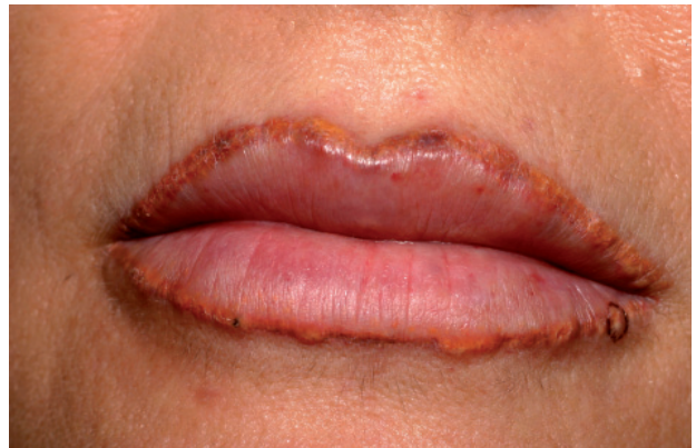
Figura 3. Reacción inflamatoria granulomatosa tras micropigmentación del reborde labial.