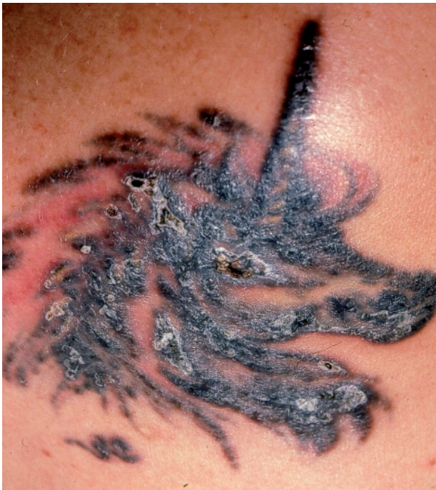
Figura 1. Reacción inflamatoria eczematosa por pigmento negro.