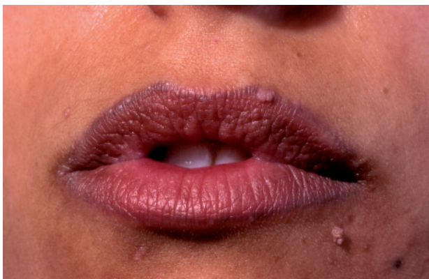
Figura 6. Implantación de verrugas víricas tras micropigmentación del reborde labial.

micas cuya puerta de entrada son los tatuajes 40,42,43,59 . Dada la mayor susceptibilidad de sufrir una endocarditis, en aquellos pacientes con cardiopatías congénitas se debería desaconsejar la realización de tatuajes o piercings o, al menos, retrasarla hasta consultar con el cardiólogo 60 .