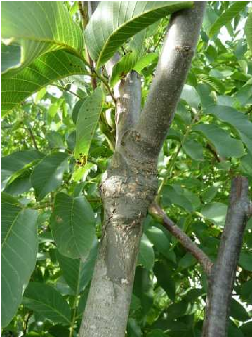
Couronne-Veredlung Ende Mai 2009, Foto September 2010 Franquette auf Ast des ca. 25-jährigen Nussbaumes

Diesen Vortrag und mehr zum Veredeln von Nussbäumen in Freiland finden Sie auf meiner Homepage: www.walwal.ch . Eine gekürzte Fassung des Vortrages ist in der szow Nr 22 vom Oktober 2010 abgedruckt.