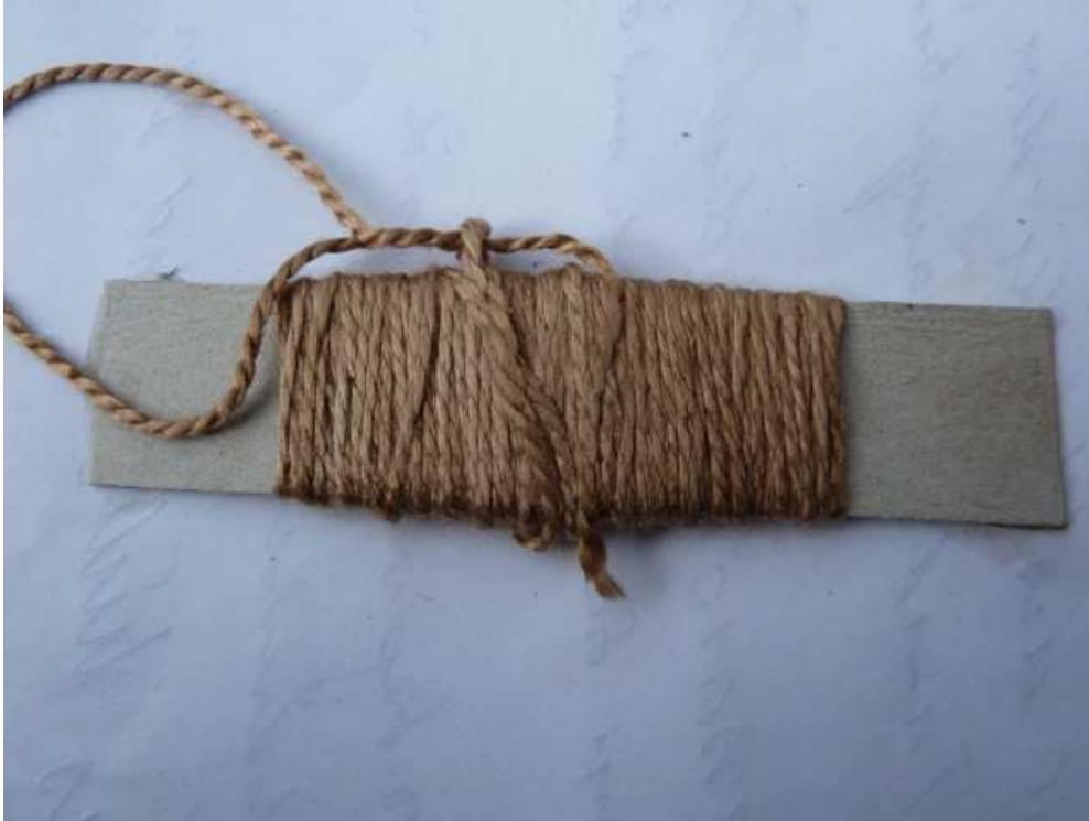
Mit grüner Nussschale gefärbte Seide

Der Farbstoff verbindet sich stark mit Eiweissen und ist nur schwer zu entfernen. So muss man bei den Händen in der Regel einige Tage oder Wochen warten, bis der Farbstoff weggeht respektive die gefärbten Hautzellen abgetragen sind.