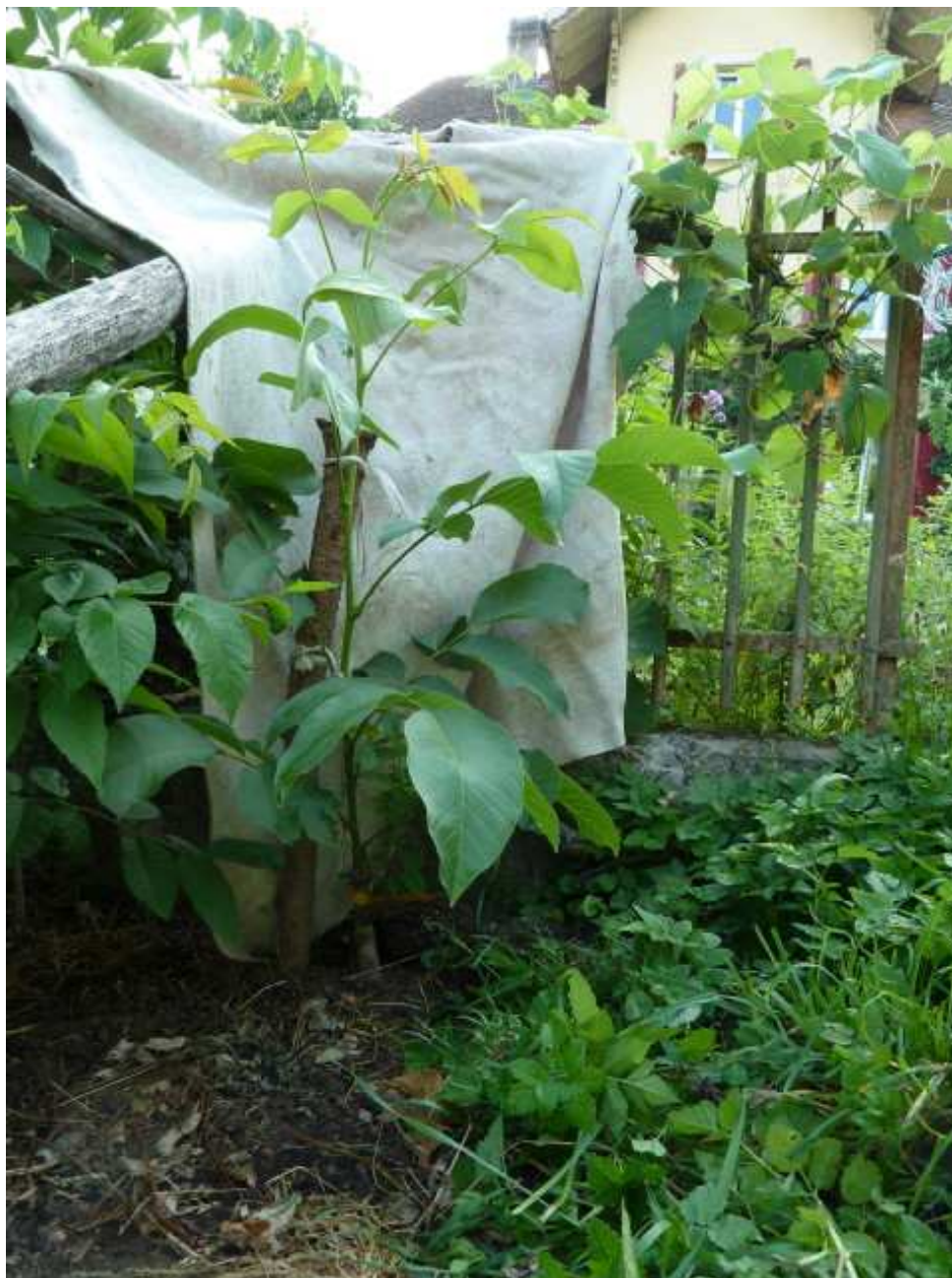
Plattenokulation vom 19.5. wie oben, Foto 13.7.2010 Franquette auf Juglans nigra