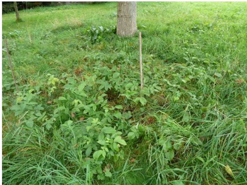
Nussbäume unter Nussbaum

Juglon hemmt das Auskeimen von Samen vieler Pflanzen. Es gibt darüber einige Studien. Wenn man eine Saatkiste mit ausgesäten Samen mit einer Juglonlösung giesst und eine Vergleichssaatkiste nur mit Wasser ohne Juglon, kann man die Hemmwirkung schön zeigen. Offenbar hemmt Juglon die Wachstumshormone wie Giberellin und Zytokinin. Die Hemmwirkung auf die Keimung ist aber nicht absolut. Unter unserem Nussbaum gibt es im Frühling einen Teppich von Bärlauch. Möglicherweise kommt das Juglon nicht bis zu den Knollen des Bärlauch oder es wirkt bei Bärlauch nicht. Und unter dem Nussbaum von meinem Nachbarn wachsen sogar Nussbäume, wie das Foto vom 26.9.2010 zeigt. Er hatte das Nussbaumlaub im Herbst weggeräumt. Die Wirkungen respektive Nichtwirkungen von Naturstoffen sind immer sehr differenziert betrachten.