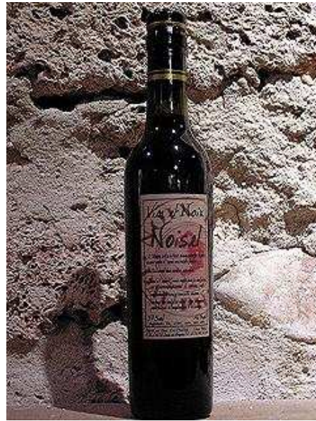
Vin de noix