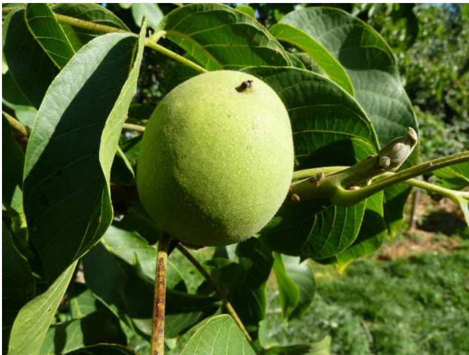
Grüne Nuss und Blätter

Nussbäume werden seit vielen Jahrhunderten wegen den wertvollen Nüssen kultiviert. Bald hat man gemerkt, dass auch die grünen Schalen und Blätter des Nussbaumes interessante Wirkungen besitzen. Im ersten Kapitel berichte ich über diese allgemeinen Wirkungen..