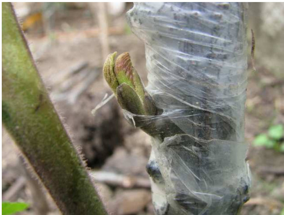
Plattenokulation vom 19.5., Foto 6.6.2010 Franquette auf Juglans nigra