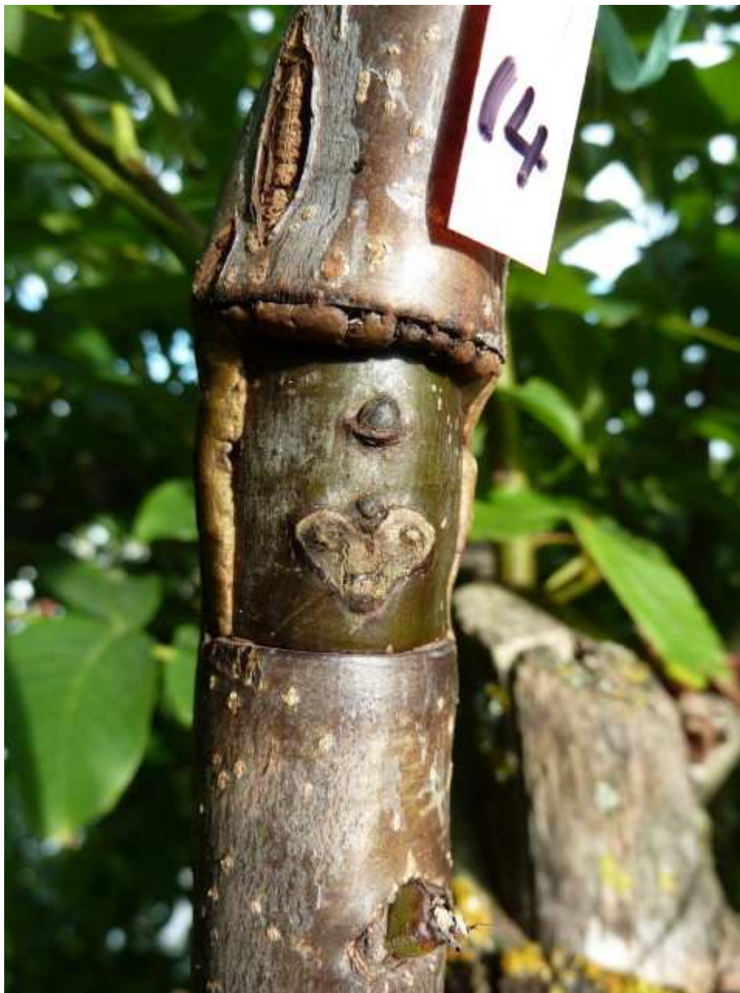
Plattenokulation vom 23.7., Foto 9.9.2010 Lara auf Ast eines ca 25-jährigen Nussbaumes