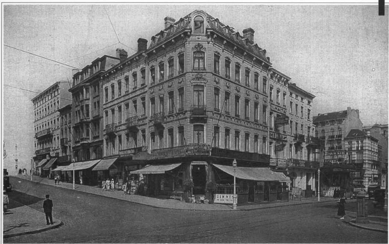
Onder : Tijdens het interbellum.