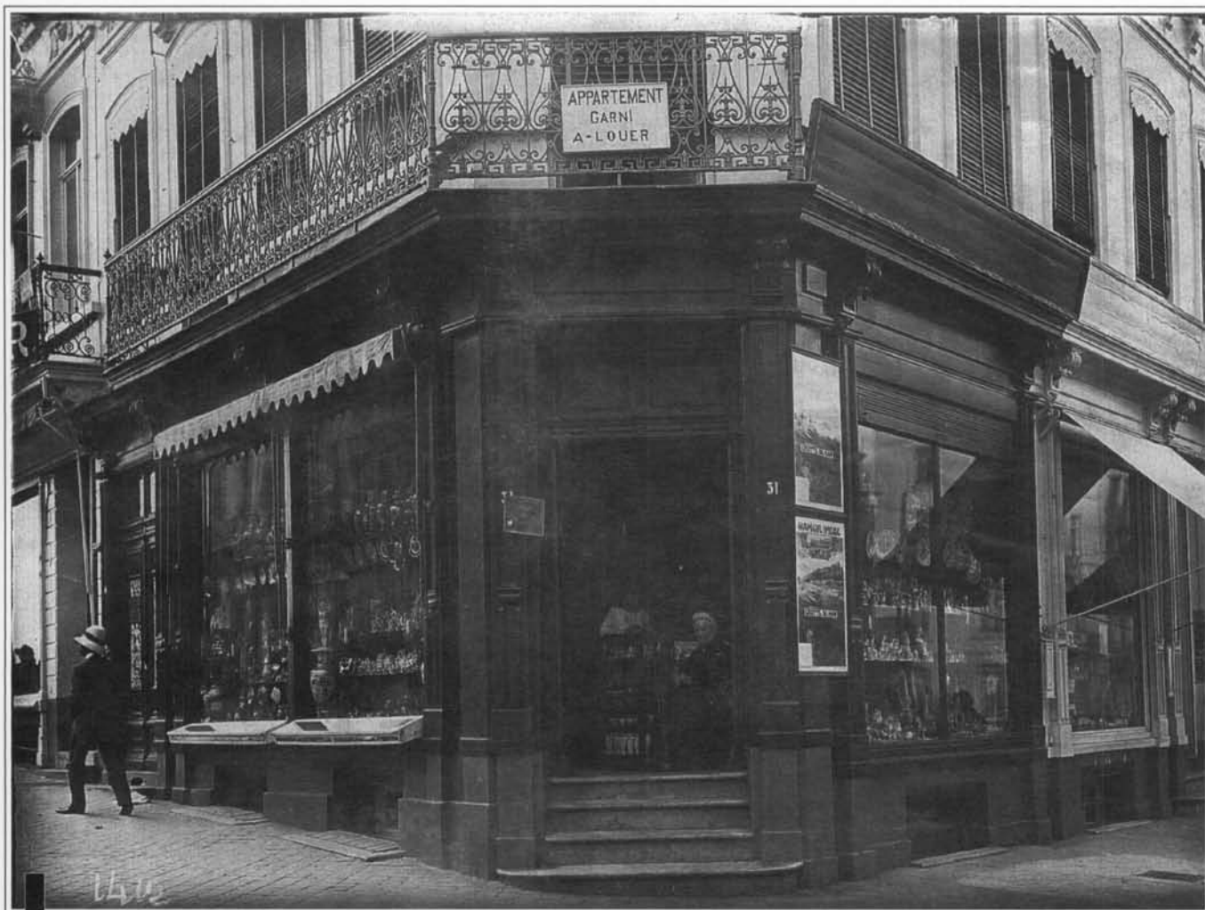
Boven : Origineel als souvenirwinkel (vòdr 1914).