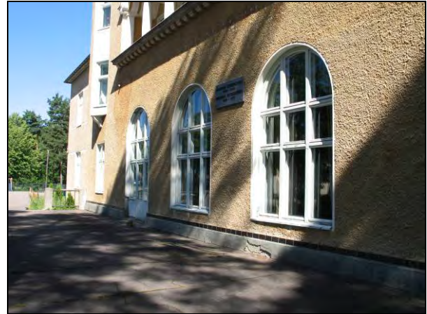
Kuva 81-82. Imatran yhteiskoulu, Imatran yhteislyseo.