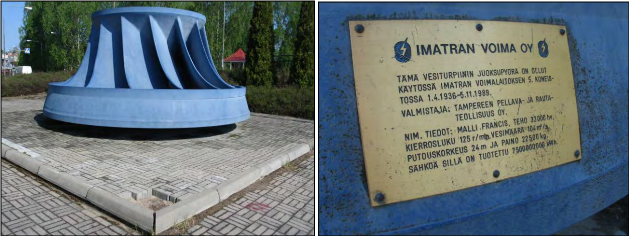
Kuva 97–98. Turbiini ja infotaulu. Teoksen vierestä löytyy infotaulu myös englanniksi.