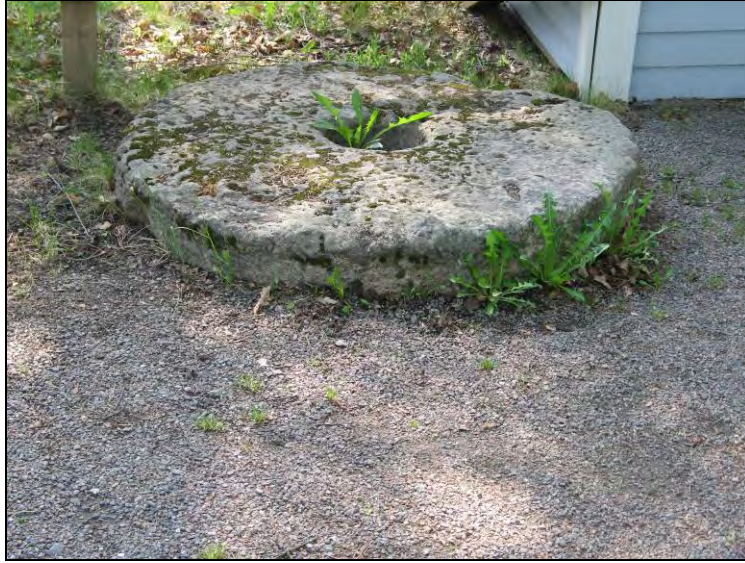
Kuva 110. Kesäteatterin myllynkivet.