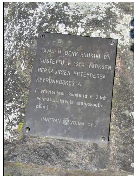
Kuva 108-109. Hiidenkirnu ja muistolaatta.