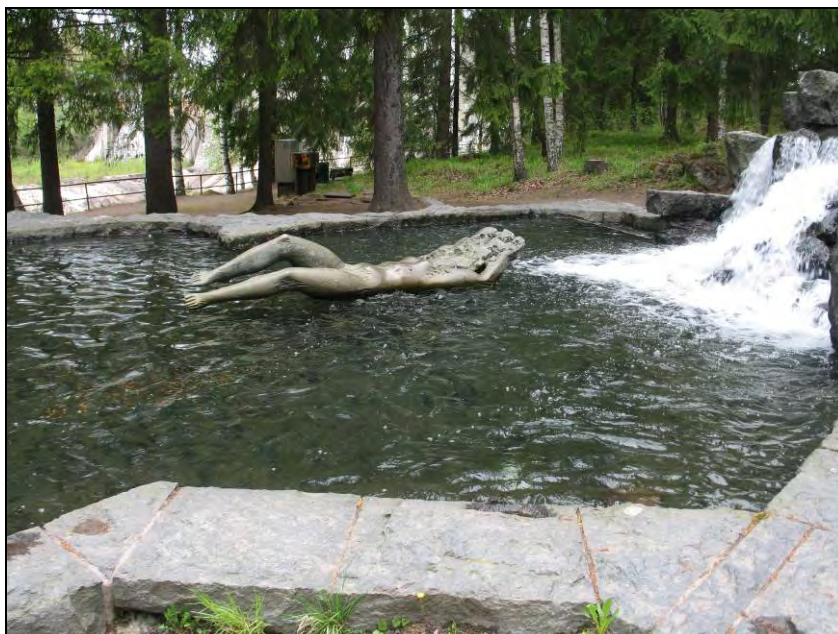
Kuva 46. Taisto Martiskainen, Imatran Impi.