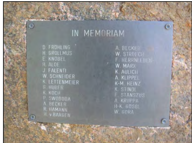
Kuva 31-32 Muistomerissä olevat muistolaatat, oikealla menehtyneiden saksalaislentäjien nimet