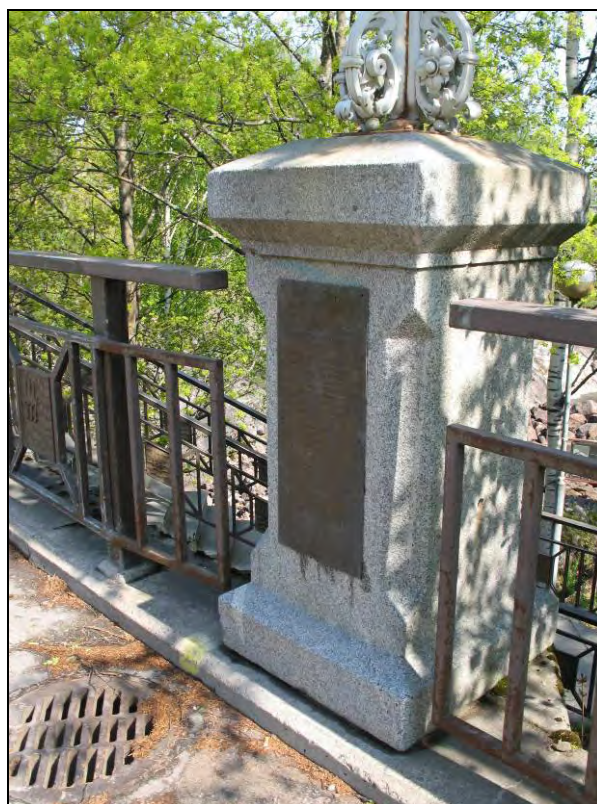
Kuva 103-104. Imatrankosken sillan valaisinpylväät ja muistolaatat.