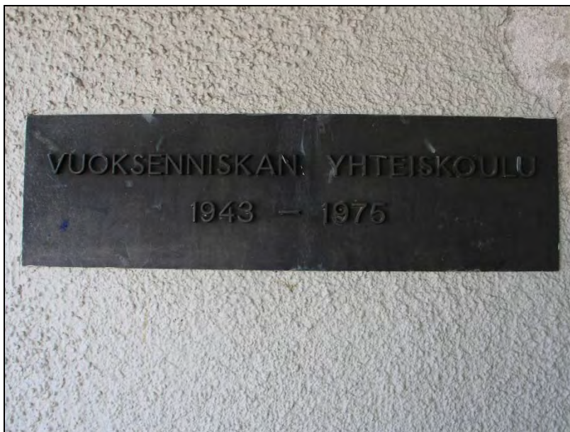
Kuva 83. Vuoksenniskan yhteiskoulu.