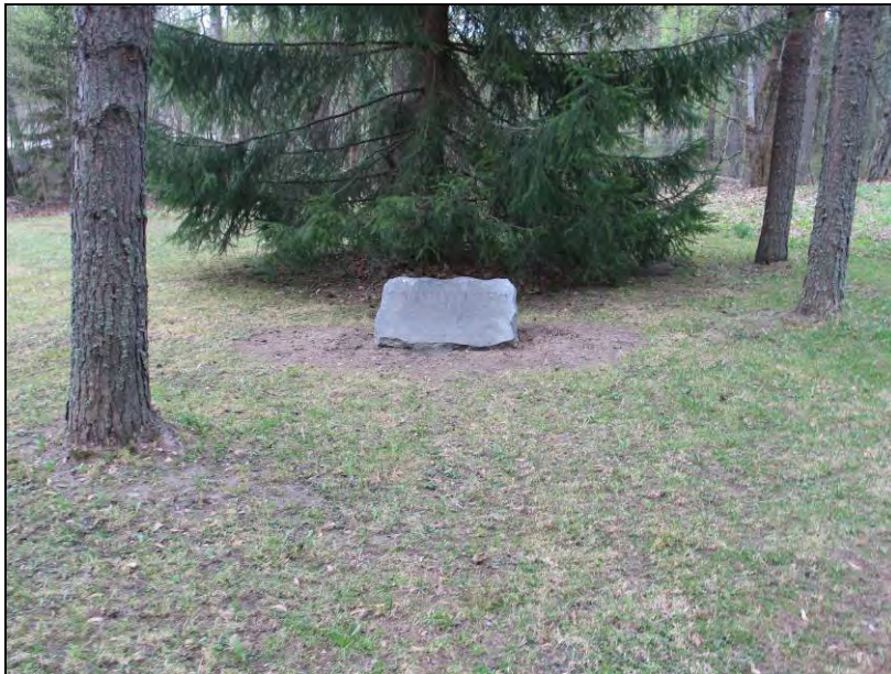
Kuva 67. C.G.E. Mannerheim.