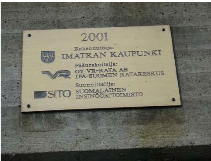
Kuva 91. Kaukopään alikulkutunnelin muistolaatta

Muuta huomioitavaa muistomeristä: Muistomerkin läheisyydessä ei ole turvallista pysähtymis- tai pysäköintipaikkaa, parhaiten muistolaattaa voi tarkastella autosta. Ympäristö ei sovellu liikuntaesteisille.