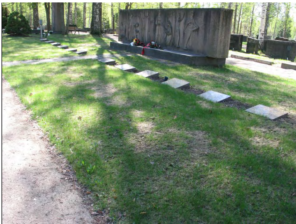
Kuva 10 Veljesuhri 1918, edessä 12 hautakiveä.