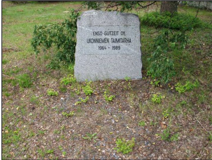
Kuva 77. Ukonniemen taimitarha.