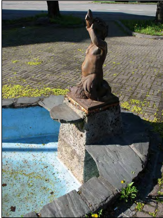
Kuva 113. Suihkulähde