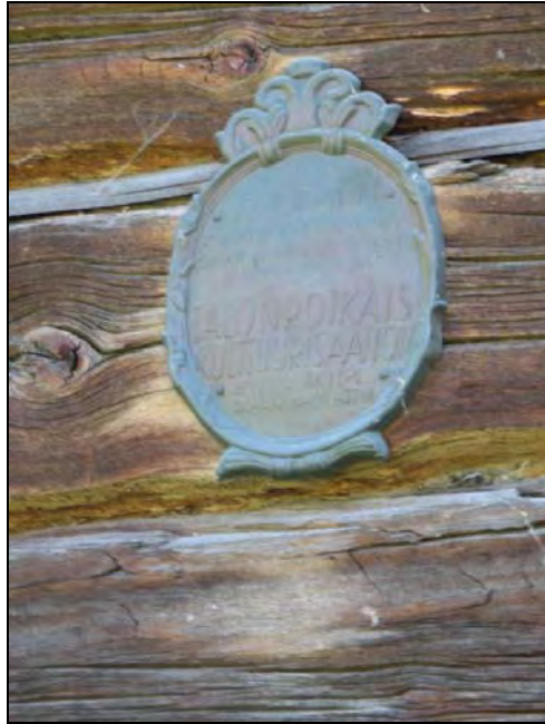
Kuva 88. Karjalaisen kotitalon muistolaatta.