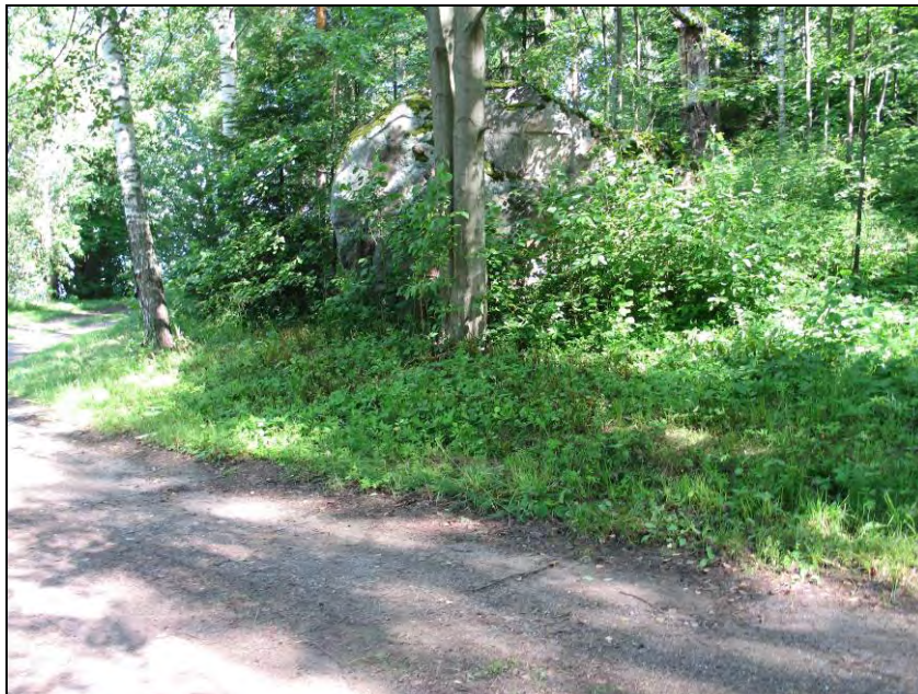
Kuva 85. Harakan rannassa oleva suuri kivi jossa muistolaatta on sijainnut.