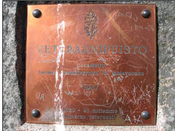
Kuva 92. Veteraanipuiston muistolaatta.