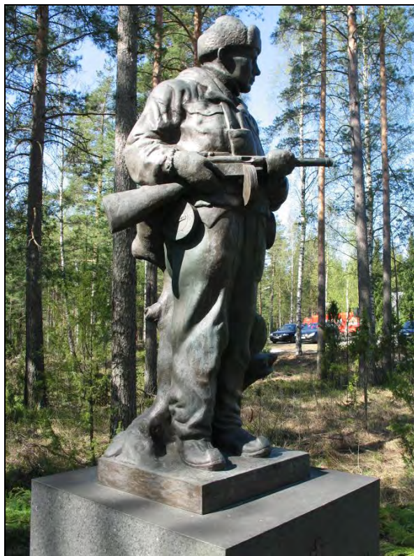
Kuva 50. Sotilaskodin ja Rajamuseon parkkipaikan vieressä.