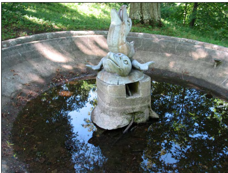
Kuva 114. Harakanhovin suihkulähde.