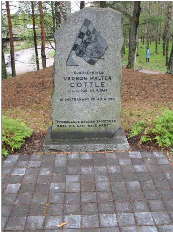
Kuva 26 Vernon Walter Cottle