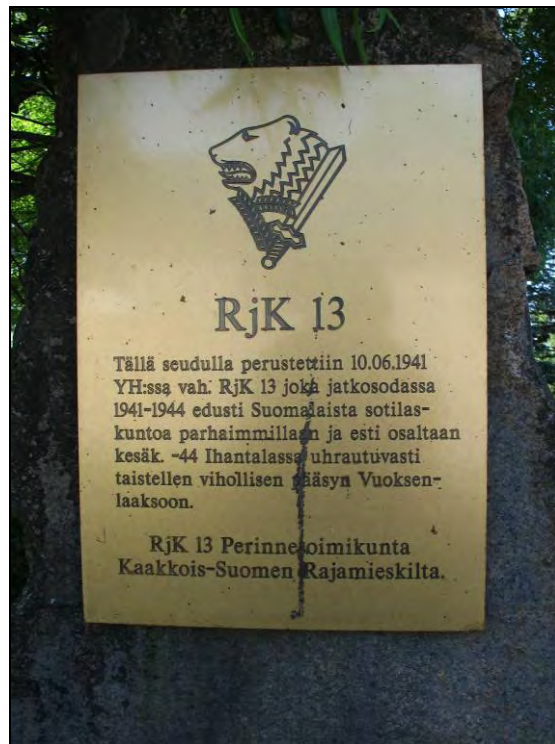
Kuva 69–70. RjK 13, muistolaatta. Pelkolan rajavartioasema.