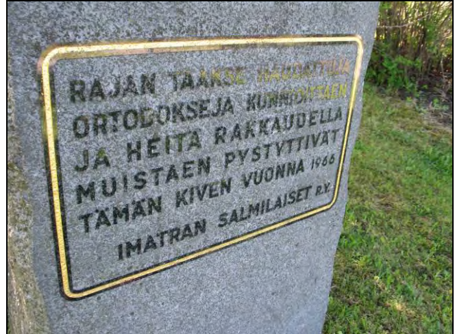
Kuva 24-25 Rajan taakse jääneiden ortodoksien- muistomerkki