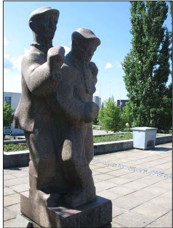
Kuva 44-45. Aimo Tukiainen, Tukinuittajat.