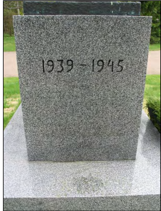
Kuva 8-9 Kalervo Kallio Karjalan itkuvirsi