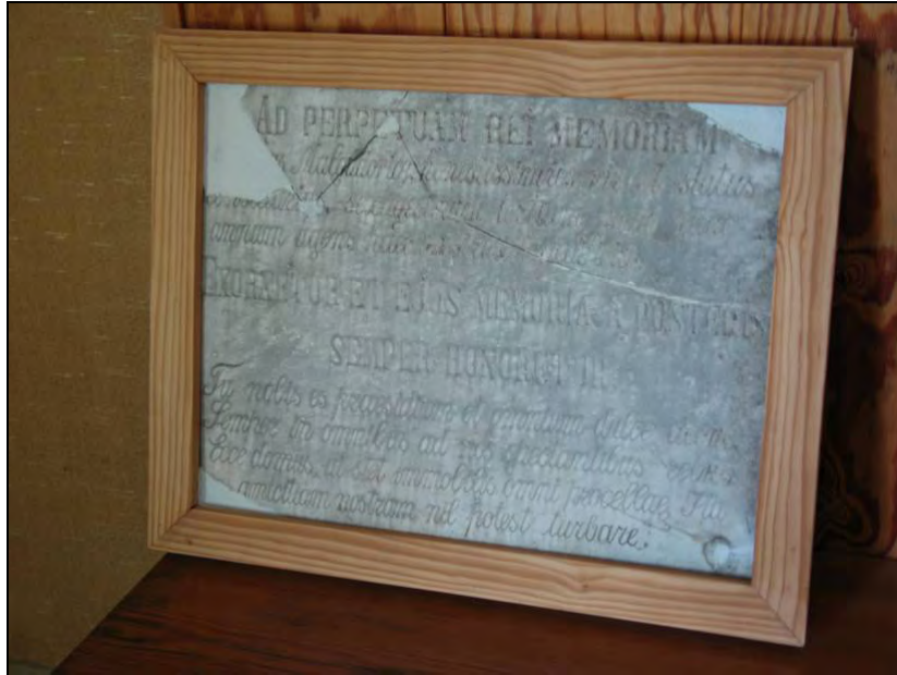
Kuva 84 Harakanhovin muistolaatta.