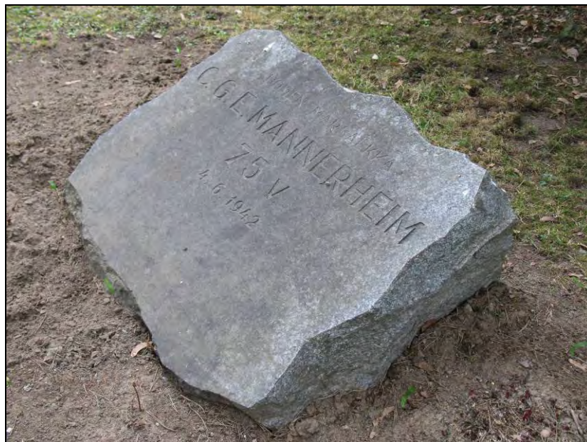
Kuva 68. "Suomen Marsalkka C.G.E. Mannerheim 75 V. 4.6.1942".