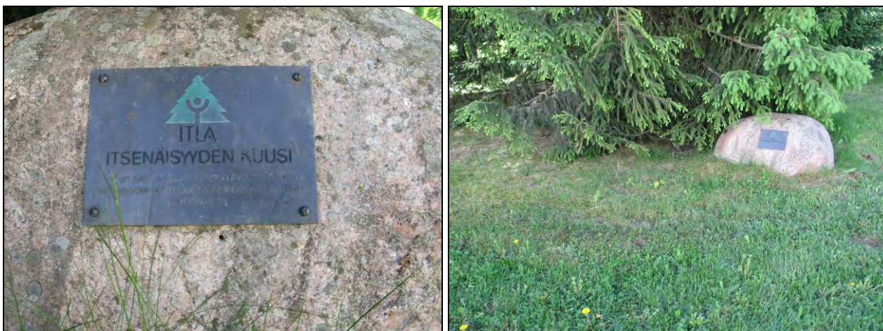
Kuva 65-66. Kulttuurikeskuksen takapihalla sijaitseva ITLA:n muistolaatta ja kuusi.