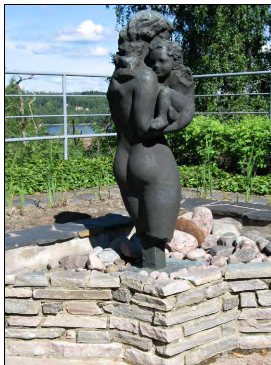
Kuva 33-34. Tulevaisuus