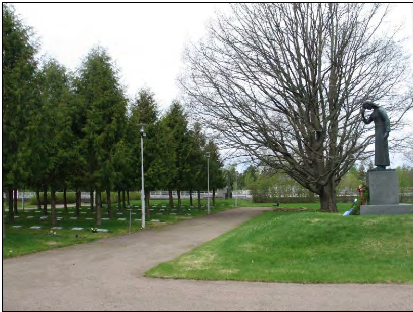
Kuva 7 Imatrankosken sankarihautausmaa