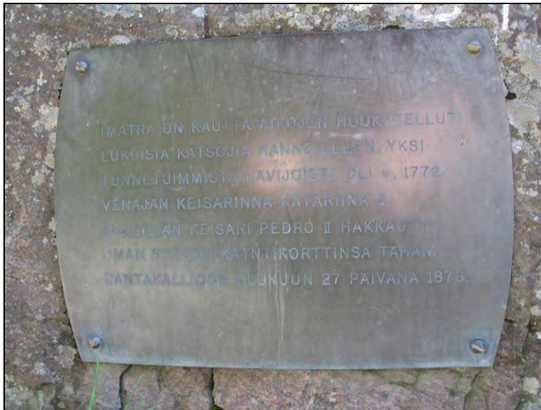
Kuva 89. Katariina II ja Pedro II vierailun muistolaatta.