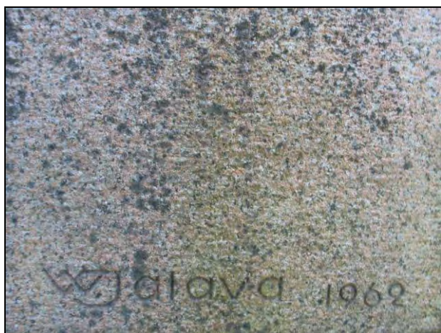
Kuva 11-12 W. Jalava 1962 Veljesuhri