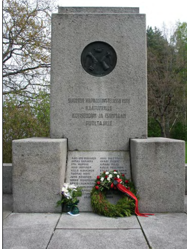
Kuva 18 "Suomen vapaustaistelussa 1918 kaatuneille kotiseudun ja isänmaan puoltajille"