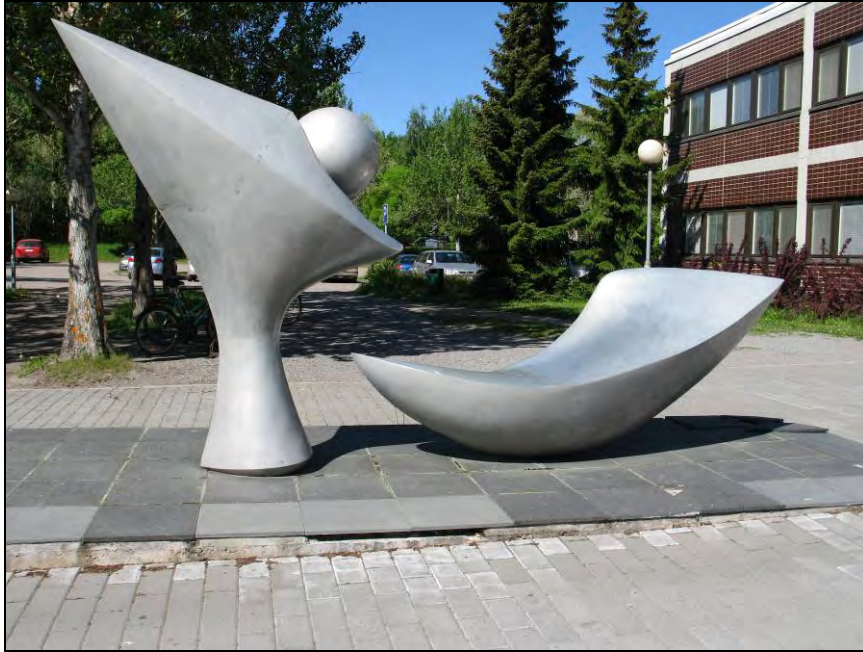
Kuva 48. Veikko Nuutinen, Valssi.