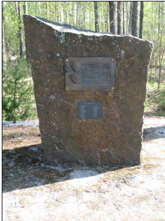
Kuva 30 Lento-osasto Kuhlmeyn- muistomerkki