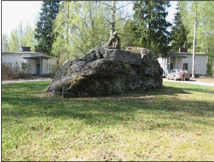
Kuva 42 Gunnar Finne, Leikkivä nalle.