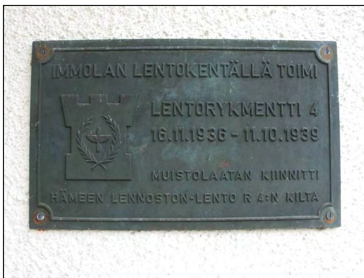
Kuva 79. Lentorykmentti 4.