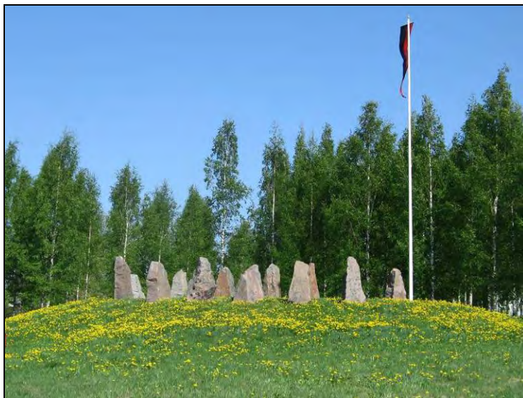
Kuva 94. Veteraanipuiston kumpu ja kivipaadet.