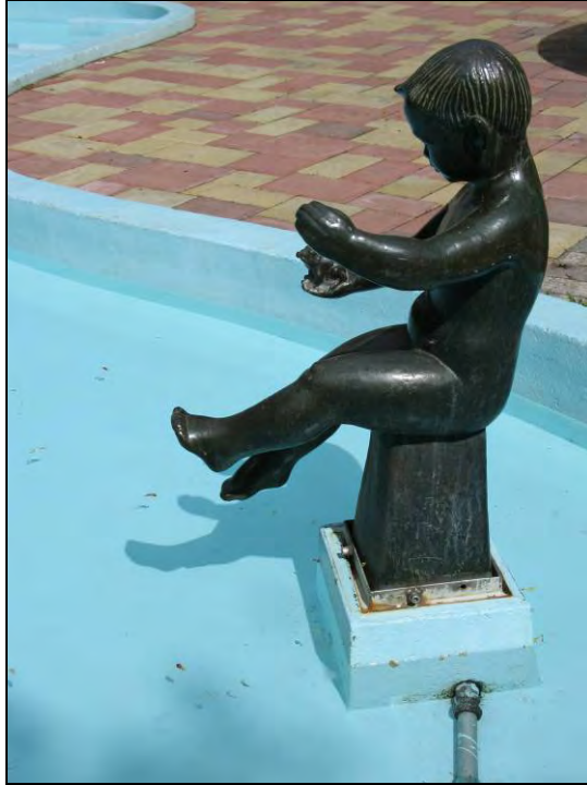
Kuva 37 Poika ja sammakko, kahluuallas.