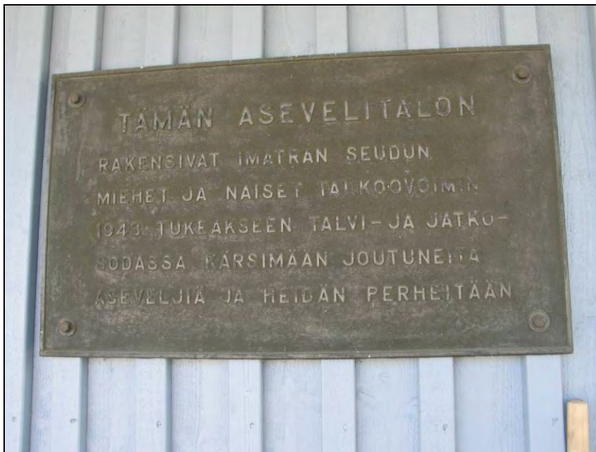
Kuva 86. Asevelitalon muistolaatta.