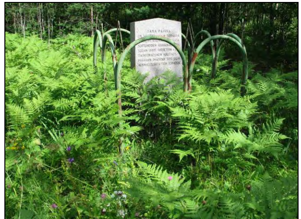
Kuva 13-14 Vakaumuksensa puolesta 1918