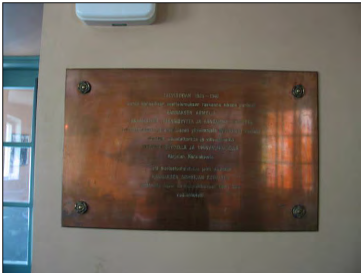
Kuva 78 Kannaksen armeijan esikunnan muistolaatta.