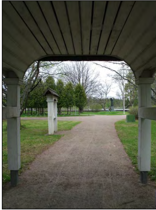
Kuva 106. Porttirakennus ja infotaulu.