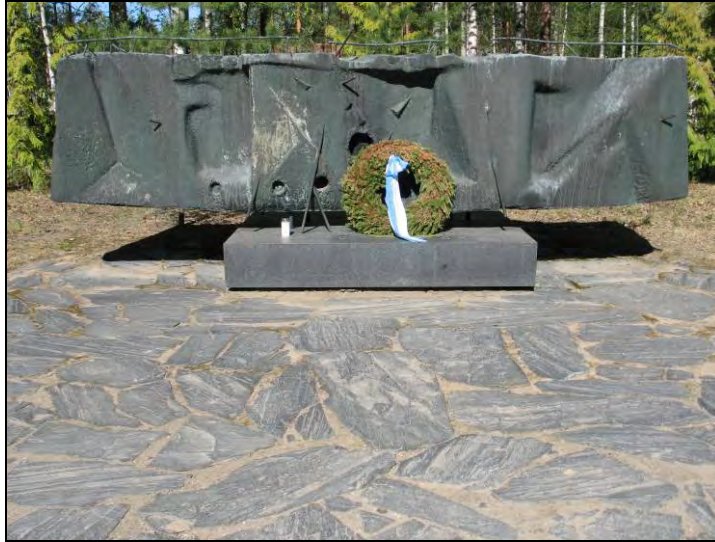
Kuva 1 Aimo Tukiainen Vaiennut linnake