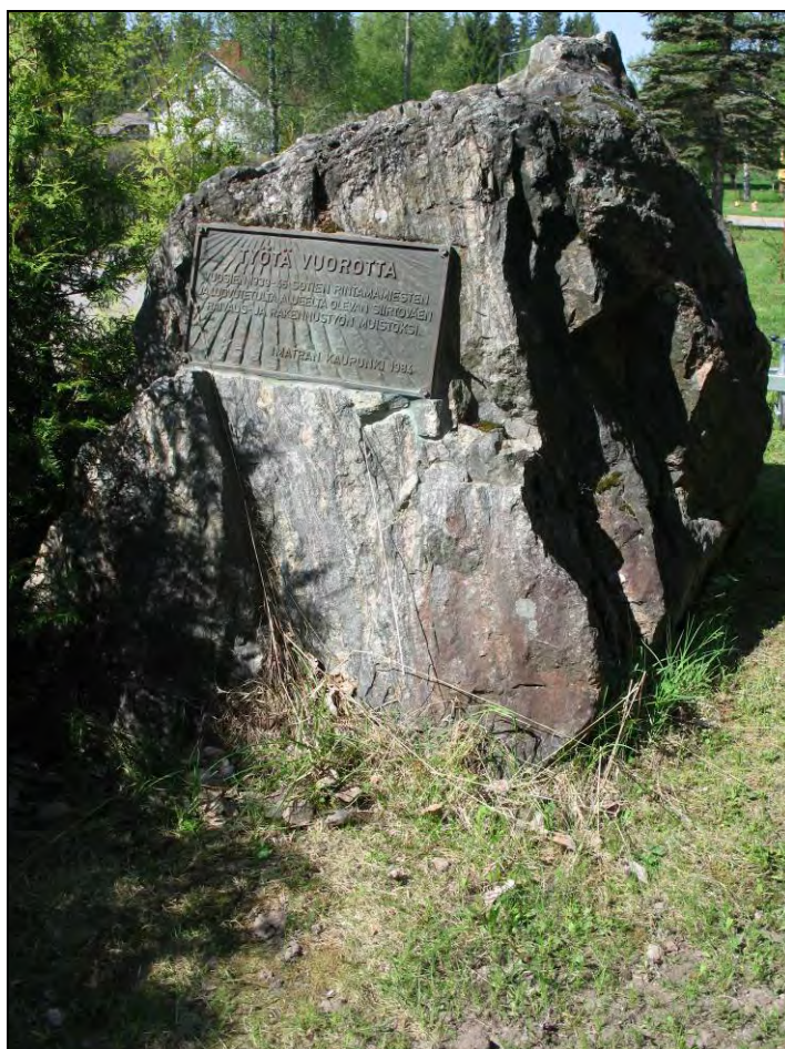
Kuva 72. Linnansuontie 82.