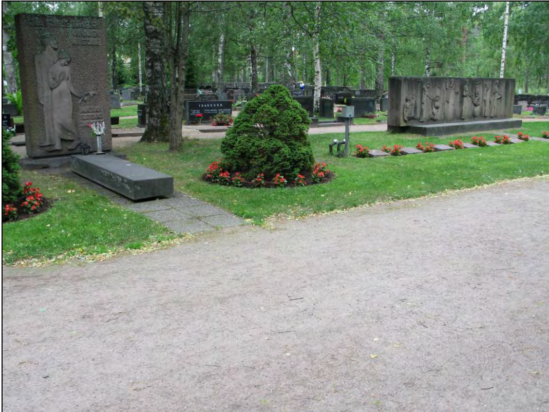
Kuva 23 Rajan taakse jääneiden vainajien muistolle ja Veljesuhri 1918