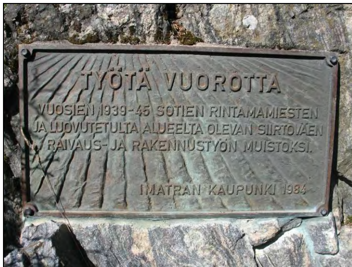
Kuva 71 "Työtä vuorotta. Vuosien 1939–45 sotien rintamamiesten ja luovutetulta alueelta olevan siirtoväen raivaus- ja rakennustyön muistoksi. Imatran kaupunki 1984"