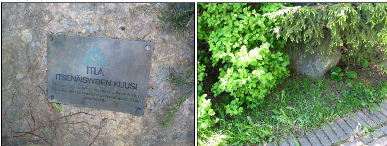
Kuva 63-64. Itsenäisyyden kuusi-muistolaatta. Paikalle istutettu kuusi on kasvanut muistolaatan päälle ja laatta on vaikeasti havaittavissa.