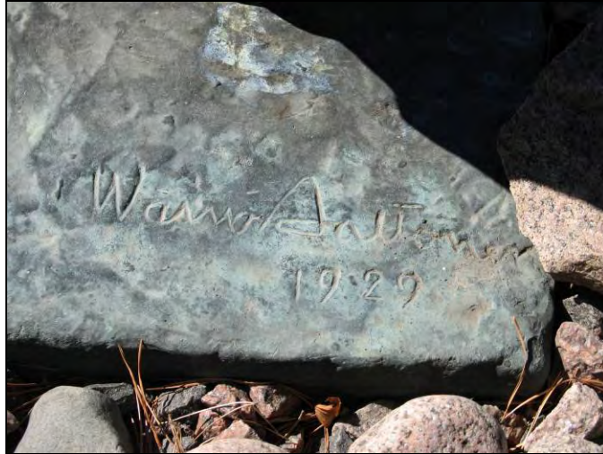
Kuva 35 Väinö Aaltonen 1929.