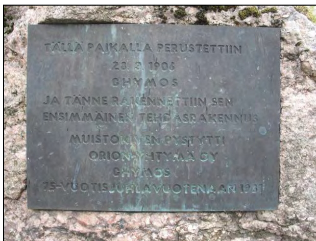
Kuva 75–76. Chymoksen muistolaatta. "Tällä paikalla perustettiin 28.3.1906 Chymos ja tänne rakennettiin sen ensimmäinen tehdasrakennus. Muistokiven pystytti Orion-yhtymä Oy. Chymos 75-vuotisjuhlavuotenaan 1981".