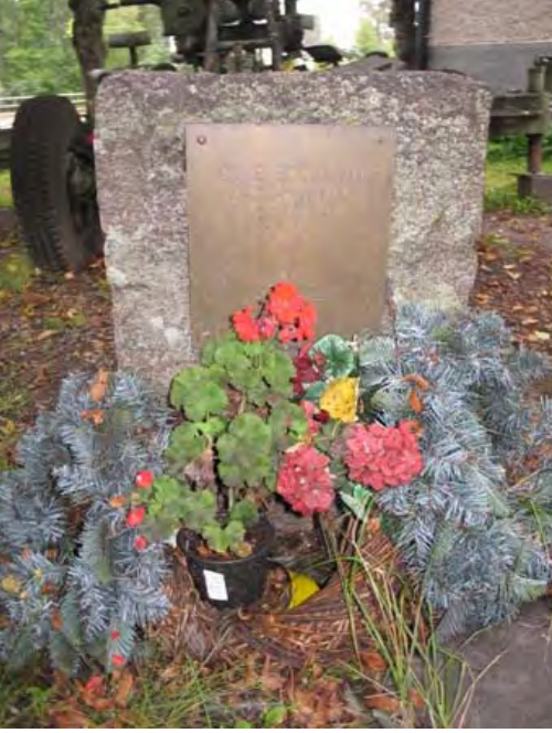
Kuva 116 Laatokan rannikopuolustajien muistokivi