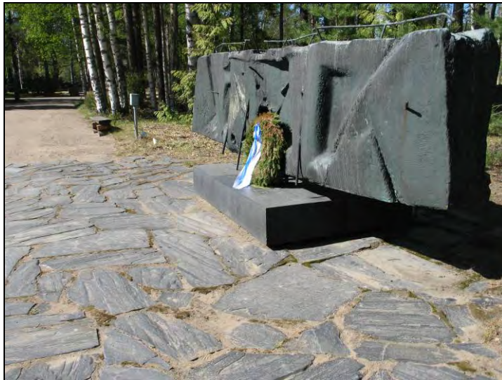
Kuva 2 Aimo Tukiainen Vaiennut linnake