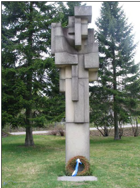
Kuva 5 Kauko Räike Rauhan kellot