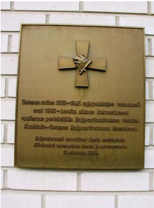
Kuva 80. Rajaveteraanien muistolaatta

Muistolaatta on pystytetty rajaveteraanien perinnetyön muistoksi. Rajaveteraanit ovat kokoontuneet vuosittain elokuussa Raja- ja Merivartiokoulun alokkaiden valapäivänä juhla- ja muistotilaisuuteen Kaakkois-Suomen Rajavartiostoon. Sodanajan rajajoukoissa palveli yhteensä noin 40.000 miestä yhdeksässä eri pataljoonassa 85 .