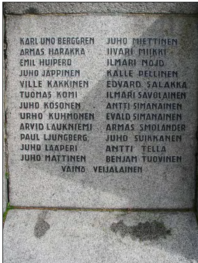
Kuva 19 Kaatuneiden nimilista