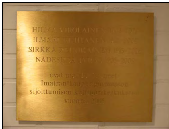
Kuva 87. Kaupunginmuseon muistolaatta.