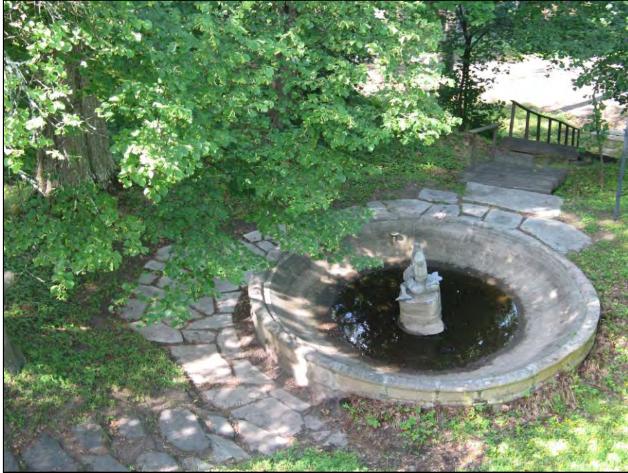
Kuva 115. Suihkulähde kuvattuna Harakanhovin parvekkeelta.