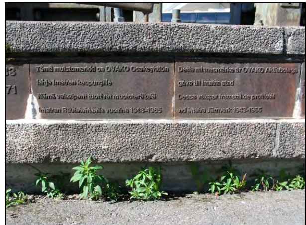
Kuva 101-102. Muistomerkin lahjoittaja. Teksti suomeksi, ruotsiksi, englanniksi, venäjäksi ja saksaksi.