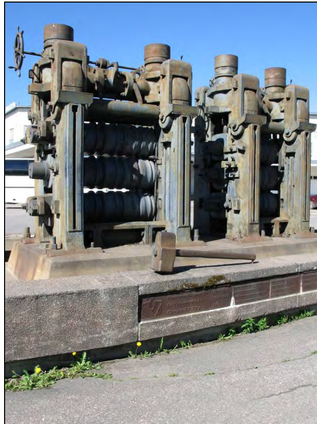
Kuva 100. Valssikoneisto.