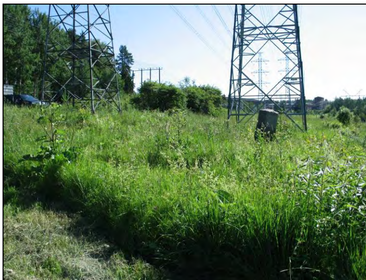
Kuva 57-58. Ruokolahti - Joutseno. Rajapyykki sijaitsee voimalinjojen alla korkeassa heinikossa.