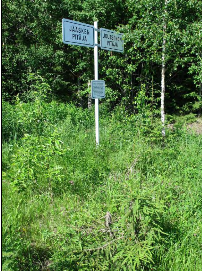
Kuva 56. Jääsken pitäjä - Joutsenon pitäjä.