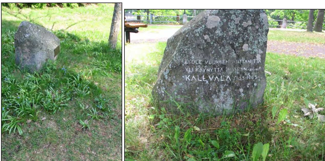
Kuva 59-60. Kalevalan juhluvuoden kivi ja muistopuu.