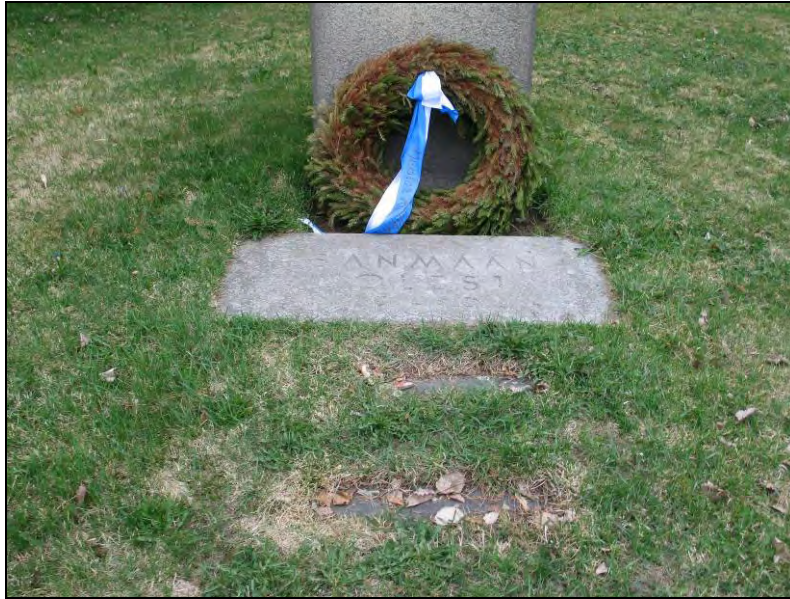
Kuva 6 "Isänmaan puolesta 1939–1945"