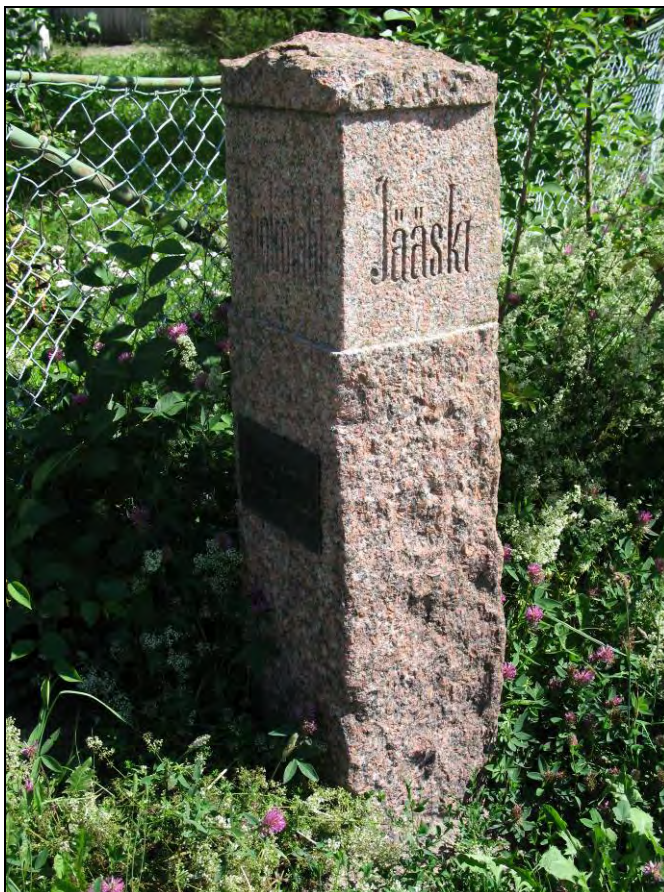
Kuva 55. Ruokolahti-Jääski. Rajapatsas.