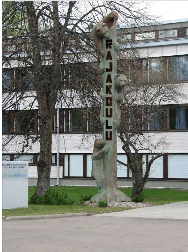
Kuva 111. Rajakoulun toteemi.