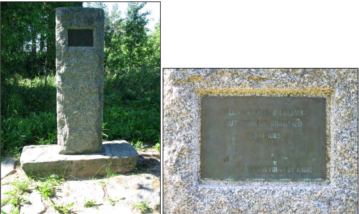
Kuva 73- 74. Miikkien sukutalon muistomerkki. "Tällä paikalla on sijainnut Miikkien sukutalo v.1544–1895. Imatran Voima Oy. V. 1982."