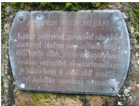
Kuva 107 Kruunupuiston hiidenkirkujen muistolaatta

Saimaa puhkaisi itselleen uuden väylän Imatran kohdalta noin 4000 vuotta sitten. Vesimassat löysivät itselleen uuden väylän Salpausselän läpi vuosisatojen kuluessa ja tapahtuman seurauksena syntyi Vuoksi. Alkujaan vesimassat kulkeutuivat alavirtaan leveänä massana ja kuluttivat hiljalleen syvempää uomaa itselleen. Maa-aines pyyhkiytyi veden virtauksen myötä paikoitellen kokonaan pois ja paljastivat peruskallion. Hiidenkirkut syntyivät tämän leveän koskivaiheen aikana ja niitä on edelleen nähtävissä Imatran Kruunupuistossa. Vuoksi syövytti nykyisen syvän uomansa vähitellen vuosisatojen aikana. Veden virtauksen voimasta Vuoksi synnytti itselleen uoman ja samalla Imatran kosken. 111