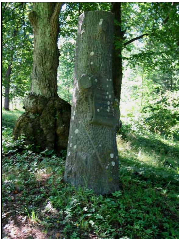
Kuva 95-96. Astascheffin kanto.