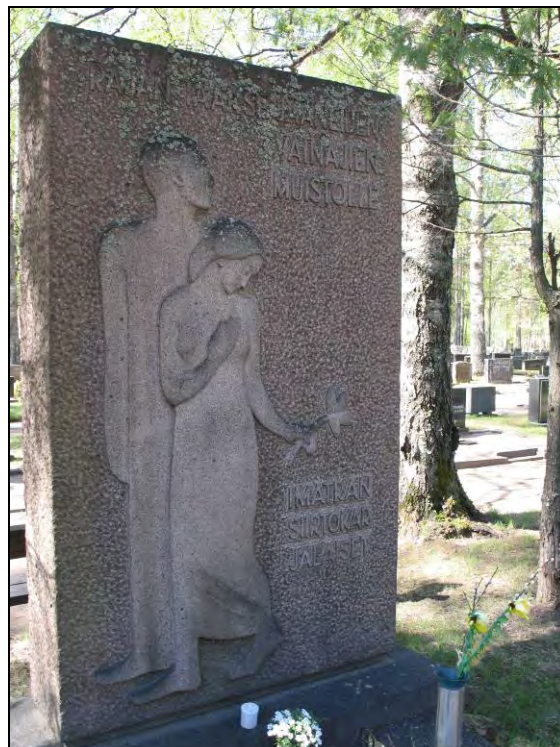
Kuva 21-22 Kirsti Liimatainen Rajan taakse jääneiden vainajien muistolle