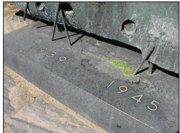
Kuva 3-4 taiteilijan signeeraus, teoksessa olevat vuosiluvut