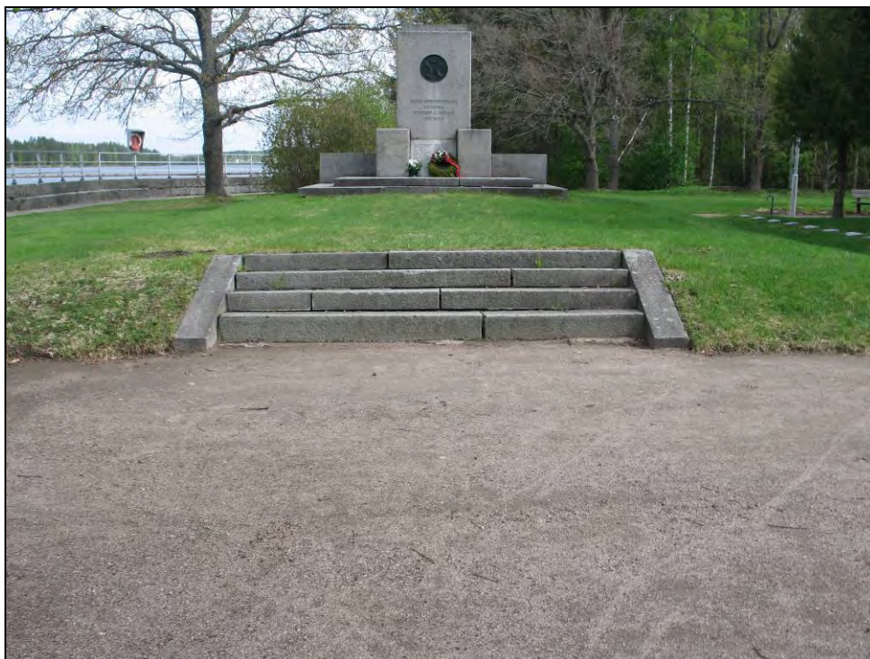
Kuva 17 Akseli Einola Vapaussodassa kaatuneiden muistomerkki