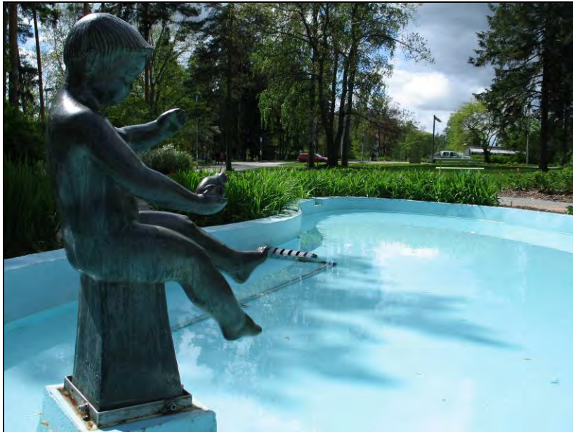
Kuva 36 Armas Tirronen, Poika ja sammakko