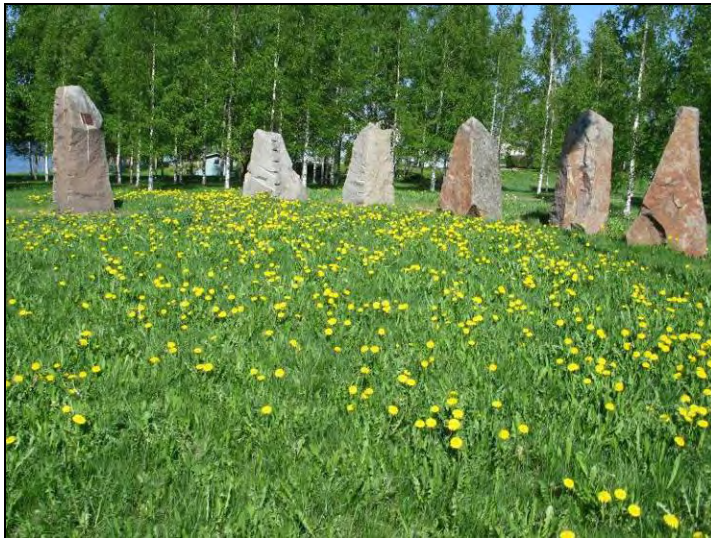
Kuva 93. Veteraanipuiston kivipaadet. Muistolaatta on kiinni ensimmäisessä kivessä vasemmalta.