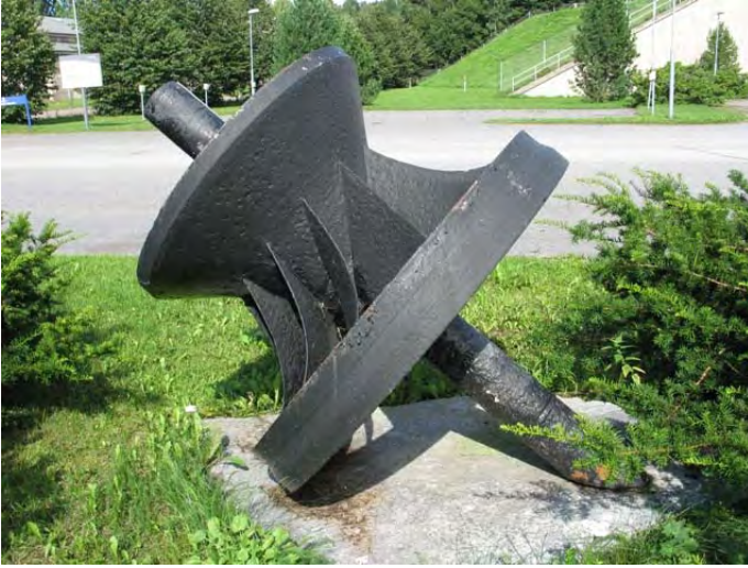
Kuva 99. Tainionkosken vesivoimalaitoksen muistomerkki