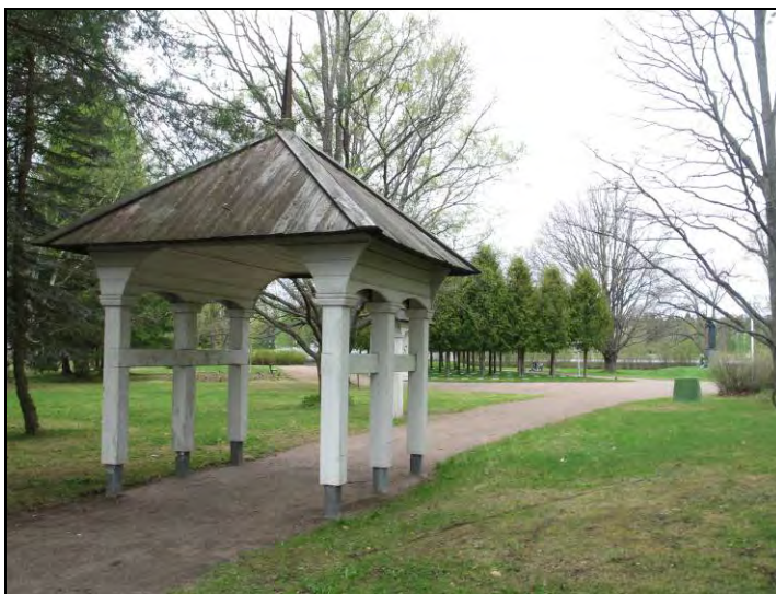
Kuva 105. Jääsken kirkon porttirakennus. -