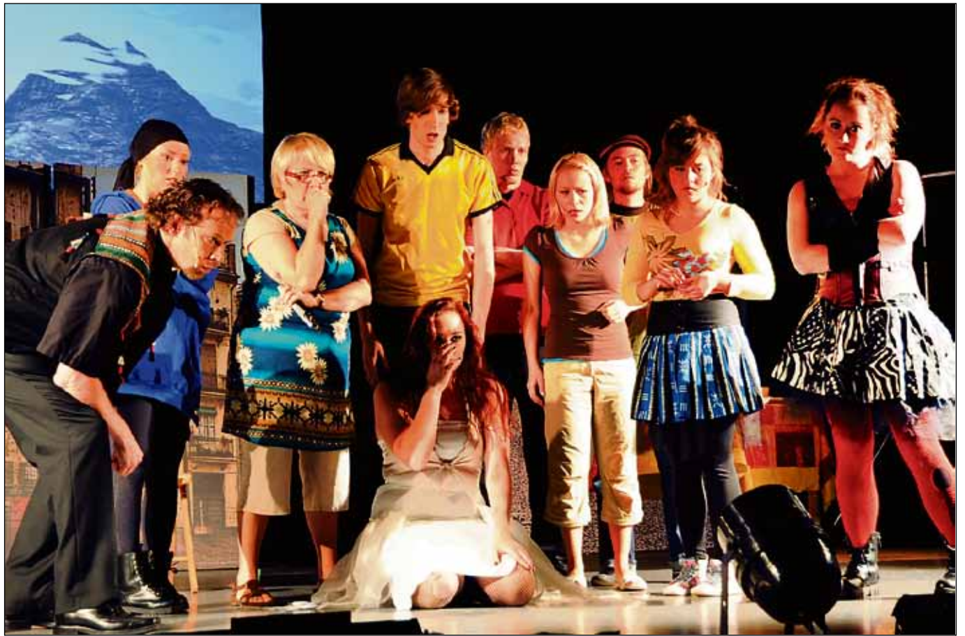
Onnen vuori -musikaalissa koetaan dramaattisia hetkiä tulivuoren purkautuessa.