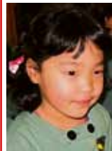
Nukketeatteri "Tule Aiko mukaan"

Koko perheen PÄÄSIÄISTAPAHTUMA la 31.3. klo 14-16 Hyvinkään Luther-talossa, Harjukatu 1