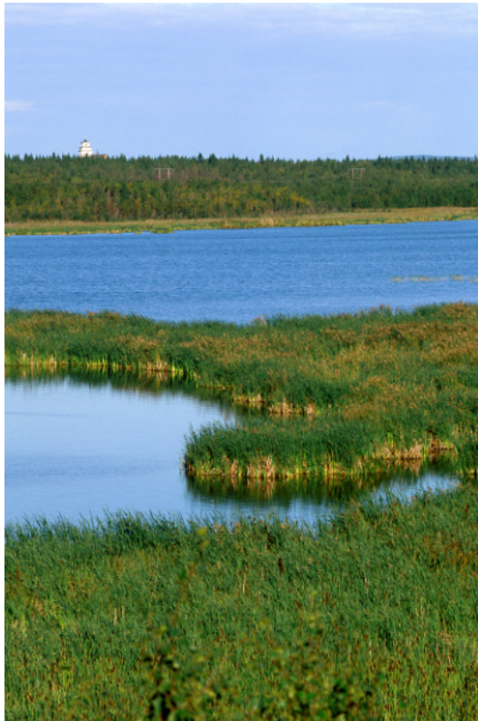
Gammelstadviken från fågeltornet med Gammelstadskyrka i bakgrunden.