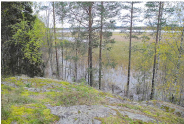
Bilder längs "Gammelstadsleden".

Övergripande beskrivning med förslag Från ny entré vid Notviken måste stigen nyanläggas, med omfattande spångning och några broar över diken, fram till stranden nedanför gamla fågelskådarbyggnaden. Härifrån finns befintlig liten stig fram till den gamla kofärjan och upp till den befintliga stora leden. Långa sträckor av den gamla leden behöver spångas med förhöjd och bredare spång. Ambitionen bör vara mer ramp än spång längs hela leden.