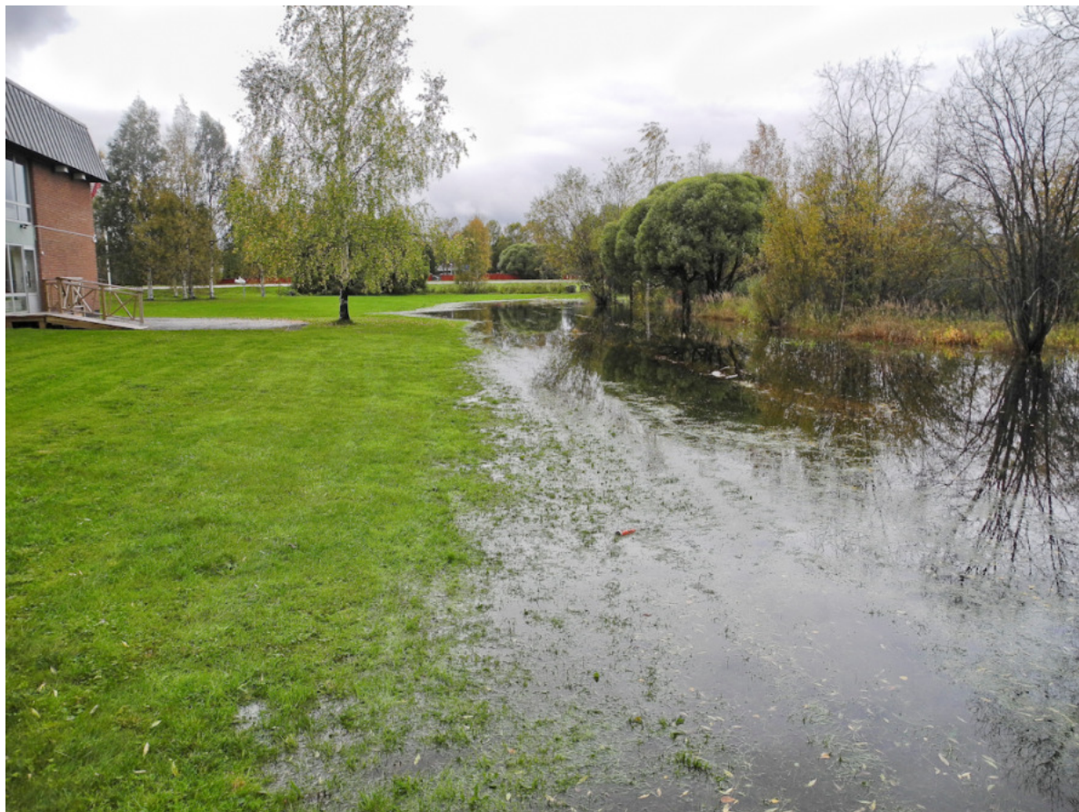
Stränderna översvämmade kring Mjolkuddstjärnen vid hotellet.

Gammelstadsviken ligger nära flera bostadsområden i tätorten, men är trots detta inte särskilt välbesökt. Viken begränsas på södra och västra sidan av vägar och järnväg. Här finns inga möjliga besöksvägar in i reservatet. De främsta entréerna är idag från Porsön, från Gamla Haparandavägen och från Hägnans friluftsmuseum. En vandringsled knyter ihop dessa tre entréer. Många besökare vid Världsarvcentret frågar efter vandring till Gammelstadsviken. Bitvis är leden dåligt underhållen vad gäller spångning. Vid det högvatten som rådde hösten 2011 var det omöjligt att även med stövlar ta sig fram på spången längs vissa sträckor. Nära E4 är leden främst anpassad för att fungera som skoterled. Ett problem för besökare är att avståndet till fåglarna ofta är långt och utblickarna mot vattnet få. Det är egentligen bara från fågeltornet man kan se ut över vattenytan, och där handlar det om många hundra meter eller någon kilometer till fågelflockarna. Från E4 och väg 97 finns ingen åtkomst över huvud taget till viken. Länsstyrelsen förvaltar naturreservatet och i början av 2000-talet gjordes nya skyltar och foldrar för området. Viss upprustning av leder och rastplats vid tornet har skett under senare år.