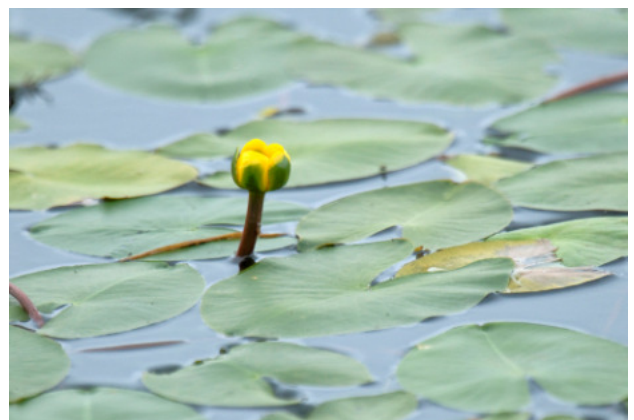
Arter i Mjökuddstjärnen och Gammelstadviken: Sot höna, bläsand, gräsand, drills näppa, andunge och nordnäckros, skrattmåsar på boet, spelande padda, dvärgnäckros.