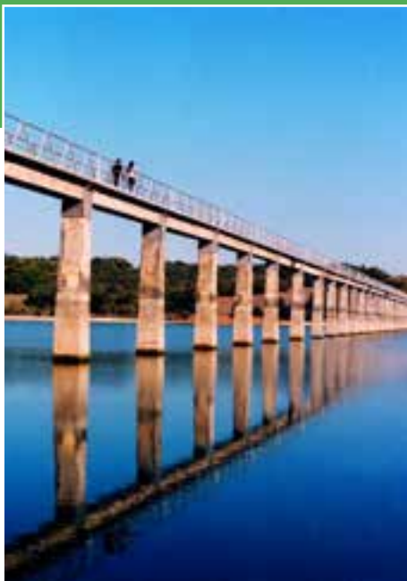
Urtegia (Azua). R. Argote

HERRIAN: Publicación de la Asociación de Concejos de Álava. 15.300 ejemplares gratuitos.