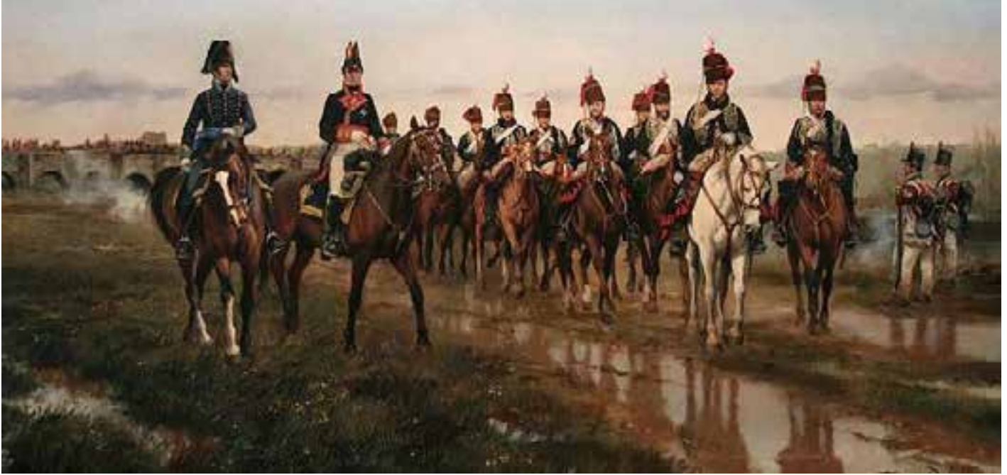
Cuadro de Ferrer-Dalmau que muestra al General Álava junto al 15º de Húsares del Ejército británico junto al puente de Trespuentes

caballo, dejando atrás el botín del saqueo. El botín que José Bonaparte se llevaba a Francia, tras los saqueos, era gigantesco. Se ha estimado en unos 100 millones de dólares de 2006 entre oro, plata y otras obras de arte. Incluía importantes pinturas.