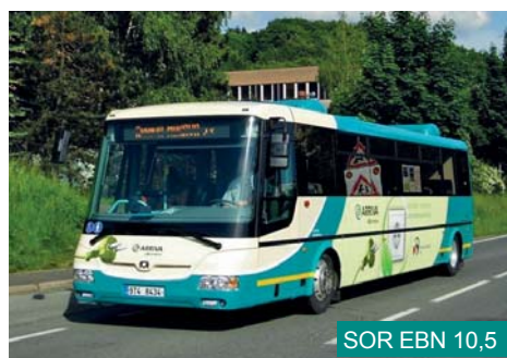
SOR EBN 10,5

Veřejnosti se na jenom místě představily čtyři elektrobuse různých firem a to ŠKODA SOLARIS Urbino Electric, elektrobuse BYD eBUS-12 a Rošero EVC, elektromobily i elektrokola.