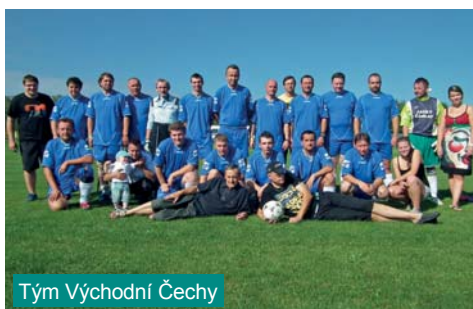
Tým Východní Čechy