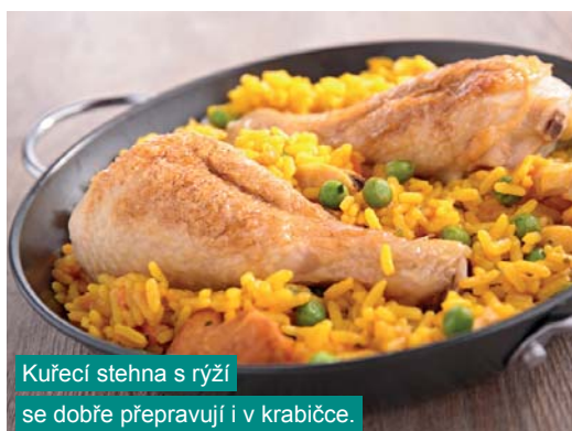
Kuřecí stehna s rýží se dobře přepravují i v krabičce.

Tohle budete číst dost neradi – jsou to totiž právě ty pokrmy, které máme nejraději. Není to vlastně žádné překvapení – už jste se někdy cítili svěží a plní života po spořádání talíře knedla vepřa zela? Asi těžko. Zkuste si ho dát bez knedlíku. Nebo si radši dopřejte něco lehčího, ale vydatného, jako jsou míchaná vejčička se slaninou. Výrobky z bílé mouky (knedlíky, těstoviny, pečivo), sladkosti, polotovary, smažená jídla a hlavně přejídání dají našemu tělu pořádně zabrat. Veškerou energii investuje do nich, a zatímco se s nimi trápí, my se trápíme také – únavou a nedostatkem nadšení pro cokoli. ■