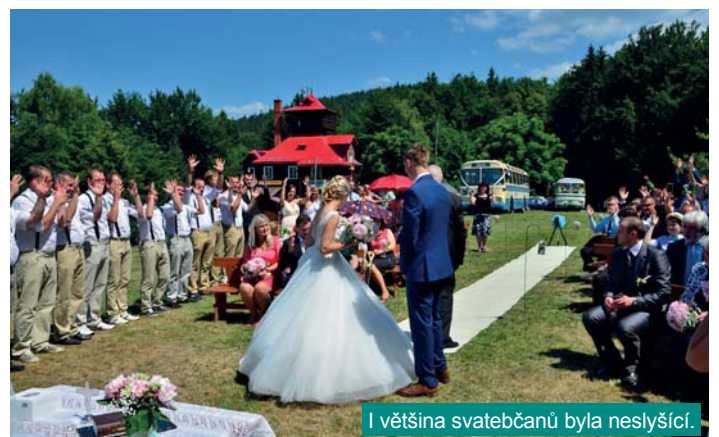
I většina svateččanů byla neslyšící.