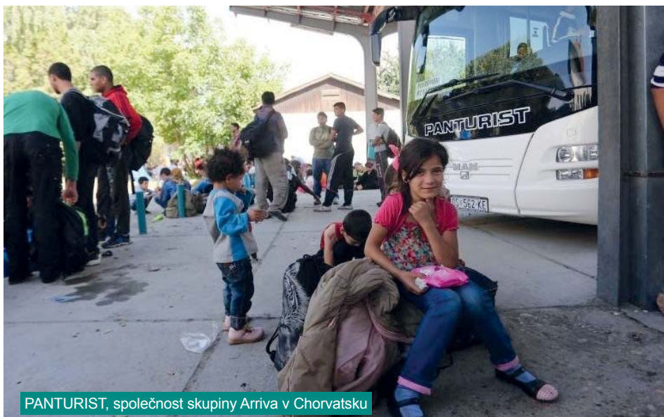
PANTURIST, společnost skupiny Arriva v Chorvatsku