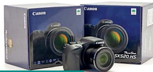
Canon PowerShot SX520 HS

K zařazení do soutěže o fotoaparát je nutné vyplnit všechny výše uvedené otázky/údaje. Vystřižený dotazník pošlete poštou na adresu: ARRIVA TRANSPORT ČESKÁ REPUBLIKA a.s., Lucie Nádvoříková, Křížkova 148/34, 186 00 Praha 8, nebo vyfocený či naskanovaný e-mailem na arrevue@arriva.cz (musí být vše čitelné) s předmětem „Anketa“ nejpozději do 10. 11. 2015. Výhry budou předány ještě před Vánoci. Odesláním vyplněné ankety udělujete souhlas s poskytnutím a zpracováním osobních údajů.