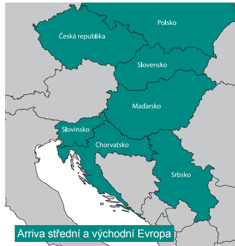
Arriva střední a východní Evropa