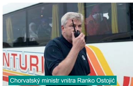
Chorvatský ministr vnitra Ranko Ostojić

Může to být výhledově příležitost, jak získat nové řidiče. Když přijedete do Anglie, tak nevidíte Angličana, který řídí autobus. Je to důsledek předchozích migračních vln