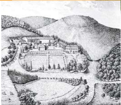
Region Lorraine - service du patrimoine

Les fouilles de 1909 ont mis à jour les ruines d'une trentaine de cabanes et d'un silo à grain, de nombreux objets (couteaux en fer, pièces de monnaie et parures féminines, fibules et bracelets). La plupart de ces objets font actuellement partie de la collection des musées de Nancy et de Toul. Le site fut vraisemblablement abandonné au cours du premier siècle avant notre ère.