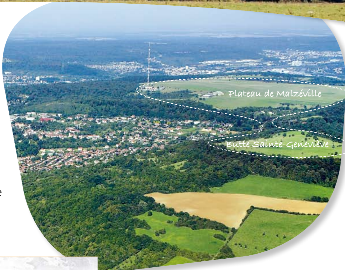
Plateau de Malzéville

Elle témoigne donc de l'ancien niveau des terrains, à une période où la région nancéienne était occupée par des fonds marins ! Sous une épaisseur de calcaires perméables, se trouve une couche de minerai ferreux qui s'est également formée à partir de dépôts marins. Les premiers occupants de la butte ont exploité cette ressource. Des entrées de mines étaient d'ailleurs visibles jusque dans les années 50. Aujourd'hui, ces terrains calcaires sont le support d'une flore bien particulière dite "calcicole".