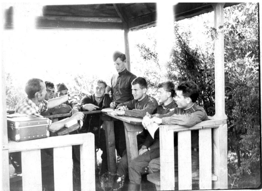
Разбор полетов. Марьяновка, 50-е гг.

Вообще-то культпросветучреждения появились во многих селениях еще в 30-е годы, но во время войны некоторые из них закрыли, а после Победы их сеть начали восстанавливать.