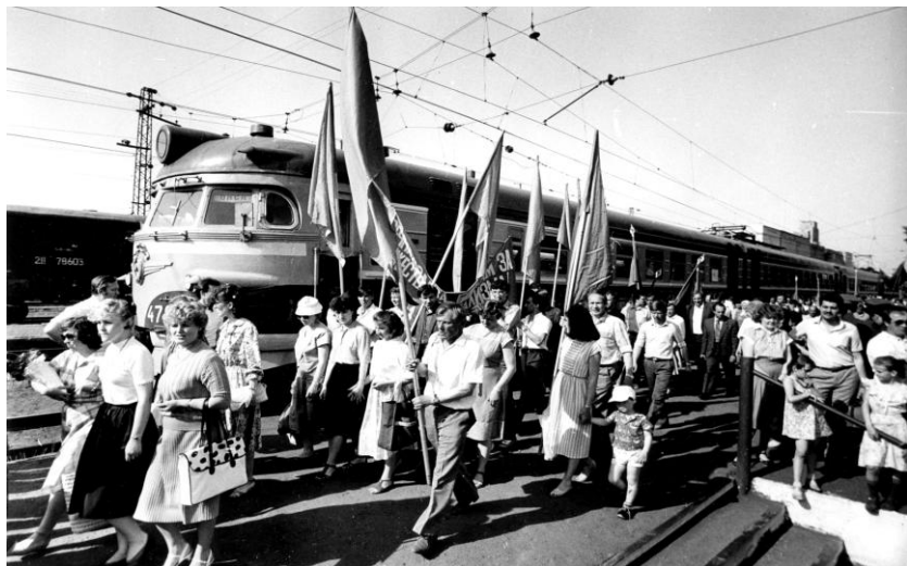
Прибытие омичей на 70 - летний юбилей Марьяновских боев. 1988 г.