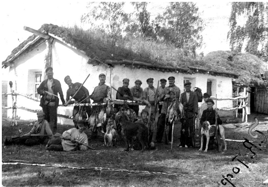
Марьяновский коллектив охотников и рыбаков. 1929 г.