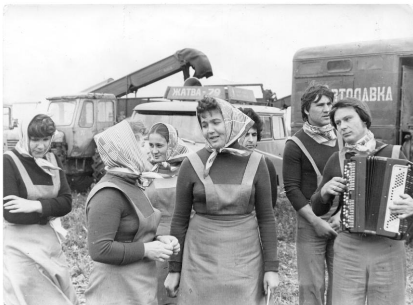
Агитбригады Марьяновского районного дома культуры.