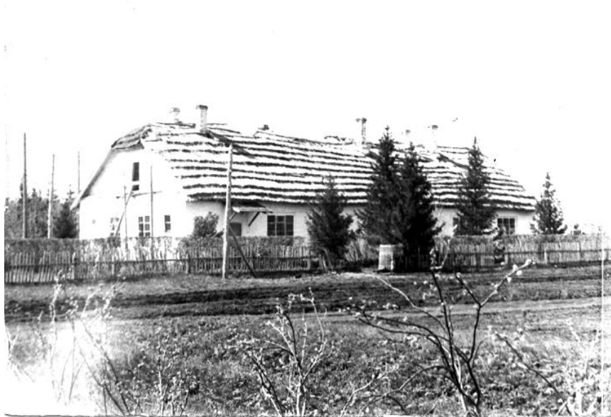
Старый клуб в Москаленском зерносовхозе.