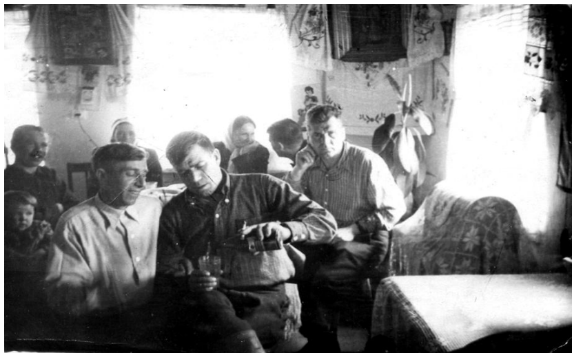
Рабочие тракторной бригады колхоза «Большевикский путь» празднуют пасху. Усовка, 1957 г.