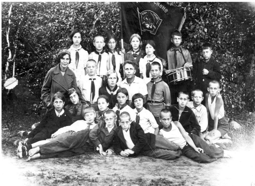
Пионерский отряд. 30-е г.г.