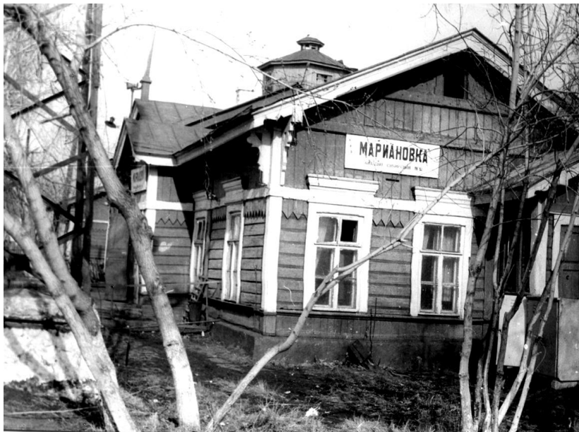
Железнодорожный вокзал. 1997 г.

Звезда. Командарм - 5 Тухачевский наверное с нашей станции давал телеграмму Ленину о взятии Омска.