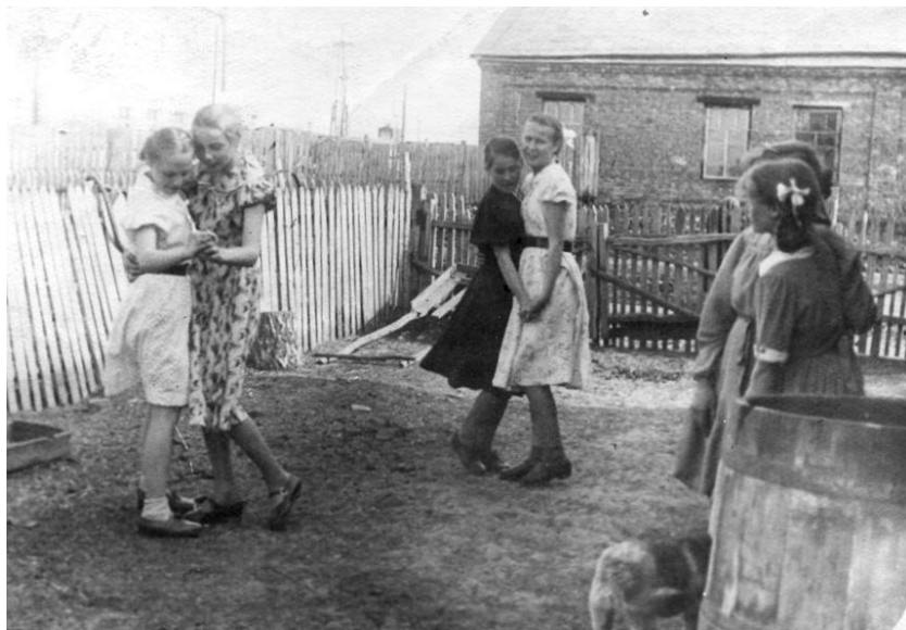
Танцы во дворе. Марьяновка, 1958 г.