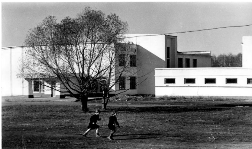
Культурный комплекс в Заре Свободы. 1984 г.