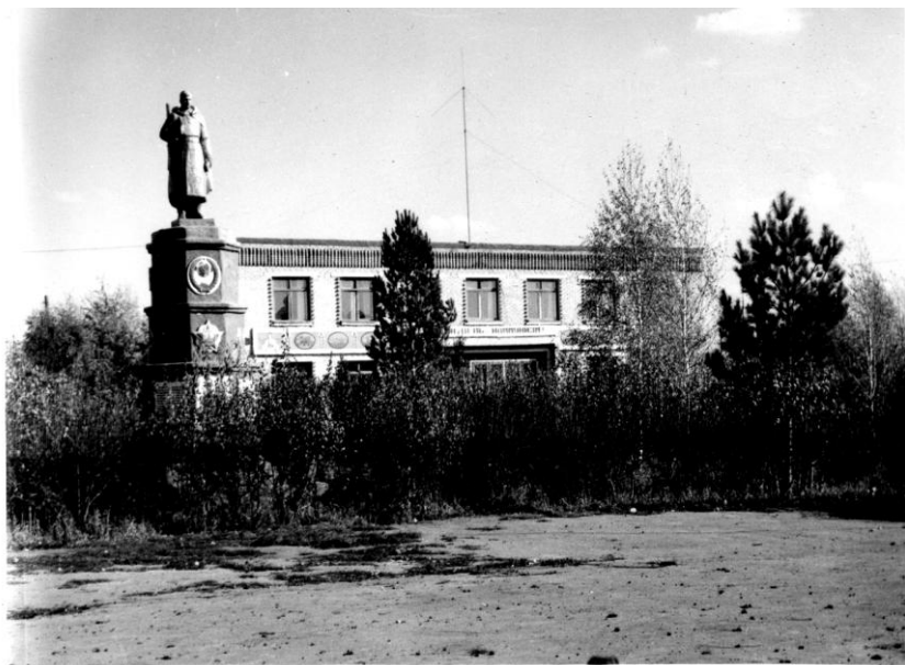
Памятник воинам Великой Отечественной войны в селе Орловка.