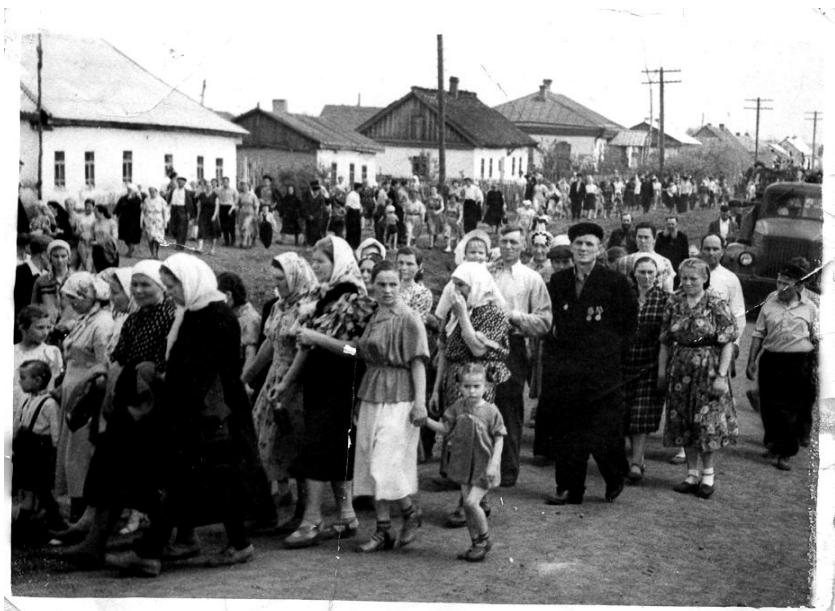
Перезахоронение останков красногвардейцев, процессия идет по ул. Омской. Марьяновка 1958 г.

Музей закрыли, а предметы фонда передали сначала в районный дом культуры, потом в школу. Самые ценные, в том числе пулемет, забрали в Омск.