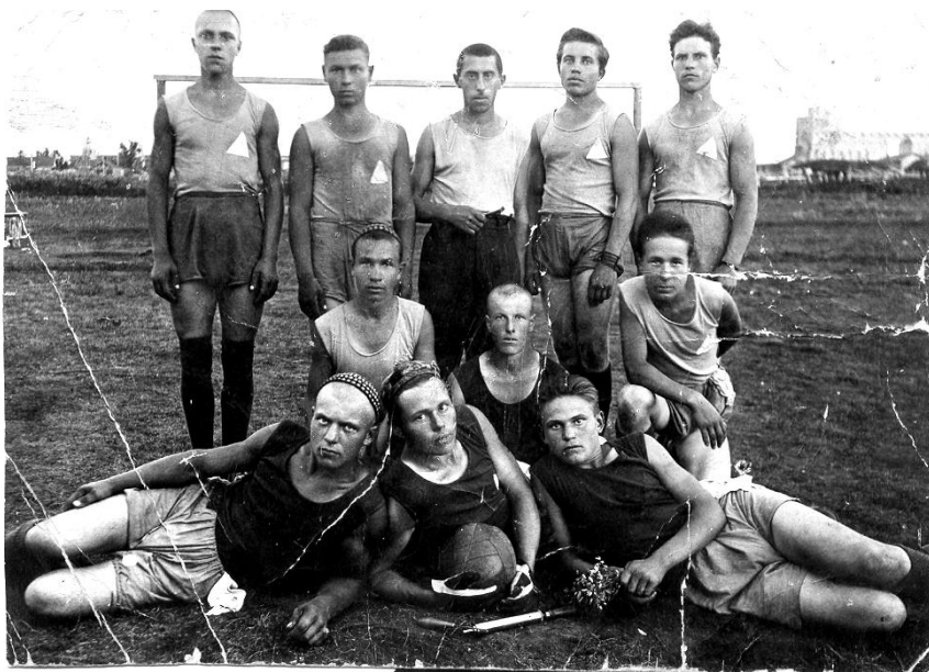
Команда футболистов на стадионе. Марьяновка, 1935 г.