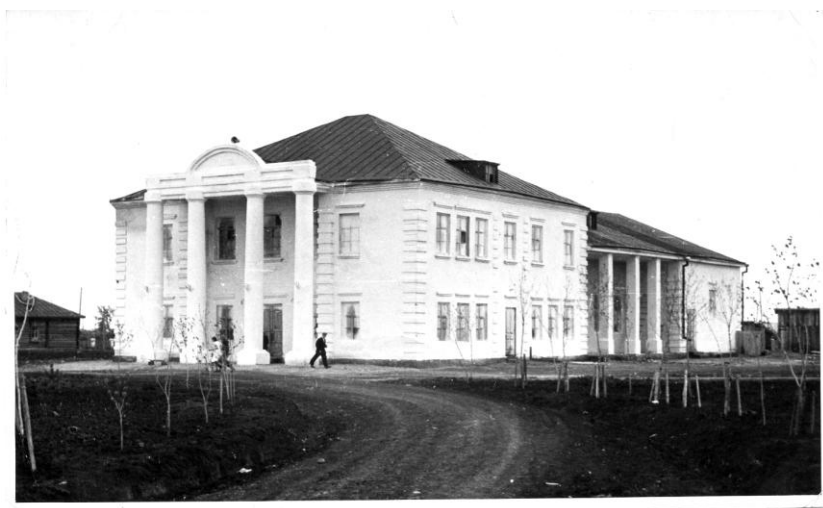
Новый дом культуры. Марьяновка, 50-е гг.