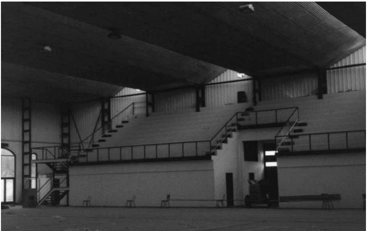
• El Socios ya terminado en noviembre de 1985.