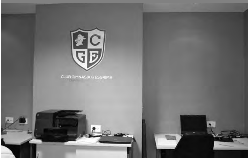
• La secretaría del club “mens sana” funciona al ingreso del Socios Fundadores.