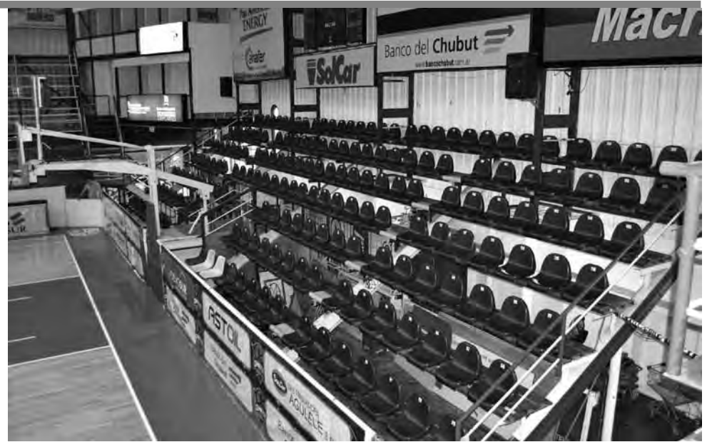
• Las butacas también fueron arregladas y pintadas para la nueva temporada de la Liga Nacional.

importantes de la institución, para potenciar la comodidad y de los espectadores en el Socios. Además, la oficina de ingeniería se encuentra en el primer piso de la nueva secretaría. Funciona como una sala de reuniones de la Comisión de Obras que se encarga de ejecutar todas las mejoras en el Socios Fundadores. Cuenta con un gran ventanal que brinda una vista espectacular hacia el campo de juego, por lo cual también sirve para observar los partidos y espectáculos. Asimismo, en la zona inferior a las plateas A y B (que están atrás de los bancos de suplentes) se generó un pasillo de circulación para la comodidad de los espectadores al momento de ir hacia los baños o los puestos de venta y así evitar las concentraciones o el ingreso a la cancha durante los