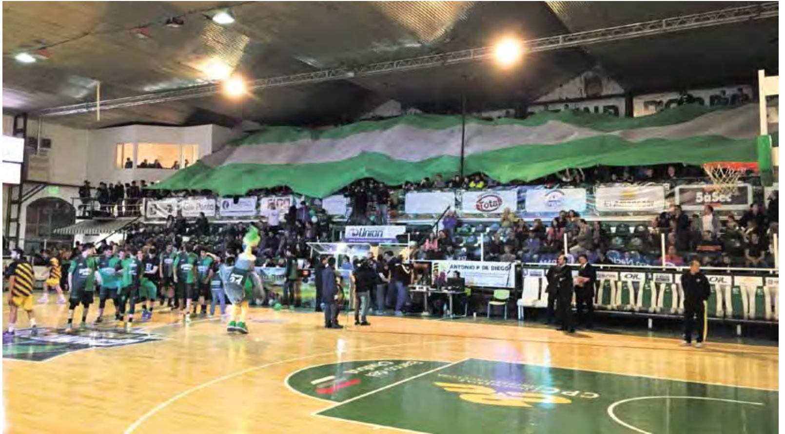
• El Socios Fundadores luce a pleno con la gran bandera que fue hecha para alentar cada presentación de Gimnasia Indalo.

Costó pero finalmente accedió a la charla. El Socios Fundadores podrá ser de los más ruidosos a la hora de los partidos, sin embargo cuando el tablero llega a cero y se acaban los juegos él vuelve a su perfil bajo. No es amigo de los micrófonos ni las redes sociales, su única interacción con la gente es en el día a día. “Para la farándula y esas cosas está Charito”, se excusó de entrada para tratar de esquivar la nota pero cuando le dijimos que era para la gente no se pudo resistir.