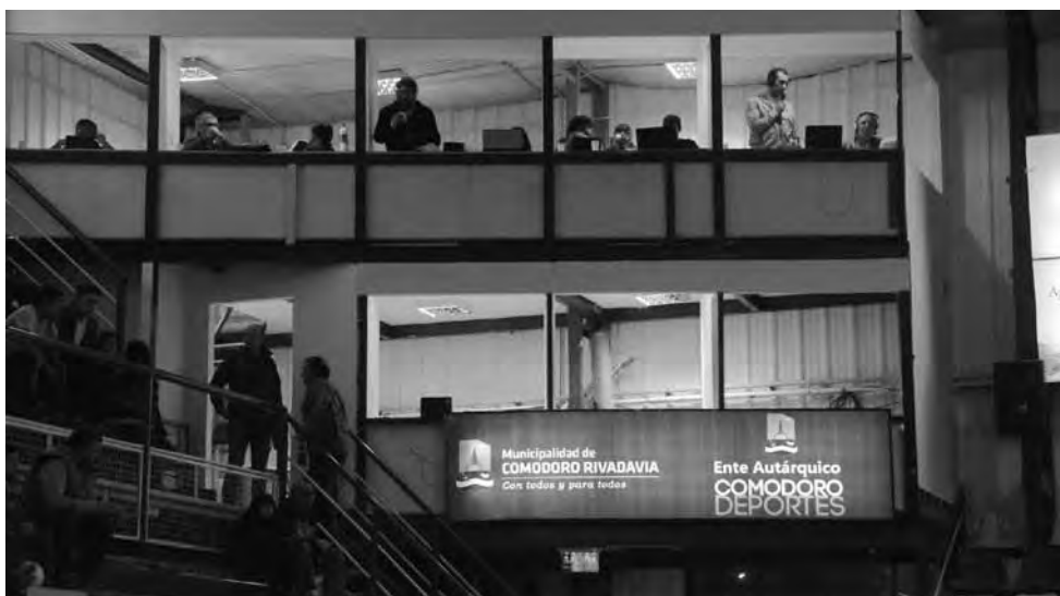
• Los periodistas ya disfrutan en esta temporada de las nuevas cabinas construidas en el Socios.

Por otra parte, tanto el sanitario de damas como el de caballeros fue reconstruido a nuevo con el cambio de inodoros, mingitorios, canillas y lavatorios. Además se realizó el revocado de todas las paredes y se colocó cerámica y azulejos. Este sin dudas es uno de los progresos edilicios más