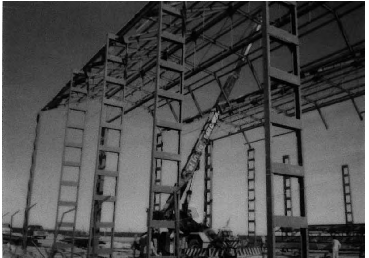
• Los inicios de la construcción del Socios Fundadores justo en frente del océano Atlántico.

petrolera continuaron y a fin del año 1979 se realizó una nueva propuesta que abarcaba el mismo importe por la mitad del predio. Esta nueva oferta es vista con buenos ojos por los dirigentes debido a que con el dinero de la venta parcial se podría construir el polideportivo en los 3.300m 2 que le quedaban al Club. La CD veía una gran posibilidad de construir el anhelado gimnasio y decide llamar a asamblea extraordinaria para el 22 de diciembre en la ex sede de la calle San Martín. En la misma se expuso a los socios el croquis preliminar del futuro polideportivo a construir con las medidas reglamentarias, tribuna, oficinas, casa para el encargado y quincho, además de un frontón para jugar pelota paleta y cancha de tenis en la parte abierta. La venta parcial del terreno se aprobó por unanimidad y el sueño ya tenía su sustento económico. Rápidamente se contactó con Acrow, una empresa norteamericana dedicada a las construcciones livianas, y se llegó a un acuerdo para que con ese monto se compren los elementos y se construya luego el Poli. Sin embargo nada es tan sencillo en la vida de Gimnasia y la construcción del Socios Fundadores no fue la excepción. Los dirigentes tenían todo arreglado con Acrow pero necesitaban que los elementos ingresen al país con libertad de derechos de importación e IVA. Se llegó a reunirse con el mismísimo Juan