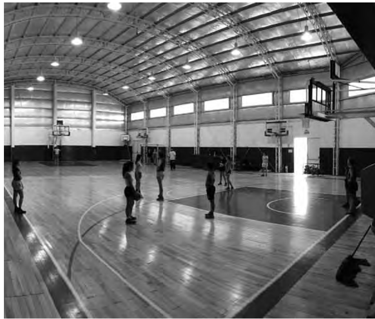
• El gimnasio auxiliar es una de las grandes obras que se realizó en el Socios Fundadores.

partidos. Para la actual temporada de Liga Nacional se renovaron las antiguas butacas de las plateas A y B, que están atrás de los bancos de suplentes; C y D que se ubican atrás del aro que da hacia la calle Ducós; y la platea F que está hacia sobre el ingreso por Sáenz Peña. Con esta renovación se estandariza el color verde para las ubicaciones de los plateistas y abonados, a quienes también se les brinda una mejor comodidad para observar los partidos y los distintos espectáculos que se brindan en el Socios Fundadores. Por un nuevo material con un diseño con mayor estética y los actuales escudos del club, fueron reemplazadas las antiguas lonas de publicidades. Así se renueva