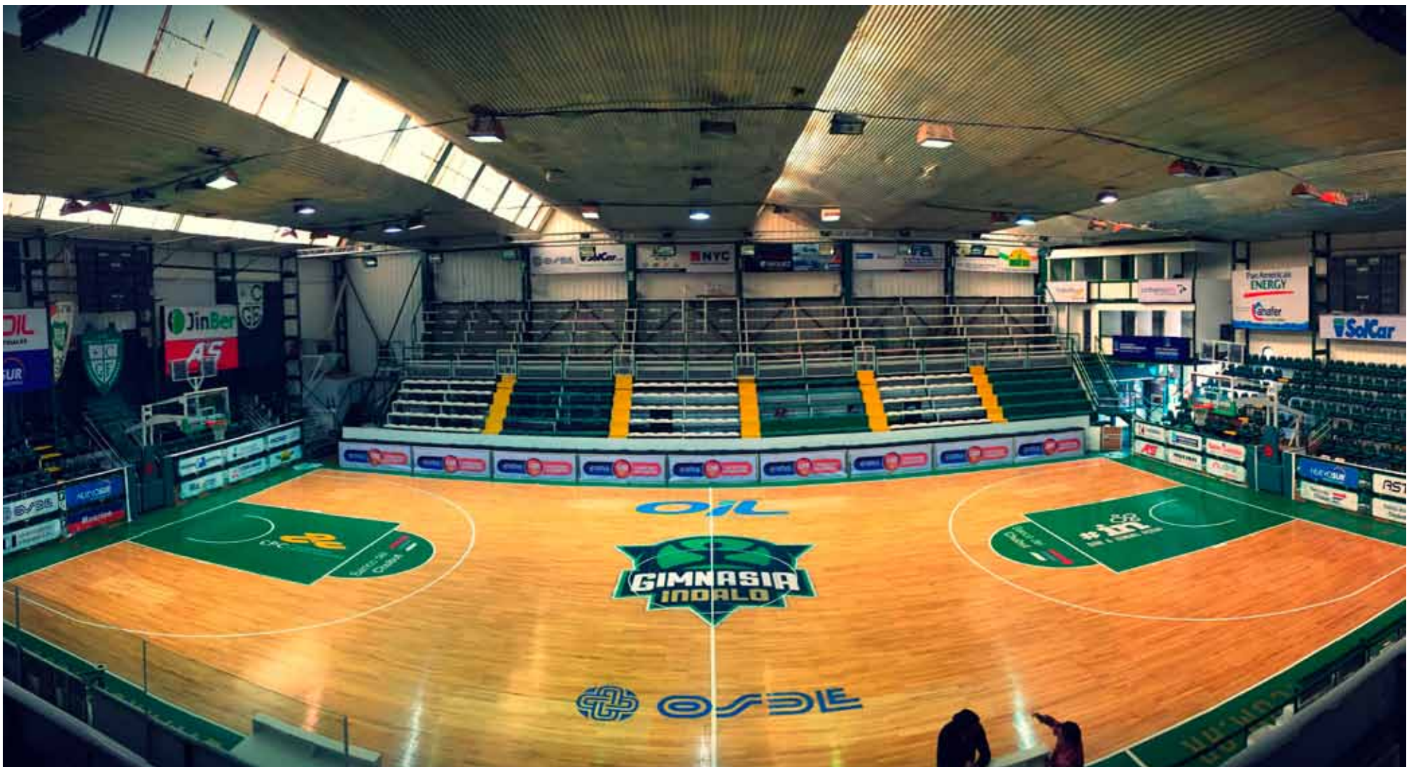
• El Socios Fundadores es el estadio más austral que tiene la Liga Nacional A de Básquetbol.

El estadio, que se encuentra a escasos metros del océano Atlántico, está hoy de festejo. No sólo se disfruta de la Liga Nacional de Básquetbol, sino también de diferentes acontecimientos que fueron pioneros en la vida social de los primeros años de la capital petrolera. Así, entre sus paredes se llevaron a cabo bingos, recitales, actos políticos, festivales de boxeo y años atrás en la historia hasta se realizaban los tradicionales bailes. Por ello, el Socios Fundadores es un símbolo para los comodorenses que trasciende más allá de la actividad deportiva que hoy lleva a que los mejores equipos de la Liga Nacional de Básquetbol midan su potencial en el renovado parquet. Asimismo, se puede albergar distintos tipos de actividades con las ampliaciones que se fueron dando y ha demostrado a lo largo de todo este tiempo que es uno de los escenarios que sirve y mucho para la comunidad. Es el estadio más austral que tiene la LNB y ya lleva 27 temporadas ininterrumpidas hoy con su equipo Gimnasia Indalo, que precisamente se encuentra como importante protagonista en la actual temporada.