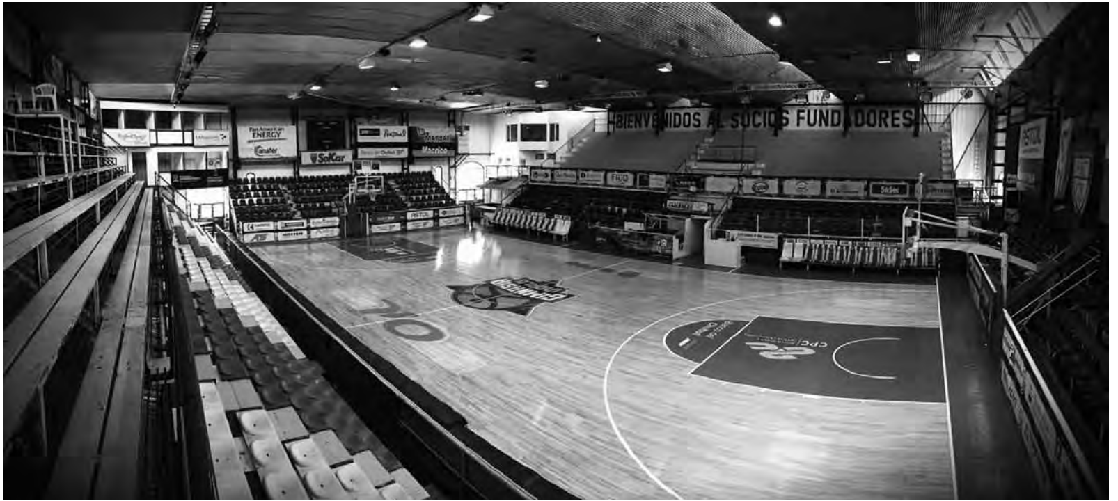
• El Socios Fundadores fue remodelado y luce como nuevo sobre la avenida Ducos.

Gimnasia y Esgrima cuenta con uno de los estadios de básquet más reconocidos del país. Por la fortaleza del equipo, el acompañamiento del público y sobre todo por su gran atractivo en infraestructura, el Socios Fundadores es uno de los íconos en donde se juega la Liga Nacional. Además se desarrollan muchas actividades más como básquet formativo, hándbol, fitness y zumba, debido a su gran extensión en metros cuadrados y su doble cancha. También es centro de espectáculos artísticos, solidarios y deportivos que se desarrollan en la ciudad. De esta manera, hace algunos años se comenzó a trabajar en diversos proyectos de obras que le dan una mejor calidad a un espacio emblemático para los comodorenses. Entre todas las mejoras se pueden observar la construcción de un campo de juego auxiliar para el mejor aprovechamiento del espacio para las divisiones inferiores y los entrenamientos del primer equipo, un salón de usos múltiples, una nueva secretaría, la renovación de los baños principales y el nuevo sector asignado a la prensa. Estos trabajos de mejoramiento potencian las experiencias que se desarrollan en el club, que se generan gracias