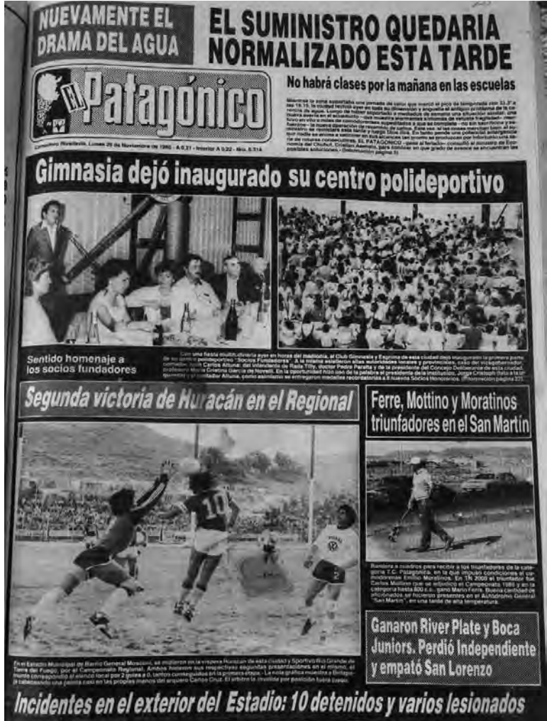
• Diario El Patagónico publicó la inauguración del Socios.

Hace 30 años se inauguró el Socios Fundadores, hogar de Gimnasia y Esgrima y de todo Comodoro Rivadavia. Te contamos la historia de la construcción del estadio más importante de la ciudad y la región.