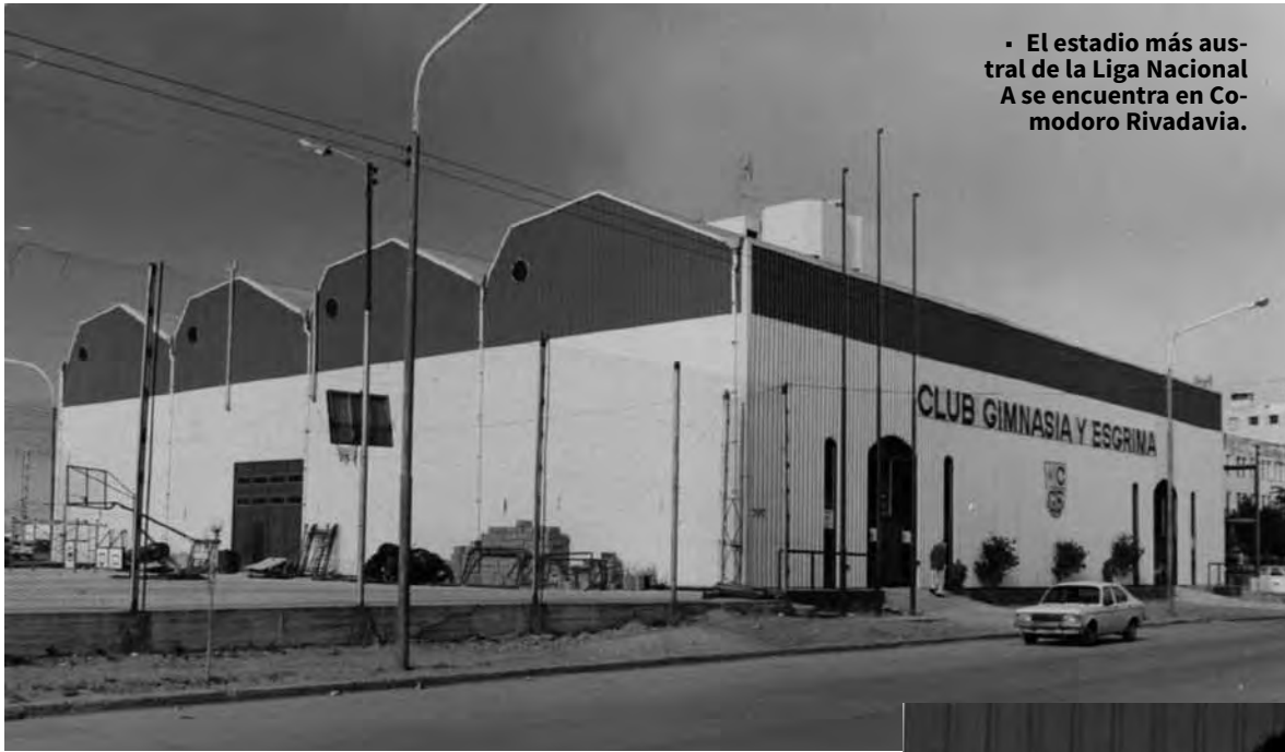
• El estadio más austral de la Liga Nacional A se encuentra en Comodoro Rivadavia.