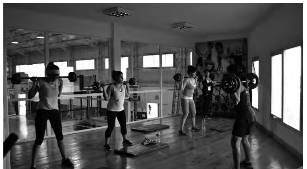
• El gimnasio de fitness quedó instalado con vista al mar.