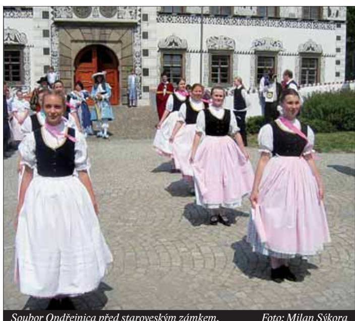
Soubor Ondřejnick před staroveským zámek.

Festival Poodří Františka Lýska přilákal nové tanečnický a zpěváky