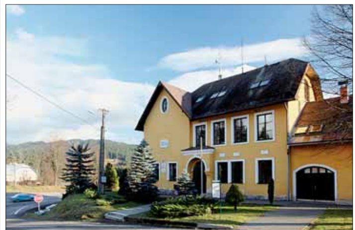
Ve Starých Hamrech funguje dodnes základní škola. Dochází do ní jen čtrnáct dětí, ale je znamením toho, že obec žije.