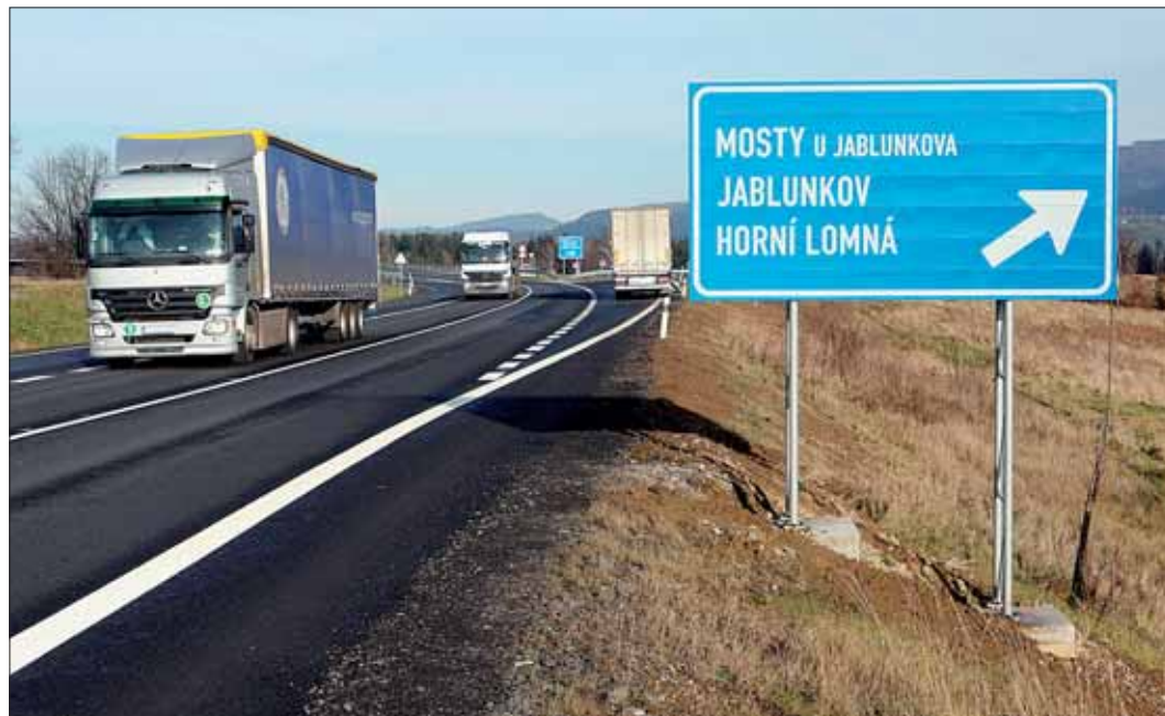
Nový obchvat odvedl dopravu z centra Jablunkova.

Silniční tah Česko-Polsko-Slovensko je rychlejší a doprava nebude obtěžovat obyvatele