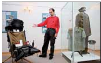
Návštěvníci výstavy v Příboře uvidí vystřelovací sedadlo ze stíhačky i uniformy.

Příbor – Svět létání člověka zajímá snad odjakživa. Nyní má veřejnost možnost vrátit se do dob československého letectva prostřednictvím výstavy v novém sále Muzea v Příboře. Je tam k vidění expozice s názvem Z dějin československého letectva – Příborsko v oblacích, kde se návštěvníci dozvědí spoustu zajímavých informací právě z této fascinující oblasti. Výstava je přístupná do 29. ledna. (hav)