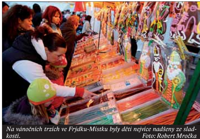
Na vánočních trzích ve Frýdku-Místku byly děti nejvíce nadšeny ze sladkostí.