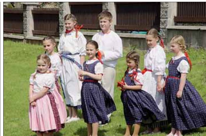
Dětský folklorní soubor Bebek z Proskovic před svým vystoupením na zahradě proskovické školy.

S posledním dnem festivalu začíná příprava dalšího ročníku. „Navazujeme kontakty se soubory, které by mohly další rok vystoupit, a také ekonomicky uzavíráme festival,“ potvrdila předsedkyně sdružení. A jaký bude šestý ročník festivalu? „Určitě zachováme dramaturgii a dáme šanci dalším regionálním souborům,