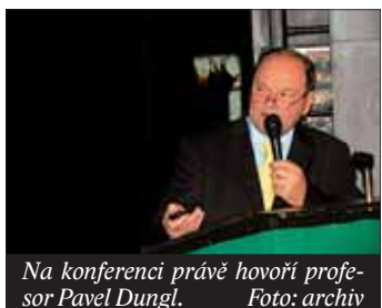
Na konferenci právě hovoří profesor Pavel Dungal.

Frýdek-Místek – Více než 400 ortopedů, rentgenologů, rehabilitačních pracovníků a revmatologů se sjelo ve dnech 22. a 23. listopadu do Frýdku-Místku na ortopedický kongres – III. beskydské ortopedické dny. Na kongresu zaznělo 56 přednášek v lékařské sekci a 25