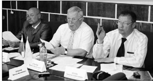
Заседание городской администрации.