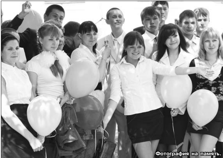
Фотография на память.