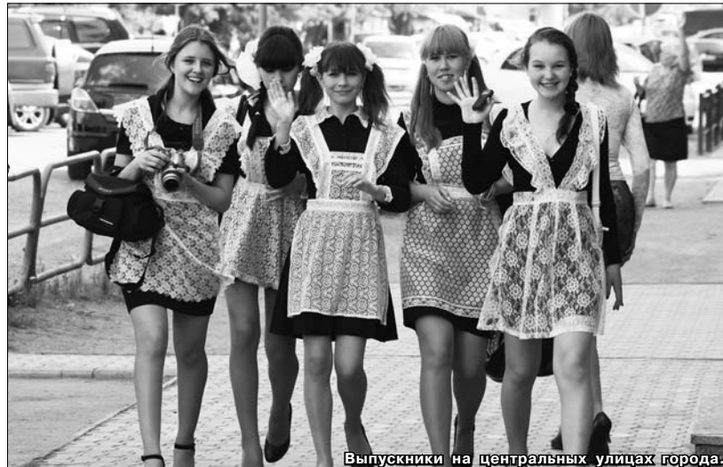
Выпускники на центральных улицах города.

– Я приехала в Шадринск изда-лека, с российско-монгольской границы и проучилась в этой школе только год, но уже успела сдружиться с классом. Очень жаль будет расставаться, для меня последний звонок – грустный праздник. Уже выбрала для себя профессию, собираюсь поступить в педагогический институт, чтобы стать психологом-логопедом. И хотя это только мой выбор, наш классный руководитель для меня пример отношения к детям.