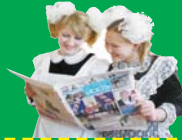
На правах рекламы.

Заканчивается подписка на второе полугодие 2010 года. Цена на газету «Исеть»: на 6 месяцев — 300 рублей; - на 3 месяца — 150 рублей; - на 1 месяц — 50 рублей. Спешите в почтовые отделения связи! Мы пишем о вас и для вас!