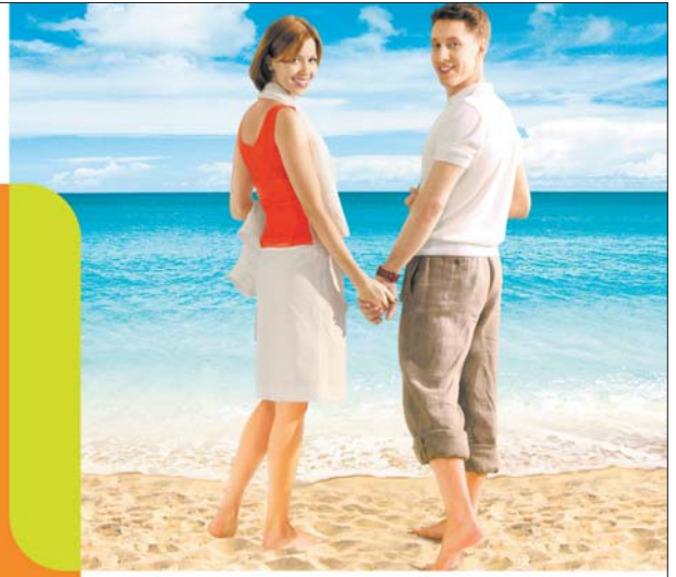
На правах рекламы.