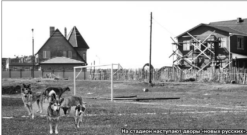
На стадион наступают дворы «новых русских».

Такое письмо прислали в редакцию жители поселка Осеево. Взяв на заметку проблему, о которой они написали, мы отправились туда, чтобы узнать и о других сторонах жизни поселка.