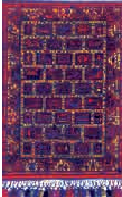
“Asırların Şarkısı”, 1981

görüntüsü, okulları tüm dünyanın ulaşabileceği şekilde açık olmalıdır. Bu hizmeti de Latif Kerimov yerine getirdi ve 1961 yılında “Azerbaycan Halısı” isimli eserinin birinci cildini yayınladı (sonraki iki cilt 1983 yılında yayınlandı). Bu eser, halı dokumacıları ve araştırmacılar için pratik ana kaynak görevini yaptı. Bu eser Latif Kerimov’un 35 yıl boyunca 1300 den fazla türü, Azerbaycan halı süslerini,