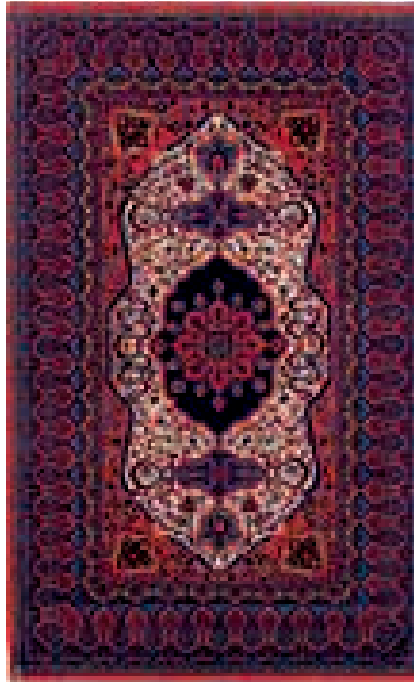
"Leçek Turunc", halısı - 1982

mahir usta, renklerin zorlu yönlerini tümünü kendinde barındıran Latif Kerimov motiflerini yaşayarak yaratıyordu, o Azerbaycan halı sanatının gizemli kuyusundan ilham ateşini almış birisiydi. O, sadece kendine özgü muhteşem tarzıyla geleneksel halı kompozisyonunu yaratmıştı. "Araz" halısı, renksel anlamı itibarıyla ve ahengiyle Azerbaycan halı sanatının tüm güzel yönlerinin en zengin seviyesine çıkartılmış örneğidir; "Yeni Halça" bu harikülade ritmik dizim ve dekoratif motiflerin orantılı kullanılmış örneğidir; "Göy-Göl" halısı, Gence yakınındaki güzel