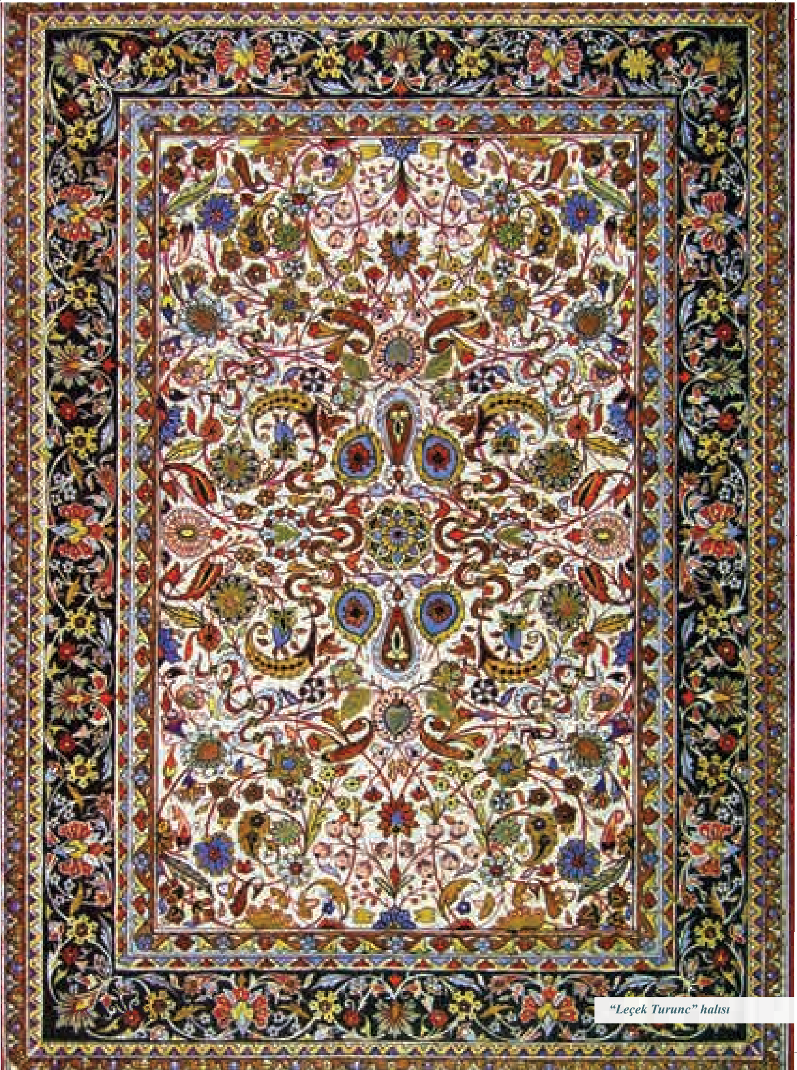
“Lecek Turunc” halısı