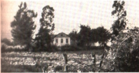
Село Кимг. Школа. Здесь преподавал Гулиа. Эти деревья посажены им в 1900 году.