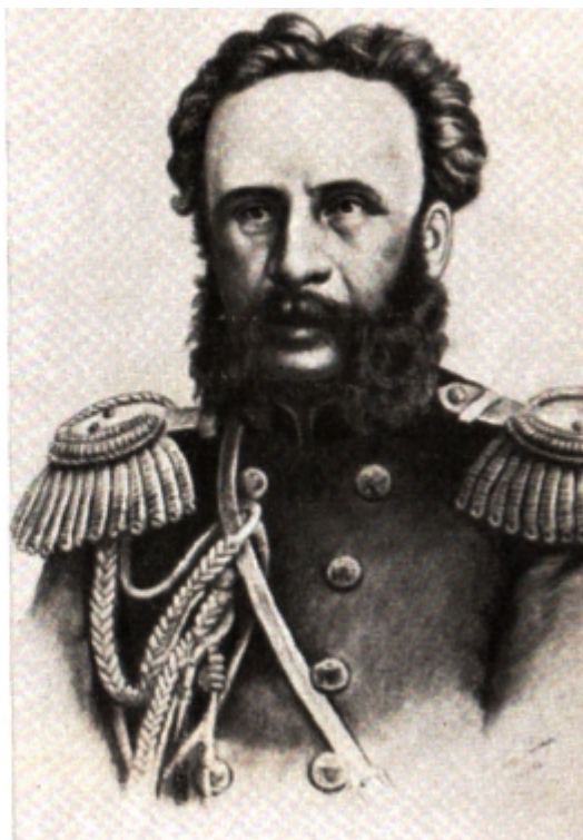
П. К. Услар.