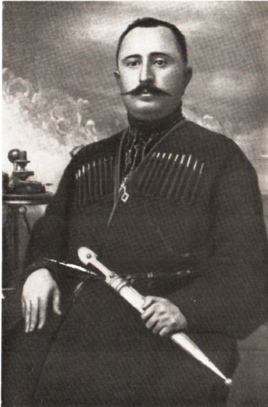
Гулиа. 1911 год.