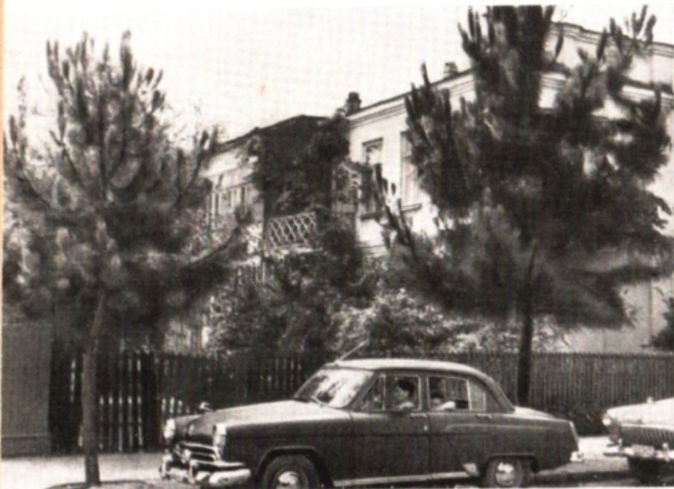
Дом Гулиа в Сухуми.