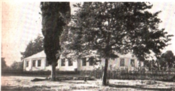
Село Тами. Школа имени Л. И. Гулиа.