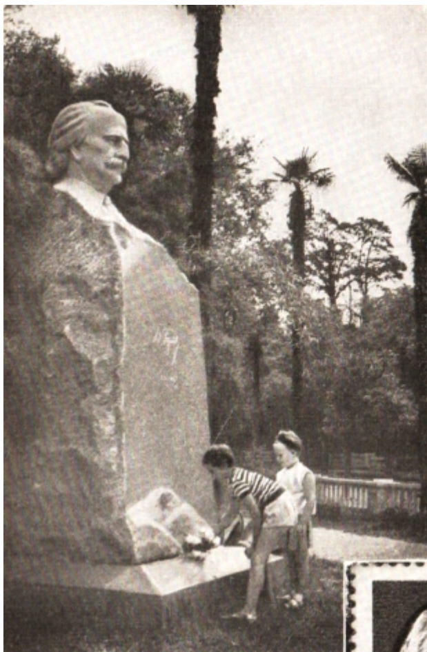
Надгробный памятник Д. И. Гулиа в центре Сухуми