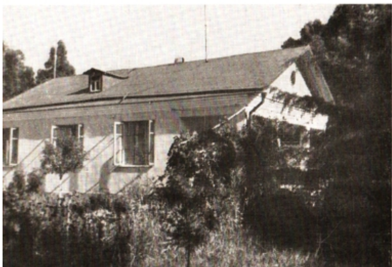
Агудзера. Дача Гулиа.