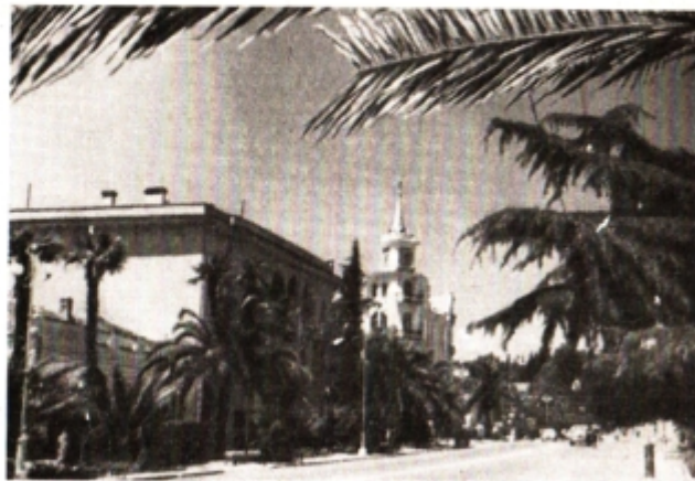
Сухуми. Улица Ленина.