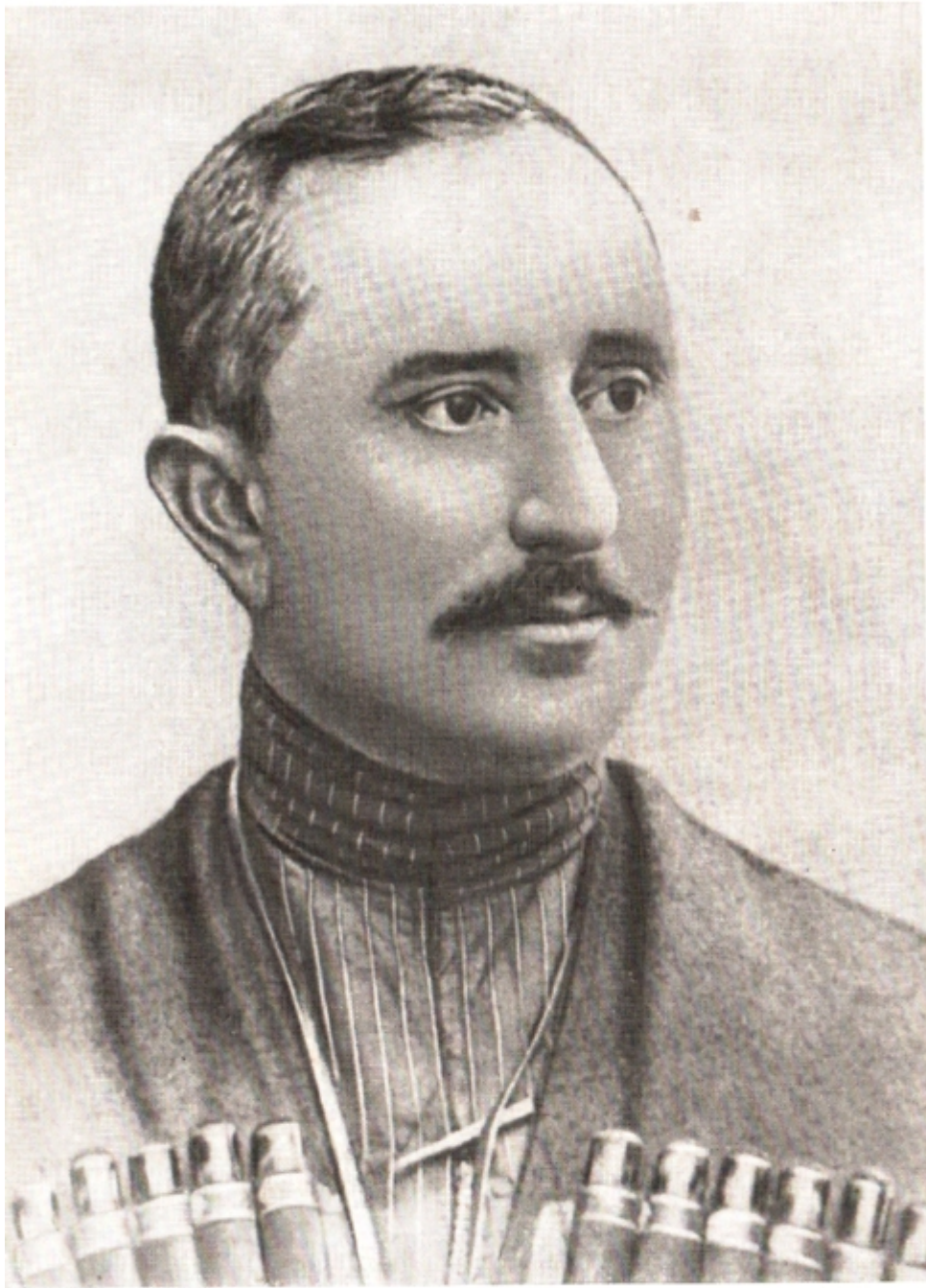
Дмитрий Гулиа. 1902 год.