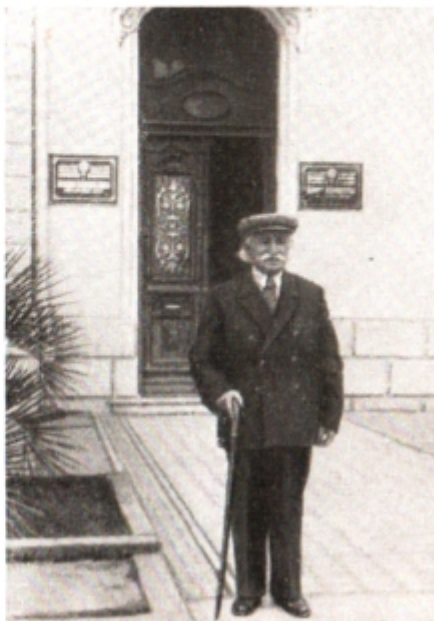
Гулиа у здания Пре- зидиума Верховного Совета Абхазской АССР.