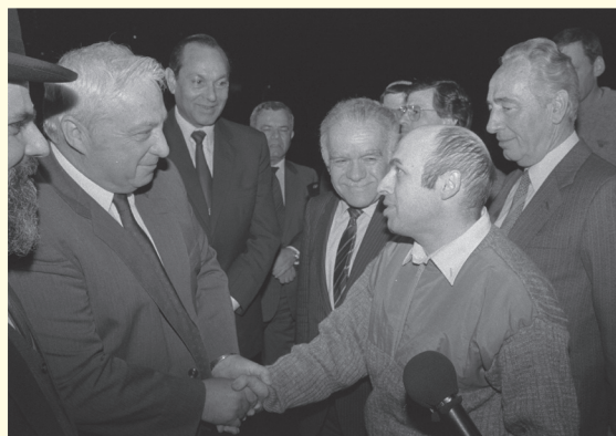
נתן שרנסקי מתקבל בנמל התעופה בן גוריון על ידי נציגי ממשלת ישראל; דצמבר 1986

נתן שרנסקי הוא בין הדוגמאות הבולטות והידועות ליהודים אשר השלטונות הסובייטיים סירבו לאפשר את עלייתם לישראל. ב-1973 הגיש שרנסקי לשלטונות ברה"מ בקשה לעלות לישראל, אך אלה מנעו את יציאתו מתחומי המדינה. הוא החל לפעול במסגרת ארגון זכויות אדם אשר שם לעצמו למטרה לדווח לעולם המערבי על הפגיעה שהתרחשה בזכויות