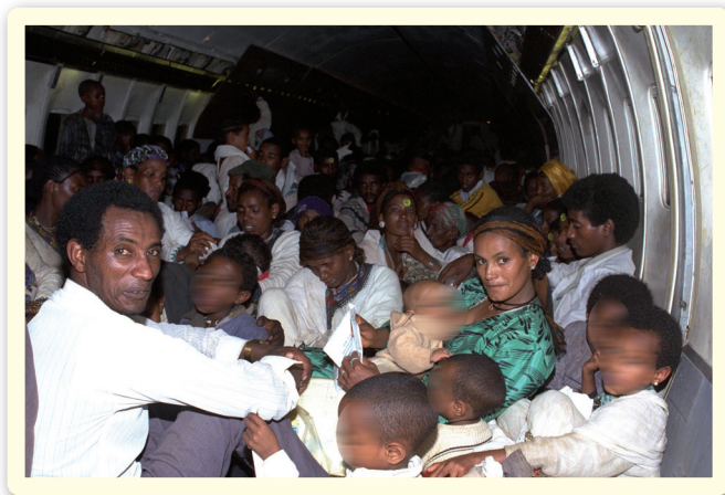
עולים מאתיופיה במטוס של חייל האוויר במהלך מבצע שלמה; מאי 1991 (התצלום ערוך)

מראשית שנות ה-70 נותקו קשריה הגלויים של ישראל עם אתיופיה, והשלטון האתיופי מנע את עליית היהודים לארץ. בתקופה זו ניסתה ישראל לפעול להעלאת יהדות אתיופיה בדרכים חשאיות ובסיועם של פעילים ציונים מקרב יהודי אתיופיה (ראו קטע העשרה שלהלן), אולם ניסיונות אלה כשלו בדרך כלל. יהודים רבים יצאו למסע רגלי למחנות הפליטים בסודן, שכנתה הצפונית של אתיופיה. במהלך מסע זה סבלו העולים מתשישות ואלפים מהם מצאו את מותם ברעב, בקור, במגפות ובהתקפות שודדים. אך אלפים אחרים הצליחו להגיע לגבול סודן ומשם הובאו לישראל במטוסים ובספינות של צה"ל (מבצע משה, 1984-1985; מבצע שבא, 1985).