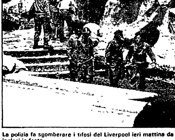
La polizia fa sgomberare i tifosi del Liverpool ieri mattina da Fontana di Trevi. In alto: tifosi inglesi in festa

In via dei Campani, che doveva essere il campo base della grande festa, un amplificatore a tutto «chord» diffonde le note di un inno giallorosso ma l'atmosfera è quasi spettrale, nessuno ha voglia di parlare. «Dovevamo fare quiz fino all'alba ed invece... non c'è più possibilità, fa con gli occhi prossimi al pianto. In via degli Equi con una certa indifferenza un tifoso sta liberando la sua auto dalla rivestitura di nastri adesivi giallorossi e poco più in là un altro, sorridente, stacca un palloncino rosso da un lampone.