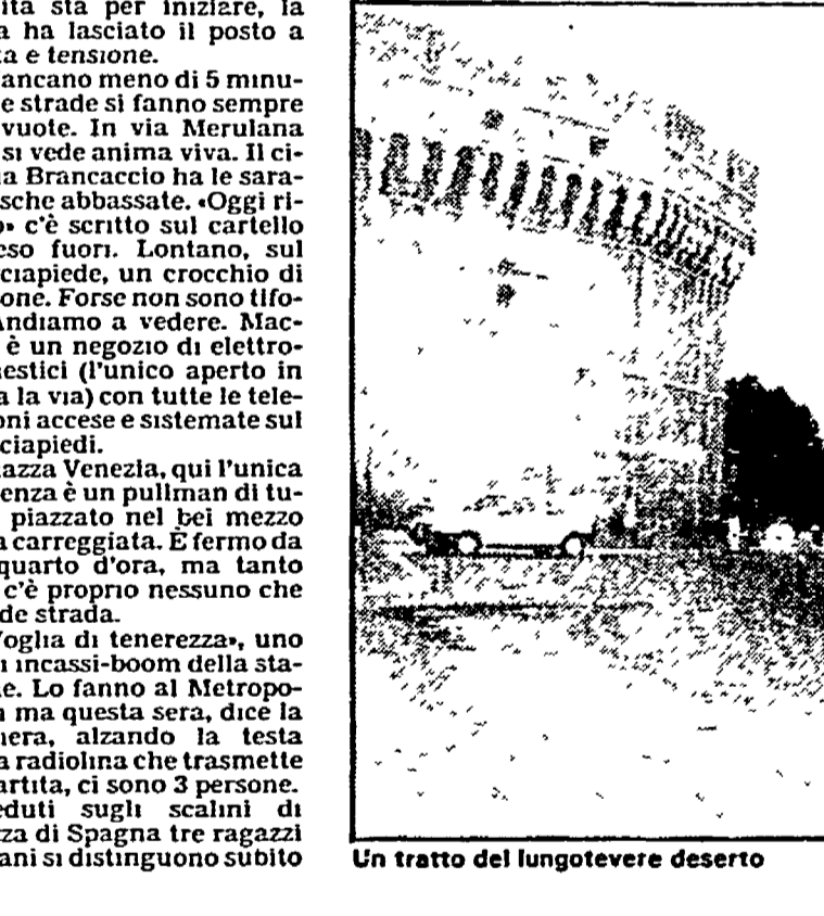
Un tratto del lungotevere deserto

In mezzo ai turisti. «Altro che, se ci sarebbe piaciuto vedere la partita, il fatto è che in caserma ci sono due televisioni in tutto. Restate lì dentro significava soffocare. Autobus semivuoti (e rarissimi), neanche l'ombra di un taxi in giro, restare a piedi in una serata come questa dev'essere un vero disastro. E i ladri? A quanto pare davanti alla TV o allo stadio pure loro. Almeno all'inizio. Alla centrale operativa le radio delle volanti tacciono. Nei corridoi della questura si sente solo la voce dello speaker dallo stadio. Solo tre segnalazioni per ladri d'appartamento, una lite furibonda in famiglia (che sia stato per la scelta del canale?) e una tifosa inglese disperata perché il ragazzo l'ha «mollata».